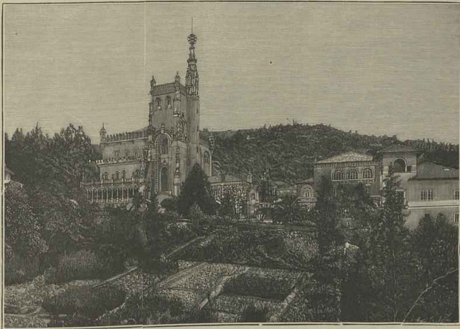
VISTA GERAL DA MATTA E DO GRANDE HOTEL DO BUSSACO (De Fotografia)

chegou o volume foram logo as musicas experimentadas. O principe ouvindo-as impava de satisfacção. Felizes tempos! (1)