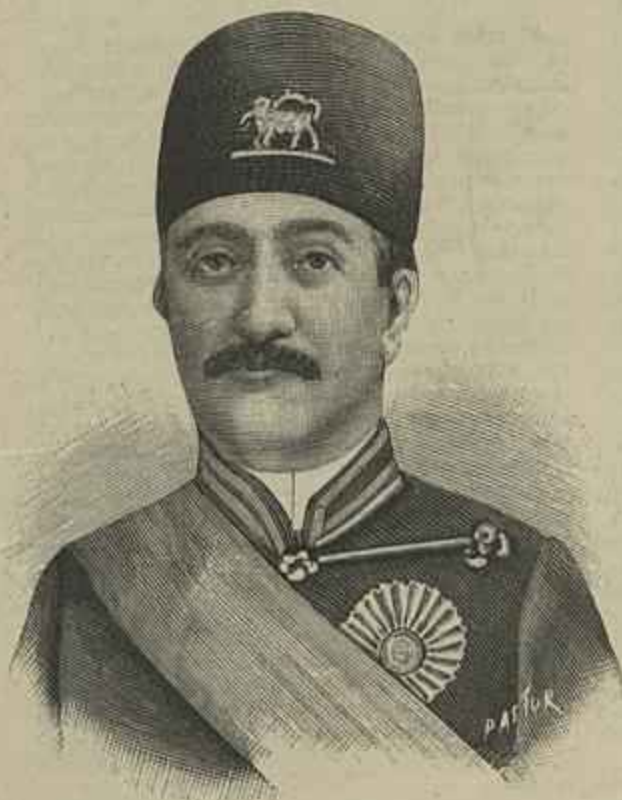
O NOVO XÁ DA PERSIA MOHAMED ALI MIRZA

Então principiou-se logo a pensar na melhor maneira de remediar o desastre e de instalar provisoriamente em qualquer templo disponivel, a patriarcal e os seus cerimoniaes