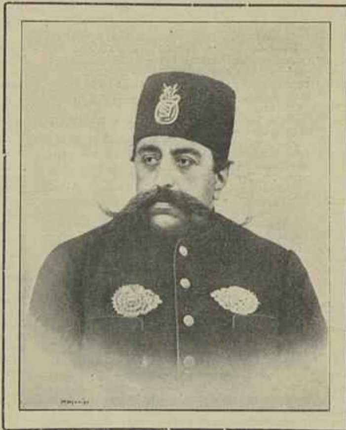
MUNZAFFER ED DINE FALECIDO XÁ DA PERSIA