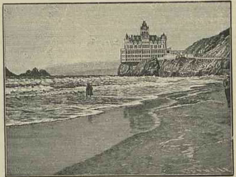
O GRANDE CLIFF-HOUSE CONSTRUIDO EM CIMA DOS ROCHEOS DESTRUIDO PELO TERREMOTO