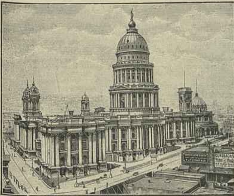
EDIFICIO DA MUNICIPALIDADE DE S. FRANCISCO ANTES DO TERREMOTO

Um dos mais bellos edificios o grande Cliff-Haus construido em cima dos rochedos que deitam sobre o mar, foi tambem destruido pelo terremoto.