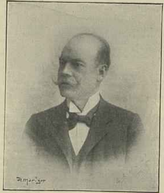
CONDE DE SUCENA