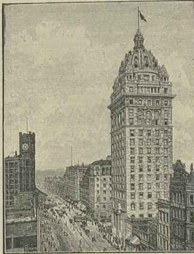
HOTEL RECLAME DE MARKETSTRASSE DESTRUIDO PELO TERREMOTO

Onde está a grande arteria da cidade, a Market-Street, essa esplendida rua la-deada de ricos edificios, a rua de maior movimento, onde os transeuntes se acote-