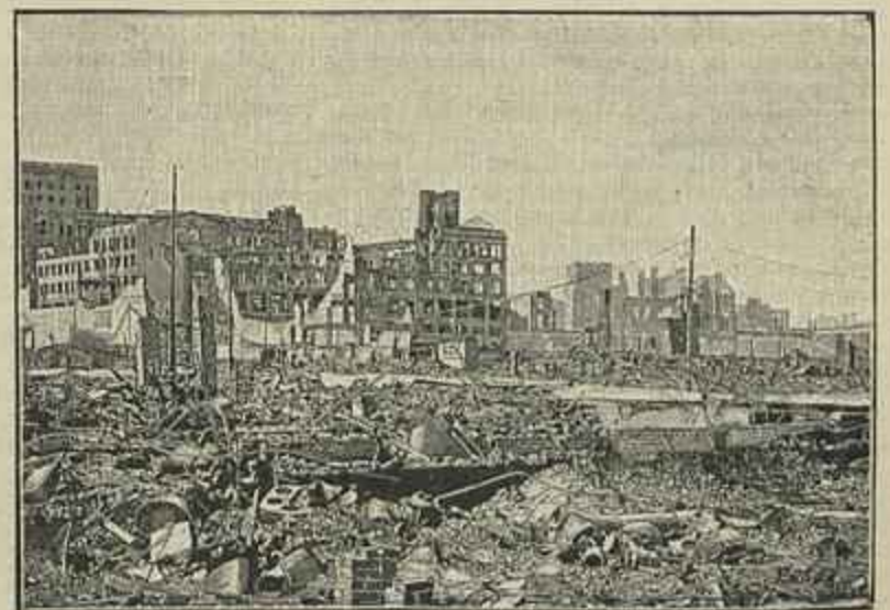
UM ASPECTO DA CIDADE DE S. FRANCISCO DEPOIS DO TERREMOTO