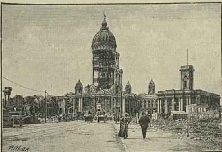
EDIFICIO DA MUNICIPALIDADE DE S. FRANCISCO DEPOIS DO TERREMOTO