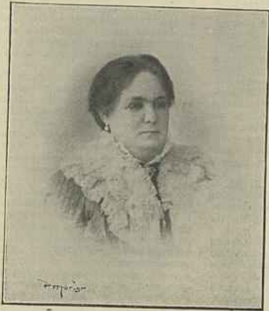
CONDESSA DE SUCENA