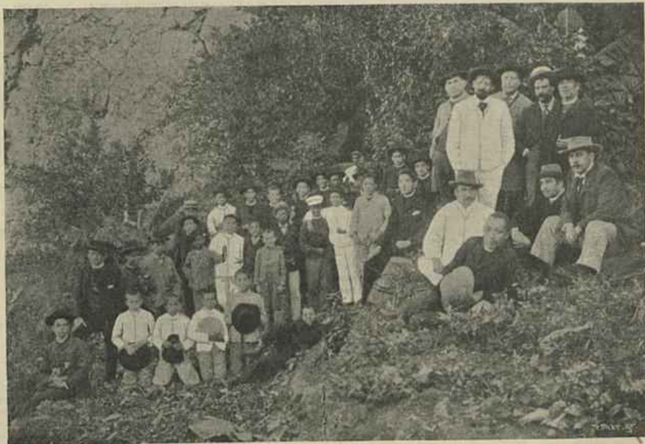
UMA EXCURSÃO DE SEMINARISTAS E PROFESSORES DO LYCEU DE CABO VERDE, NO CACHAÇO

Este quadro era destinado á Capella da embaixada portuguesa em Londres, mas segundo parece foi d'alli removido para o oratorio do paço das Necessidades, em Lisboa, pelo que refere o conde de Raczynsk a pag.ª 304 do seu Dictionnaire . Segundo leu Innocencio Francisco da Silva, que estamos seguindo.