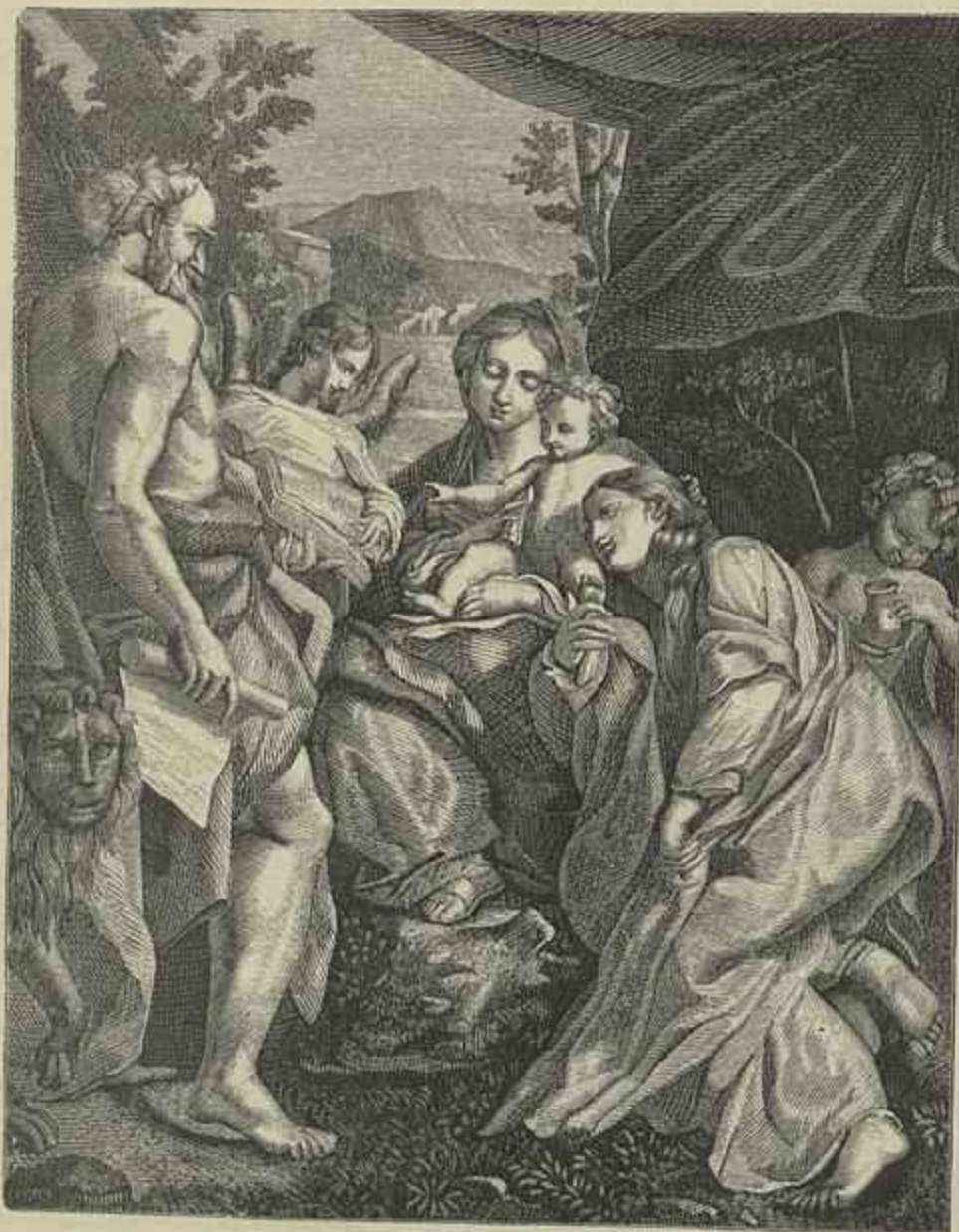
S. JERONYMO — QUADRO DE CORREGIO

Cópia feita por Vieira Portuense, pertencente aos Srs. Duques de Palmella (Gravura de C. Alberto)