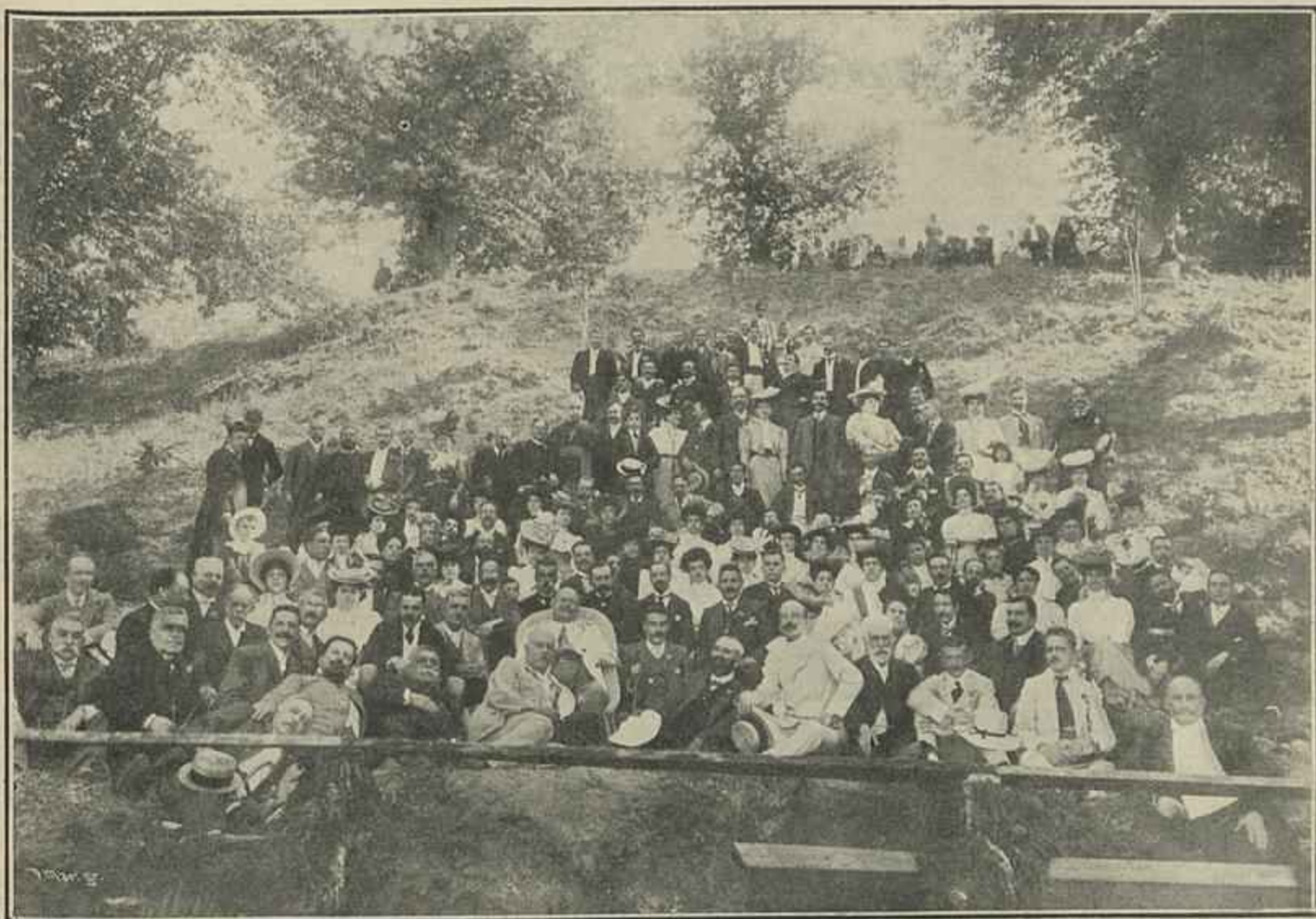
EL-REI D. CARLOS NAS PEDRAS SÁLGADAS

GRUPO DE EL-REI E AQUISTAS QUE OFFERECERAM A SUA MAGESTADE UM ALMOÇO NA SERRA