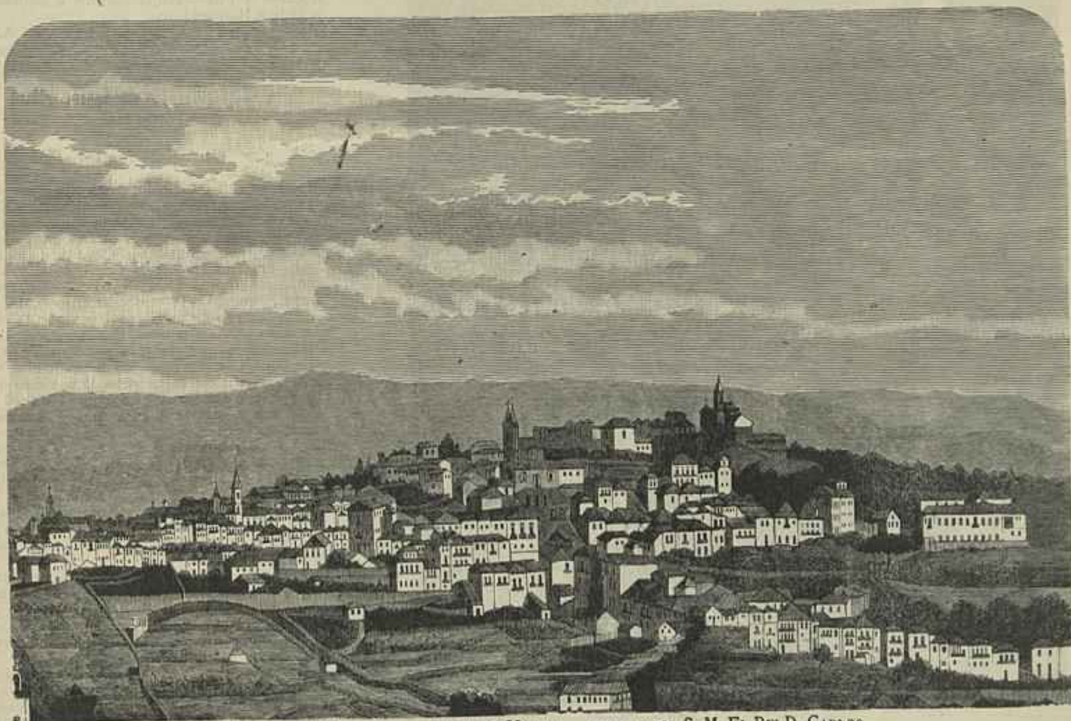
UMA VISTA DE VILLA REAL DE TRÁZ OS-MONTES, VISITADA POR S. M. EL-REI D. CARLOS (Vidê Chronica Occidental )