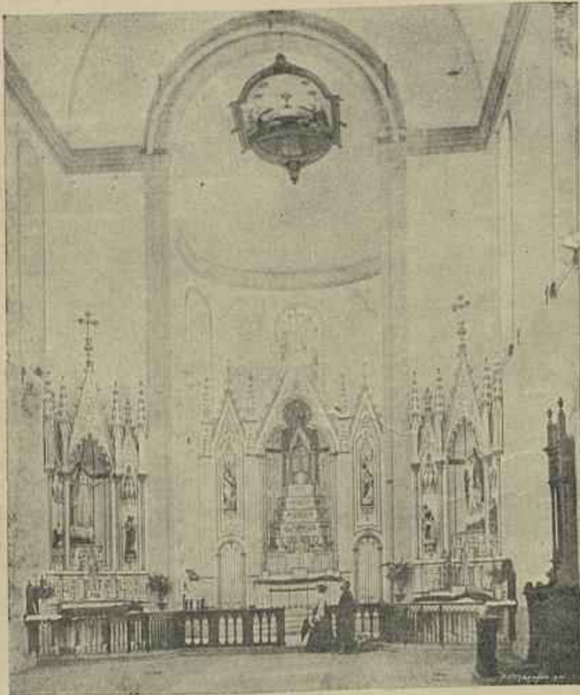
VISTA INTERIOR DA EGREJA