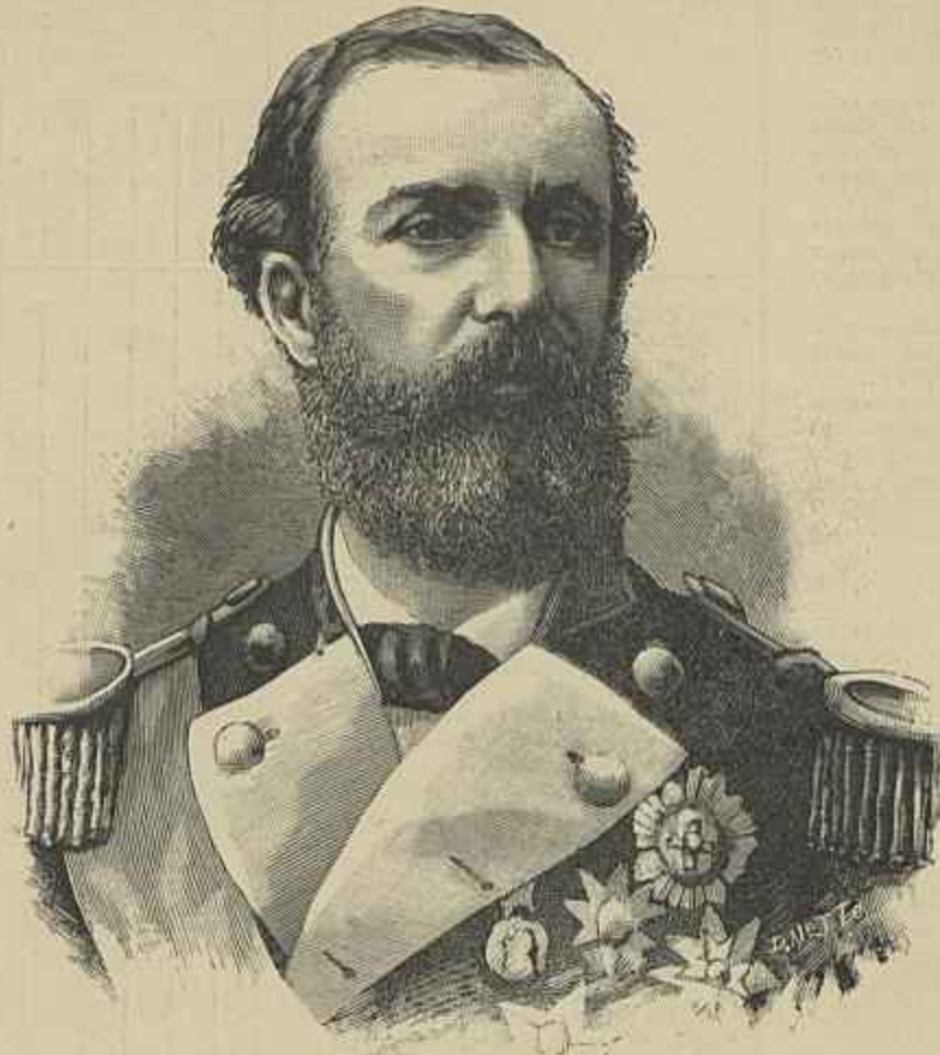
S. M. OSCAR II REI DA SUECIA E DA NORUEGA

Villa Nova de Tazem é de relativa moderna fundação e crescimento, pois que os pri- meiros foraes lhe foram dados por D. Manuel, e era então ape- nas um aggregado de habita- ções rusticas sob a dominação effectiva dos senhores do Ca- sal, logar proximo da villa de Ceia, hoje de minima impor- tancia. Devido ao caracter bu- licoso e excessivamente tenaz dos seus habitantes attingiu o grau de prosperidade em que ora a encontramos, e não virá longe o dia em que os gover- nos de S. M. Fidelissima, reco- nhecendo-lhe os meritos, a clas-