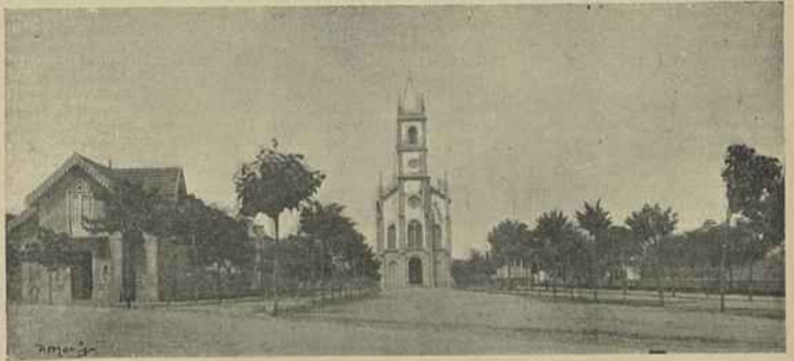
A AVENIDA E EGREJA NOVA