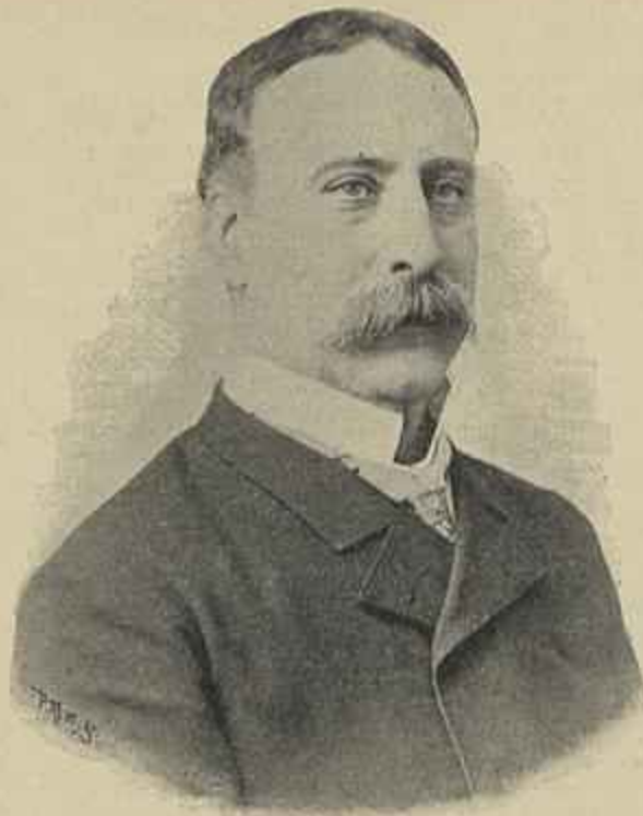
CONDE DE THOMAR

Em 25 de junho de 1870 foi promovido a primeiro secretario para a legação de Roma e ali serviu até fins de setembro do mesmo anno, em