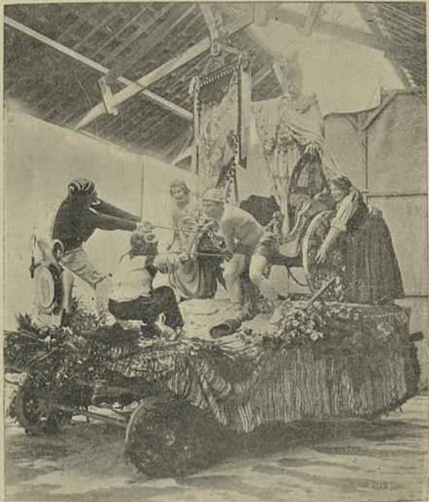
O CARRO DO PORTO, PELO ESCULTOR A. TEIXEIRA LOPES

O Carro dos Fenianos , todo decorado de uvas transparentes, verdes, azues, encarnadas, róxas, com as suas tolhas de parra verde—alface á mistura, tendo no alto, uma figura de mulher—apothese do Carnaval dos Fenianos—estrangeira vestida fim de seculo, na mão as insignias do Club de onde esvoaçavam fitas de seda de todas as côres. No logar da boleia um enorme coração de filigrana dourada. Este carro era puxado por tres juntas de bois. Do carro ás juntas iam