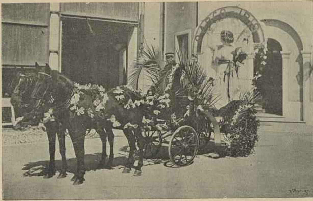
CARRO DO JORNAL «ARCO IRIS»