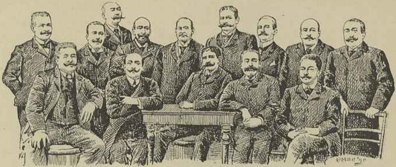
GRUPO DA DIRECÇÃO DO CLUB DOS FENIANOS DO PORTO