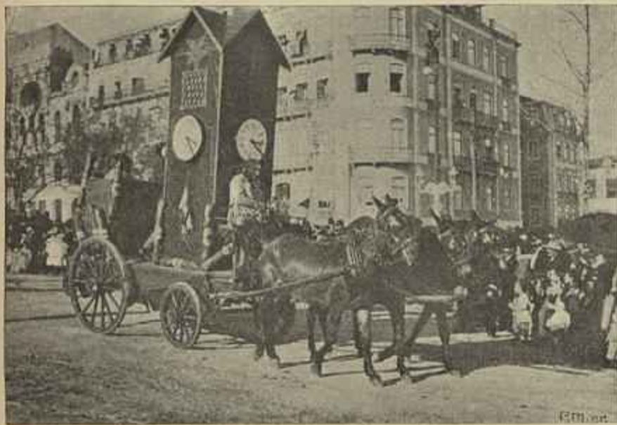
CARRO ALLUSIVO AOS TABACOS