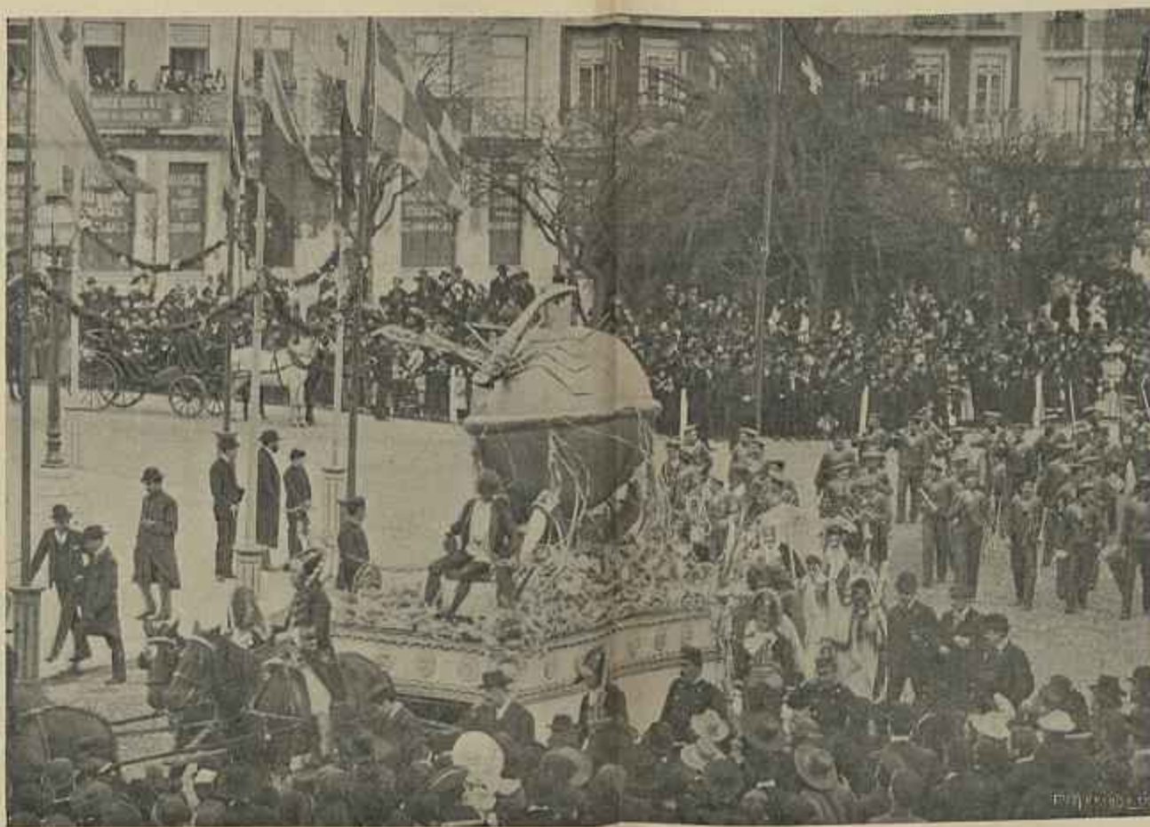
O CARRO DO REI CARNAVAL ENTRANDO NA PRAÇA DOS RESTAURADORES