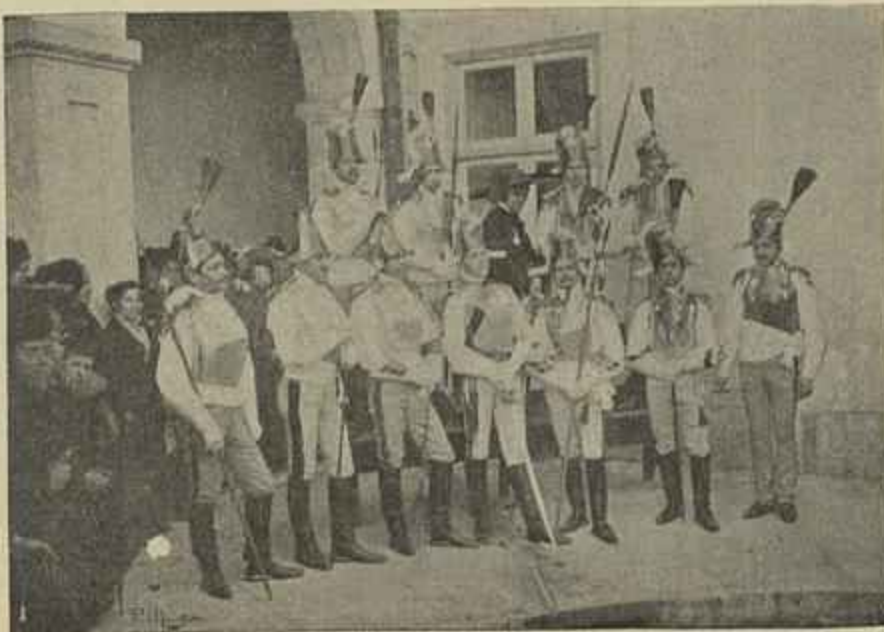
O CARNAVAL NA ESCOLA POLYTECHNICA — GUARDA DOS ARCHEIROS MORNOS

festões de flores, e, ladeando-o, formosas lavra- deiras do Minho.