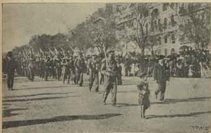
O BATALHÃO D'ALFAMA, PREMIADO