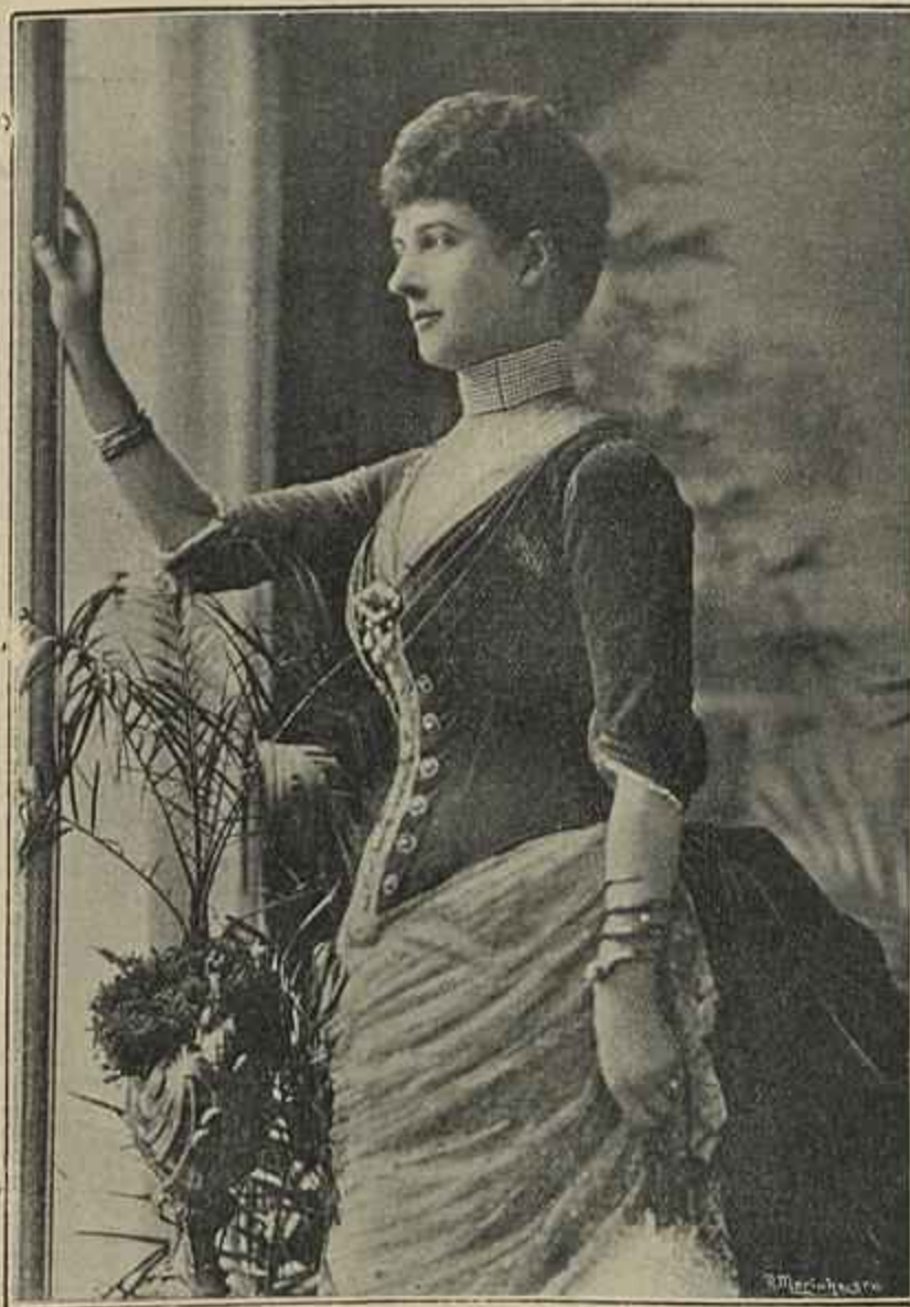
S. M. A RAINHA ALEXANDRA DE INGLATERRA

Q UAS uma demonstração de estreita amizade e alliança da Inglaterra, vae Portugal receber com a visita de Sua Magestade a Rainha Alexandra, que deve chegar ao Tejo no dia 17 do corrente. Ainda nos primeiros dias d'este anno os Duques de Connaught e suas gentis filhas, as princezas Victoria Patricia e Margarida Victoria, honraram Lisboa com a sua visita, e já hoje podemos registar mais uma gentileza dos reis de Inglaterra com a vinda á nossa capital, de Sua Graciosa Magestade a Rainha Alexandra.