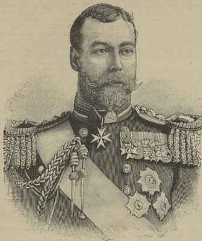
S. A. O PRINCEPE DE GALLES JORGE FREDERICO HERDEIRO DO THRONO DE INGLATERRA