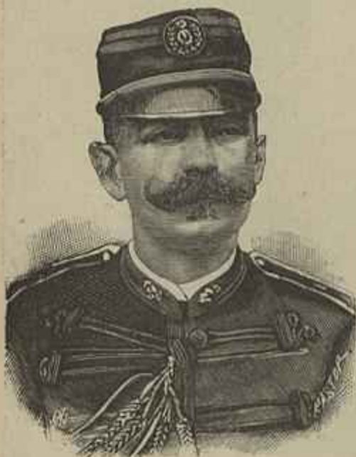
CONDE DE TAROUCA

Ultimamente n'uma tournée, em que se pode dizer visitou todo o paiz, obteve ovações ruidosas em muitas cidades em que se apresentou, especialmente na Figueira da Foz onde alcançou