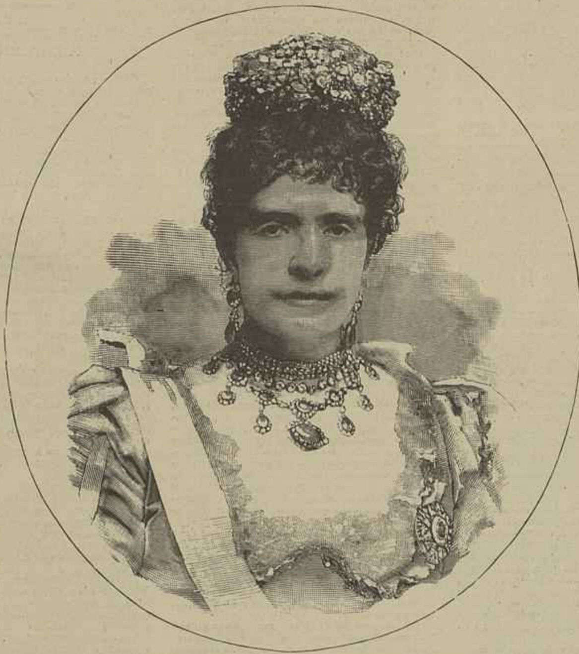
SUA Magestade a Rainha Regente D. Maria Pia