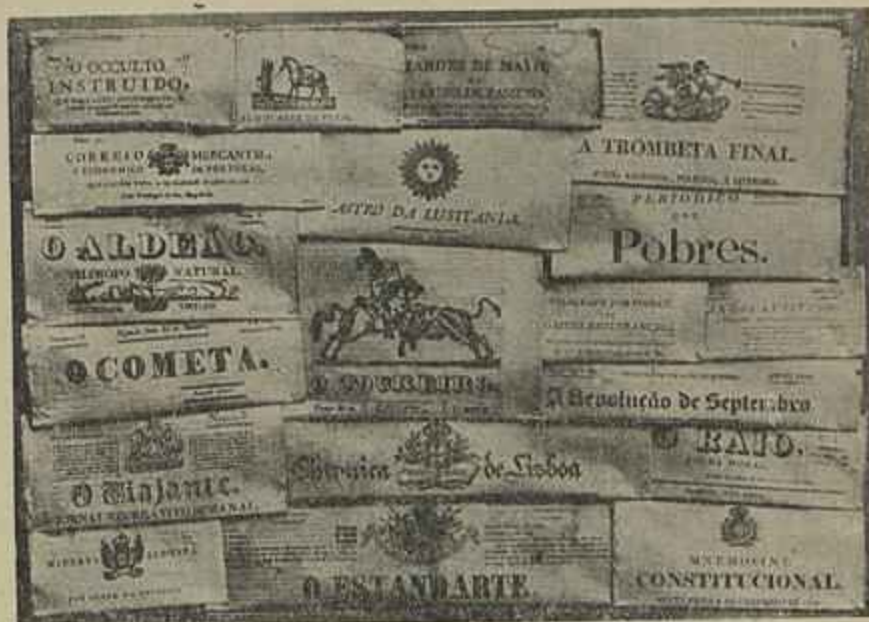
ALGUNS JORNAES PORTUGUEZES ANTIGOS