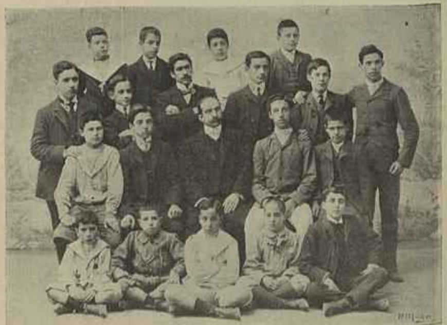
GRUPO DA INSTRUCÇÃO SECUNDARIA COM O DIRECTOR

Ao luar, linda banhista, passeias leve por sobre o fófo tapete da areia moveidica da praia, e