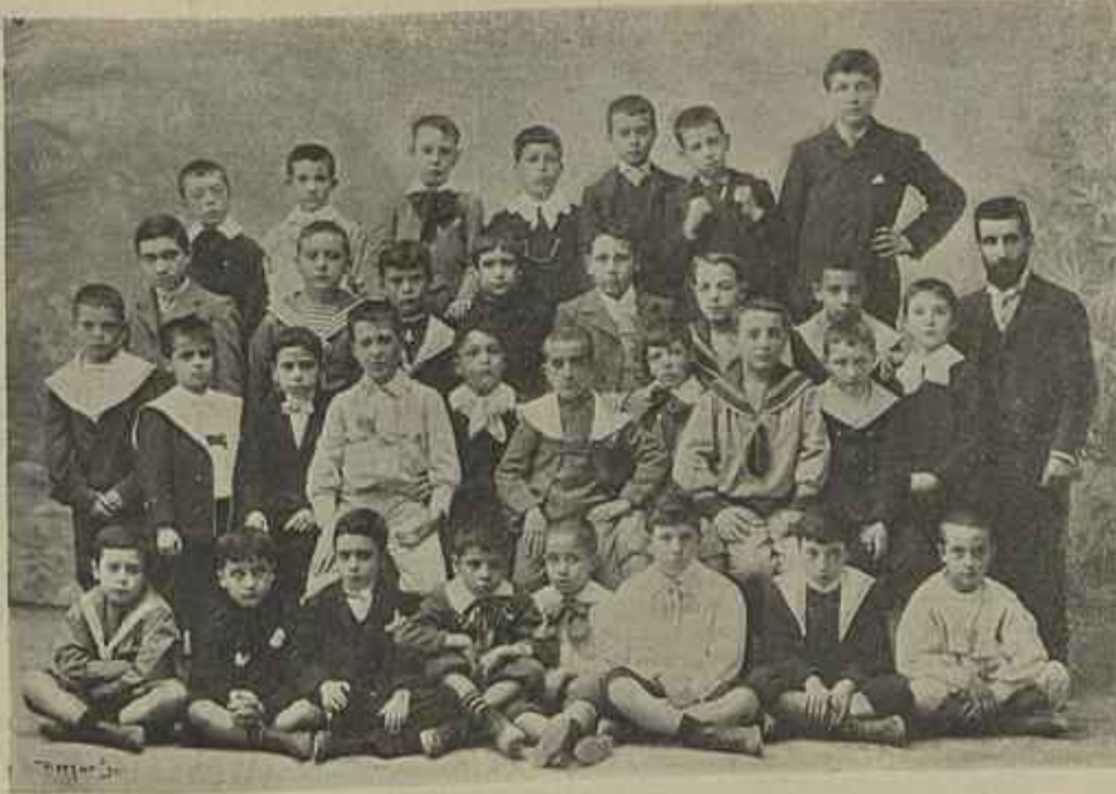
INSTITUTO POLYTECHNICO — GRUPO DA INSTRUÇÃO PRIMARIA COM O PROFESSOR

No delirio do seu intento chegaram a entrar muito pelo mar em doida perseguição das pobres nymphas, que cheias de susto soltavam altos gritos de desespero.