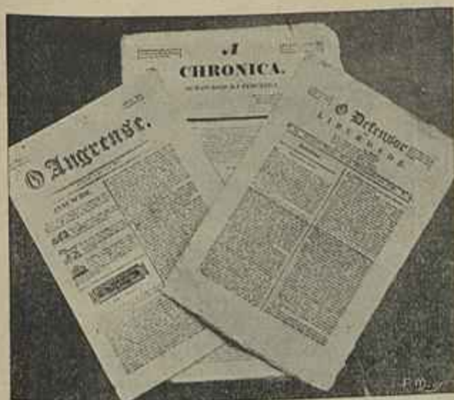
PRIMEIROS JORNAES LIBERAES PORTUGUEZES