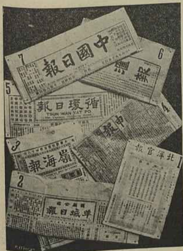
JORNAES DA CHINA

rou o bispo da diocese de Faro, ficando os seus restos depositados em jazigo de familia no cemiterio da Esperança.