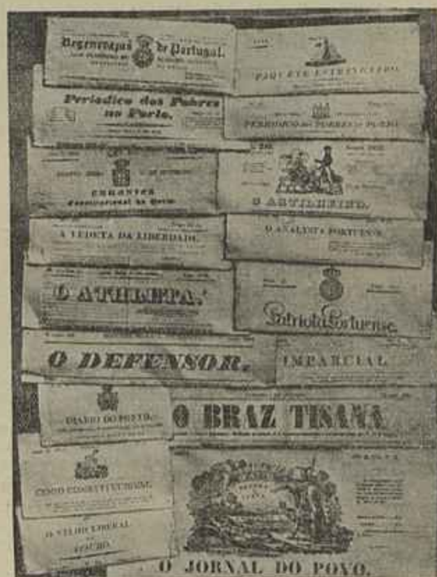
ALGUNS JORNAES ANTIGOS DO PORTO