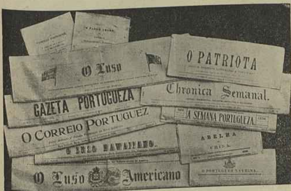
ALGUNS JORNAES PORTUGUEZES PUBLICADOS NO ESTRANGEIRO