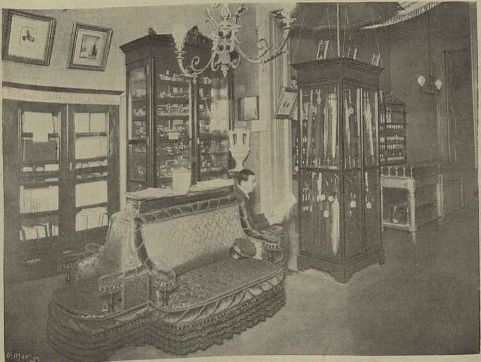
EXPOSIÇÃO DE PRODUCTOS PORTUGUEZES EM BUENOS-AYRES — ASPECTO DA PRIMEIRA E SEGUNDA SALAS

Hoje a villa de Cezimbra vae prosperando a olhos vistos e será bom que páre no seu desenvolvimento.