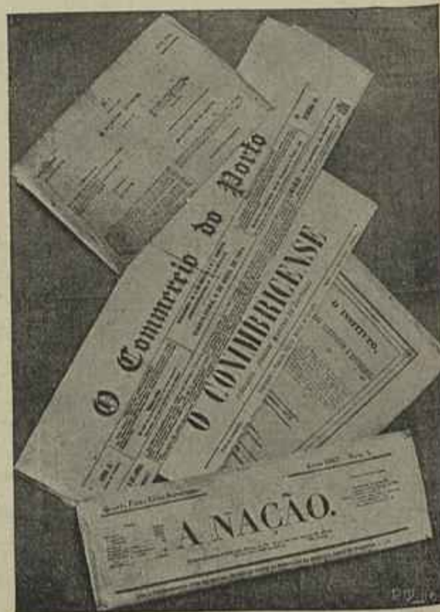
DECANOS DA IMPRENSA PORTUGUEZA

A assistencia aos funeraes do illustre extincto formou um immenso cortejo em que se incorpo-