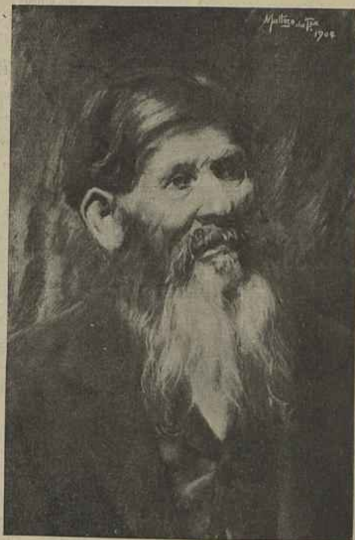
VELHO MODELO Desenho a pastel de Matoso da Fonseca