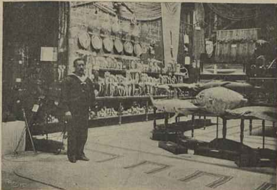
A EXPOSIÇÃO OCEANOGRAPHICA DE S. M. EL-REI D. CARLOS