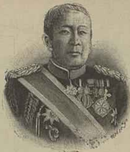
OYAMA, GENERAL EM CHEFE DO EXERCITO JAPONEZ

O Mikado que actualmente occupa o throno, é o 123.º Imperador que usa as tres insignias divinas; a dynastia do sol, tem por emblema a flôr do chrysanthemo de que a fôrma recorda a do globo luminoso coroado de raios, e vem reinando