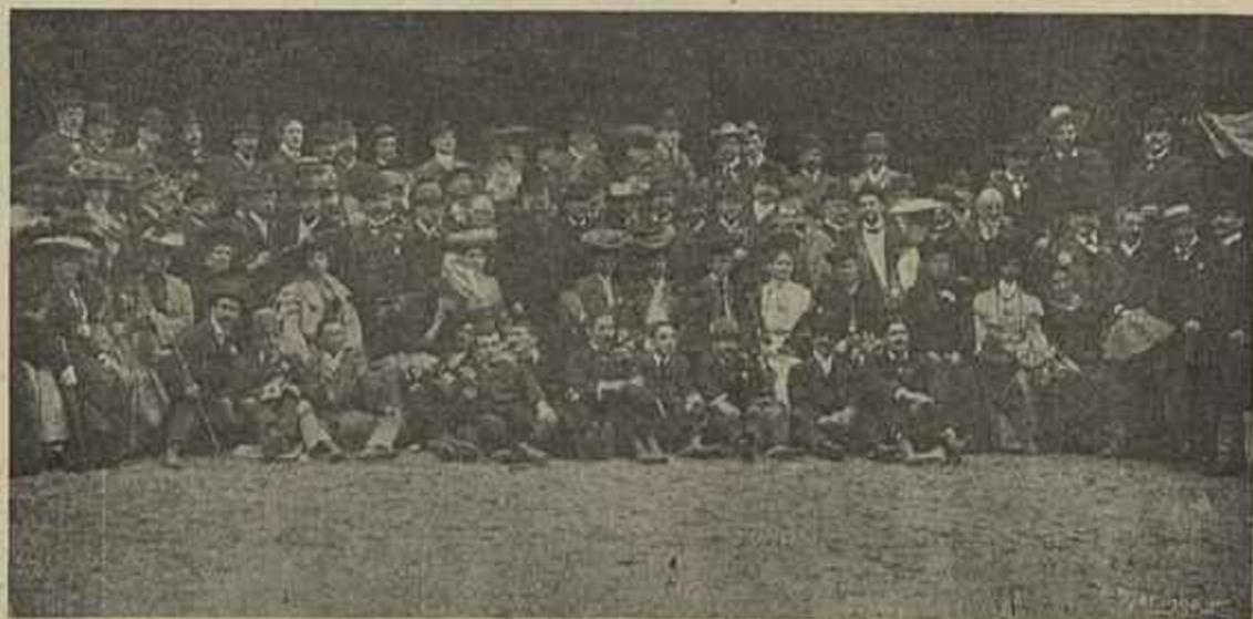
GRUPO DE CONGRESSISTAS