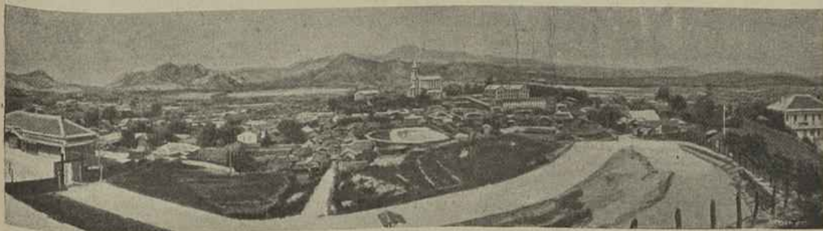
VISTA GERAL DE SEOUL, CAPITAL DA COREIA

Este facto foi tão grave e convulsionou de tal fôrma a opinião, que pela vez primeira, depois de seculos, os rumores de fôrma penetraram no recinto reservado. O Imperador, accommettido pelos nobres, teve que intervir, dando pela primeira vez ordem ao Siogoun.