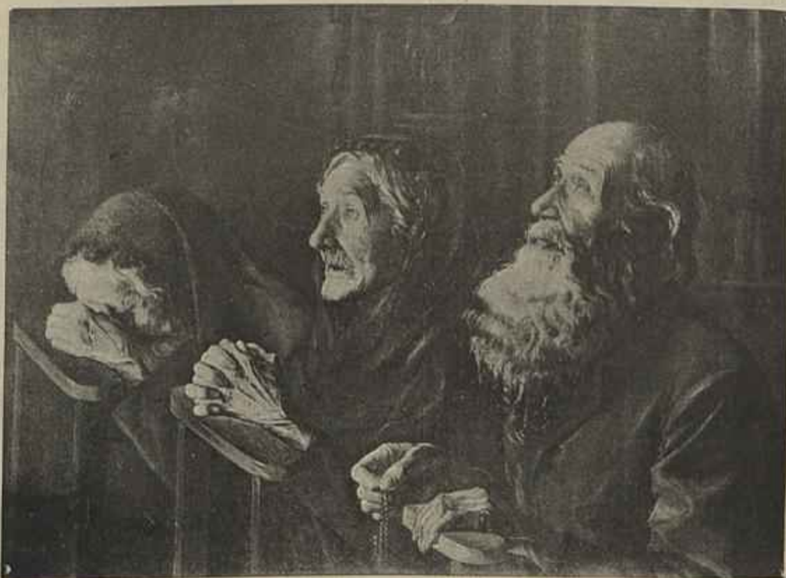
NA MISSA EM NOTRE DAME Quadro de David de Mello