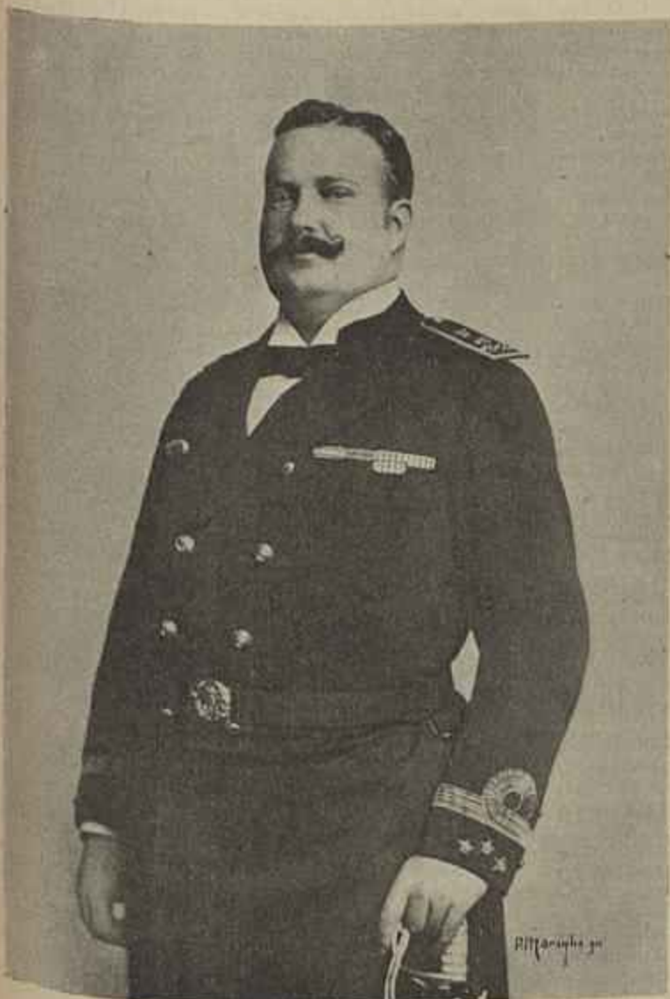
S. M. EL-REI D. CARLOS