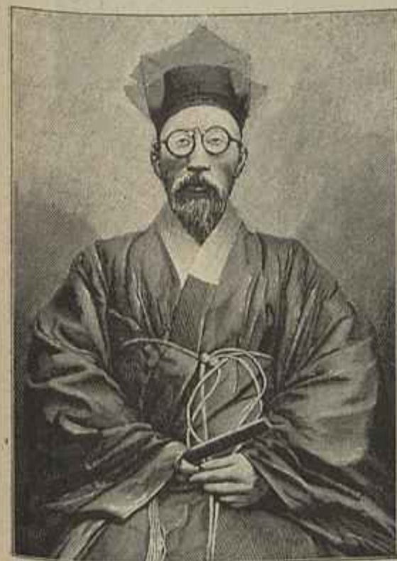
S. M. LI HSI, IMPERADOR DA COREIA

Entre muitos objectos dispostos de forma a produzir seguro e agradável effeito, veem-se alli