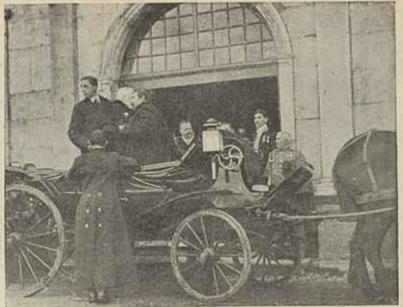
PARTIDA PARA ELVAS DE S. M. D. AFFONSO XIII

El-Rei D. Carlos, Sua Magestade a Rainha e o Principe Real acompanharam o monarcha hespanhol até á porta do paço, sendo as despedidas dos dois monarchas muito affectuosas.