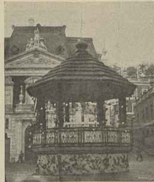
CORETO NA AVENIDA DA LIBERDADE

Nos coretos da Avenida em frente do theatro da rua dos Condes, lado oriental, tocava á banda de caçadores 6, e do lado occidental a banda de infantaria 5.