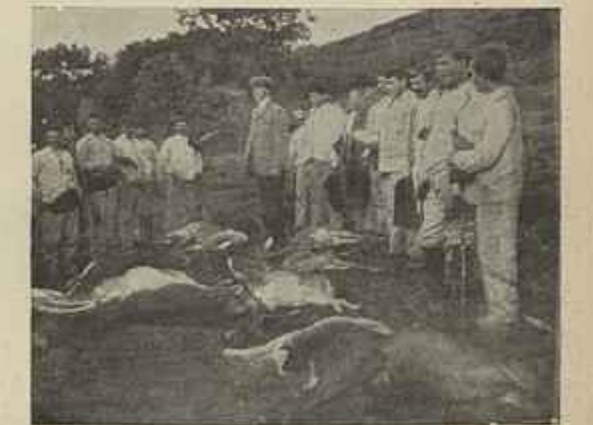
A CAÇADA EM VILLA VIÇOSA — S. M. D. AFFONSO XIII EXAMINANDO AS PEÇAS DE CAÇA