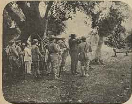
A CAÇADA EM VILLA VIÇOSA — S. M. EL-REI D. CARLOS I APONTANDO AOS GAMOS