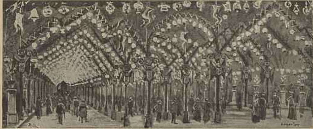
ILLUMINAÇÕES À MODA DO MINHO NA AVENIDA DA LIBERDADE (Desenho do sr. Christino da Silva)