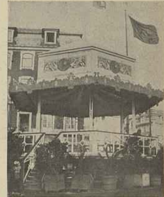
CORETO NA PRAÇA DO DUQUE DA TERCEIRA

O da Praça do Municipio d'um gosto delicado encimado pelo escudo do municipio.