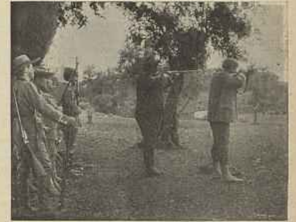
A CAÇADA EM VILLA VIÇOSA — SS. MM. D. AFFONSO XIII E D. CARLOS I APONTANDO AOS VEADOS