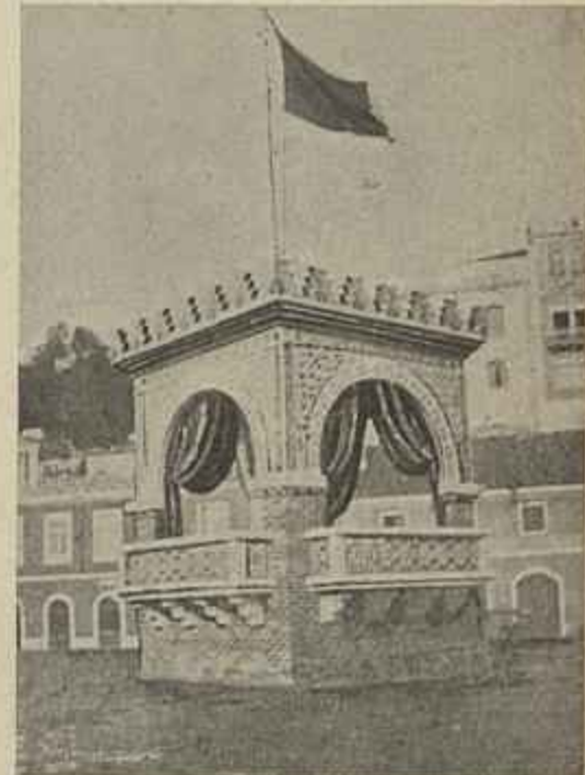
CORETO DE SANTOS

O da Praça do Duque da Terceira de columnas de madeira a apoiarem-se n'um estrado bordado por uma galeria ornada de estrellas azues e vermelhas.