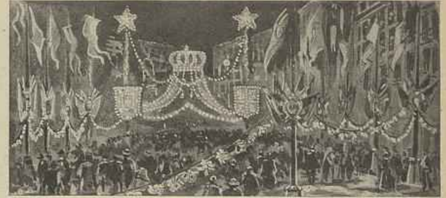
ILLUMINAÇÕES NA RUA GARRETT E PRAÇA LUIZ DE CAMÕES (Desenho do sr. Christino da Silva)