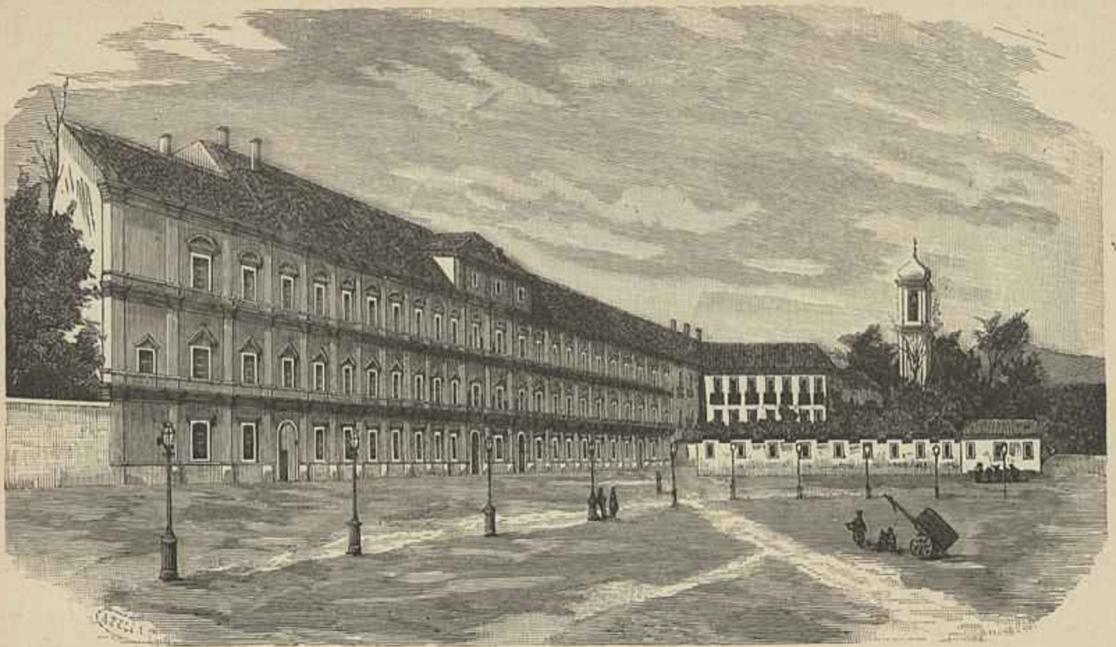
PALACIO REAL DE VILLA VIÇOSA

Henrique Bastos — Cirurgião dos hospitaes