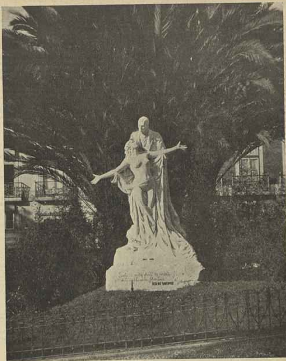
O MONUMENTO A EÇA DE QUEIROZ INAUGURADO NO LARGO DO QUINTELLA EM 9 DO CORRENTE