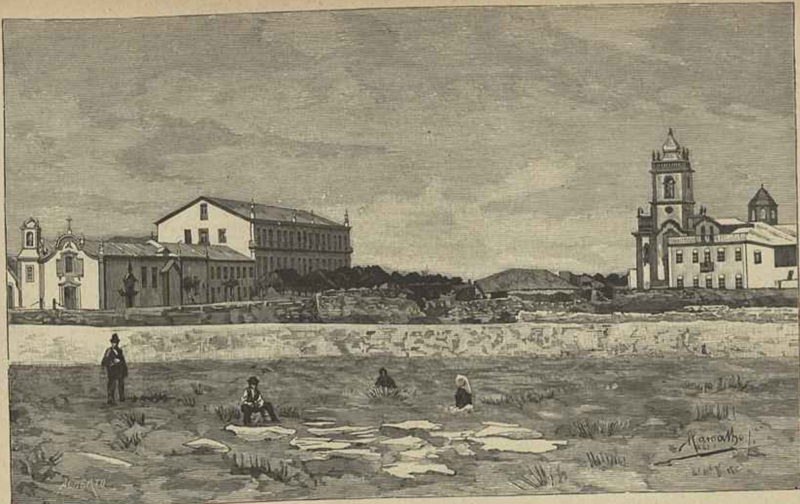
O LARGO DAS DORES, NA POVOA DE VARZIM