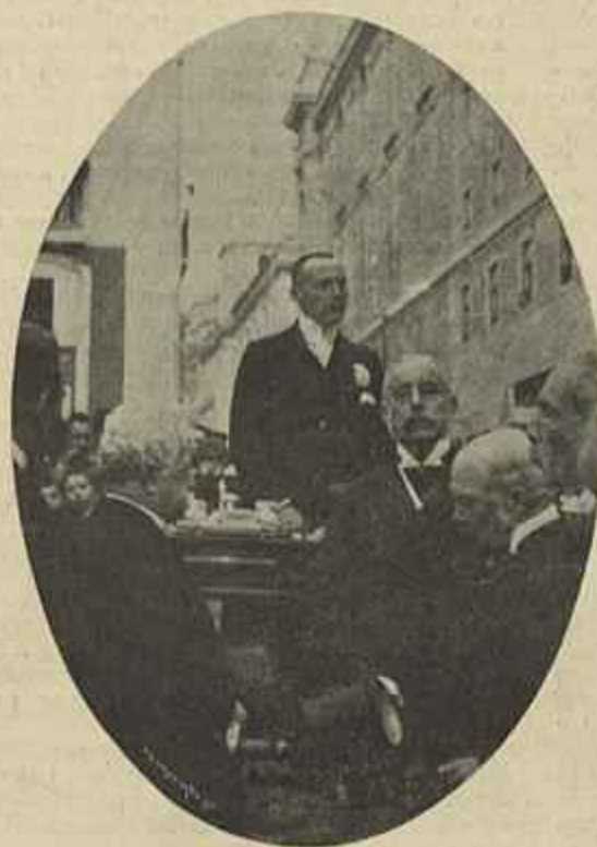
CONDE DE ARNOSO