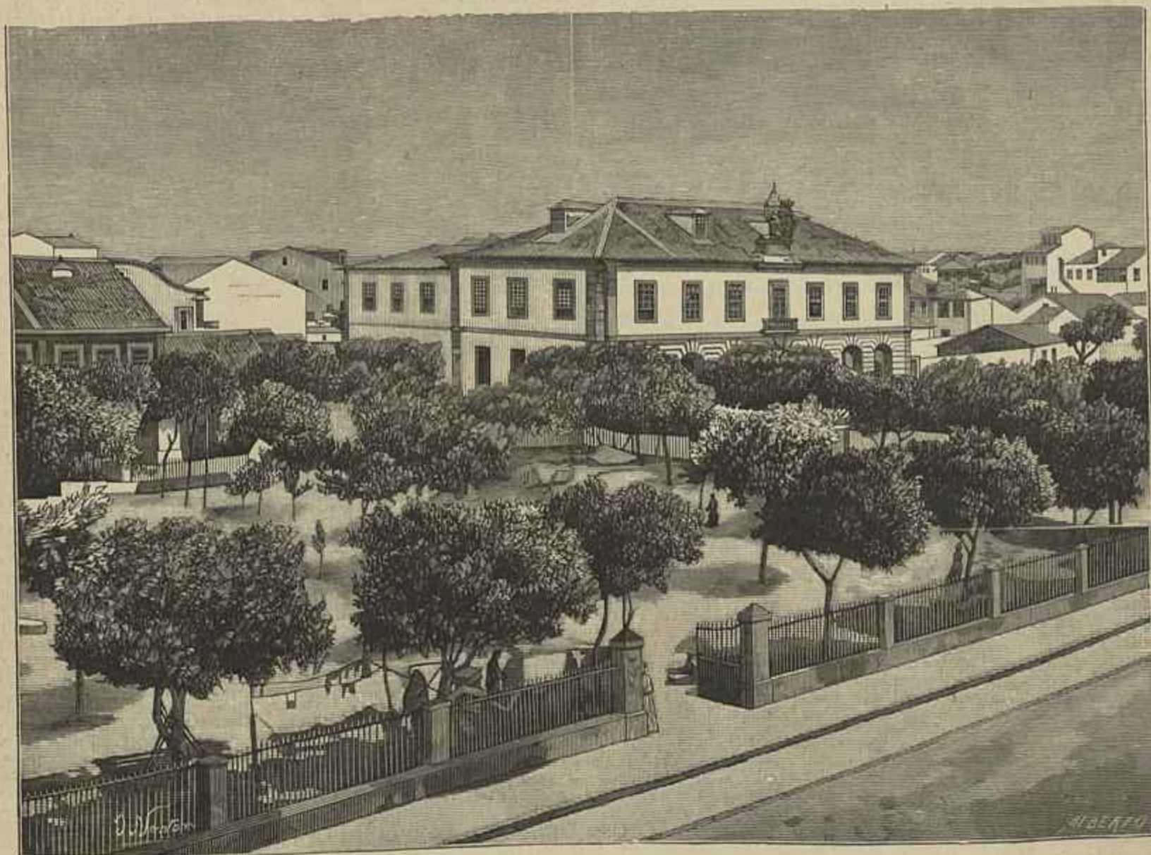
PAÇOS DO CONCELHO DA POVOA DE VARZIM E PRAÇA DO ALMADA A PATRIA DE EÇA DE QUEIROZ