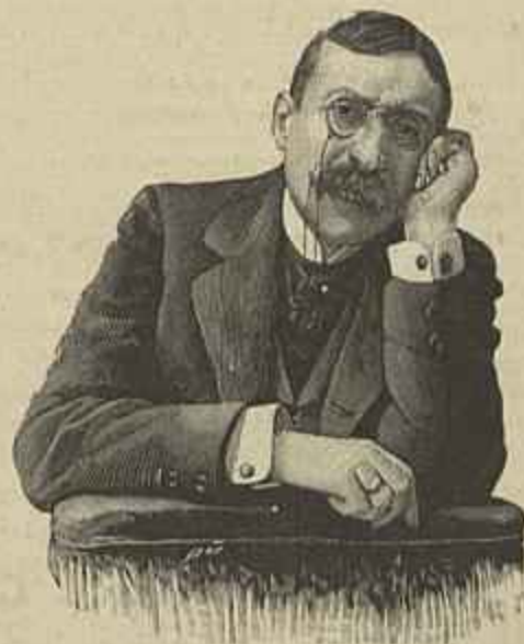
EÇA DE QUEIROZ NOS ULTIMOS ANNOS DE SUA VIDA

Fala-se finalmente em artistas portuguezes. E' que elles trabalham para isso; trabalham n'um meio que, se nem sempre lhes é hostile raras vezes lhes offerece o incentivo que, com muito menor dispendio de forças, os artistas encontram no estrangeiro. Por isso mais deviam ainda merecer d'aquelles que, por melhor cultura da intelligencia ou por maior bondade do coração, sabem avaliar o que lhes devemos.