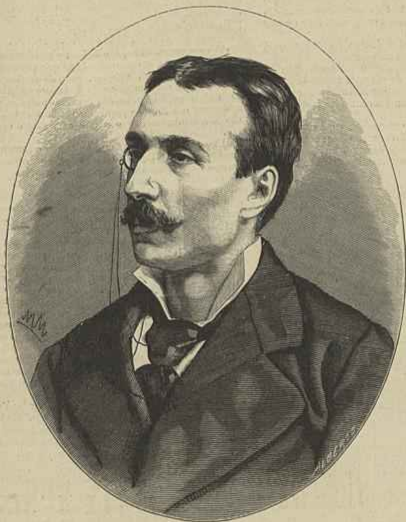
EÇA DE QUEIROZ EM 1876