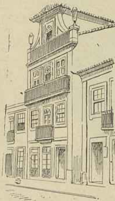
CASA ONDE NASCEU EÇA DE QUEIROZ NA POVOA DE VARZIM

E' uma verdadeira obra prima o novo trabalho de Teixeira Lopes, por um alto espirito concebido, por um grande artista executado, inspirado por que foi gloria indiscutivel das letras portuguezas.