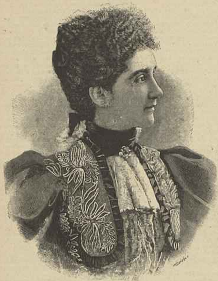
S. M. A RAINHA HELENA