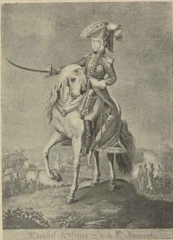
Gravura extrahido do opusculo Episodios da guerra Peninsular do sr. Ribeiro Arthur

la Escola typographica salesiana de Nictheroy, Brazil. O novo almanach que vem substituir o Almanach brasileiro da familia Christã é destinado, como o seu predecessor, a instruir, edificar e deleitar as familias brasileiras por meio de boas e escolhidas leituras e graciosas gravuras.