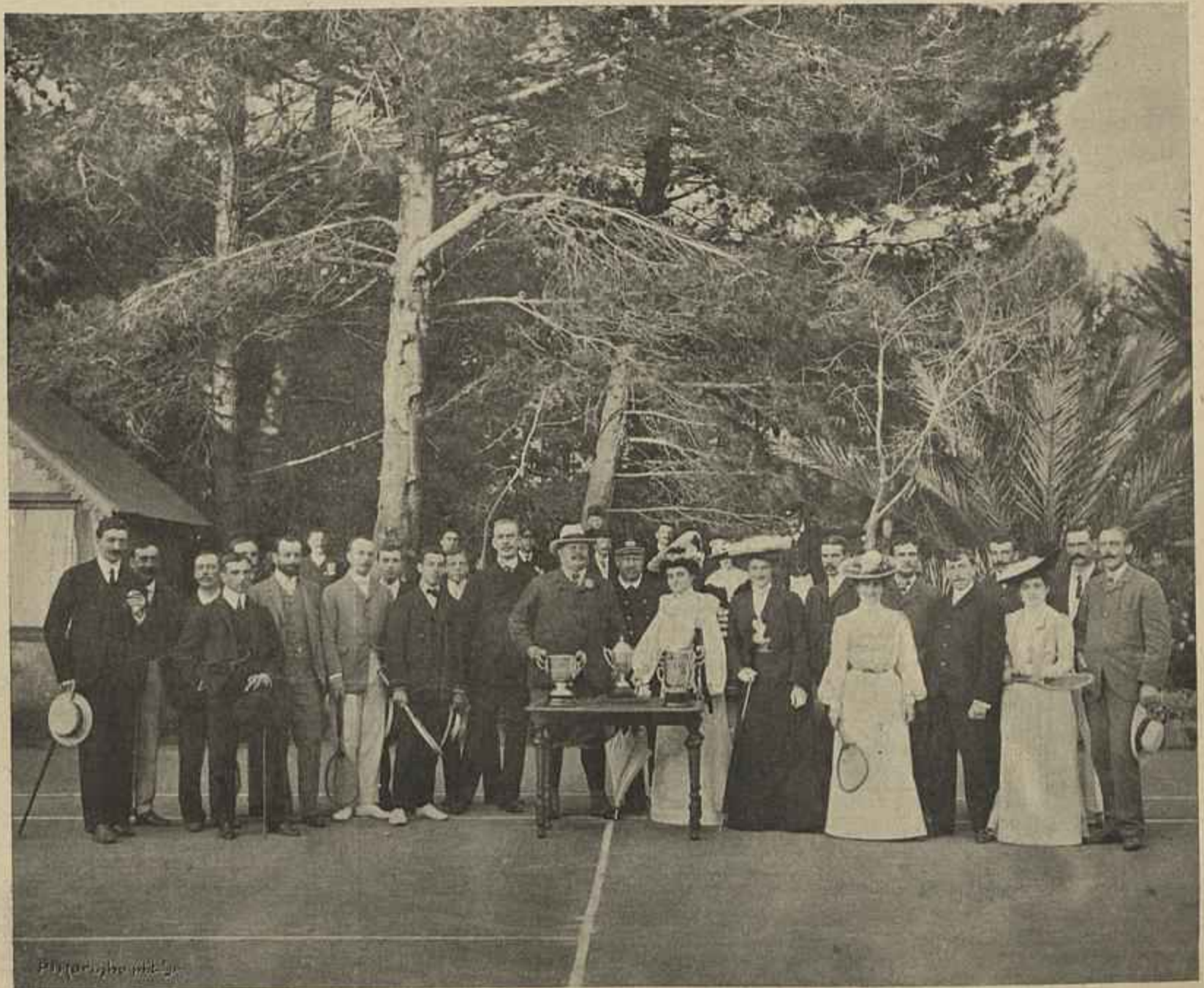
SPORTING-CLUB DE CASCAES — DISTRIBUIÇÃO DE PREMIOS POR S. M. EL-REI D. CARLOS AOS VENCEDORES NO LAW-TENNIS

No continente estes principios de inverno não se mostraram tão rigorosos, entretanto em Aveiro correram perigo dois barcos de pesca, que foram salvos pelo rebocador Lusitano da praça do Porto.