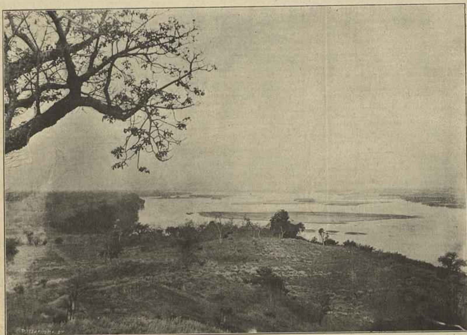
ZAMBEZIA — O RIO ZAMBEZE VISTO DO FORTE DE TAMBARA