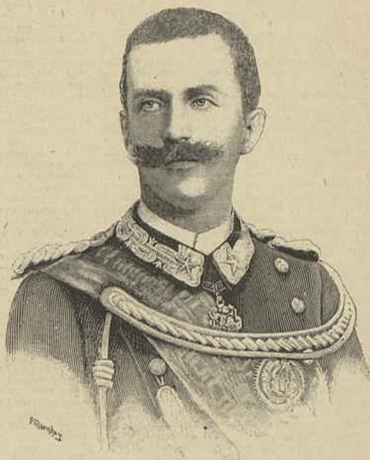
S. M. O REI VICTOR MANOEL