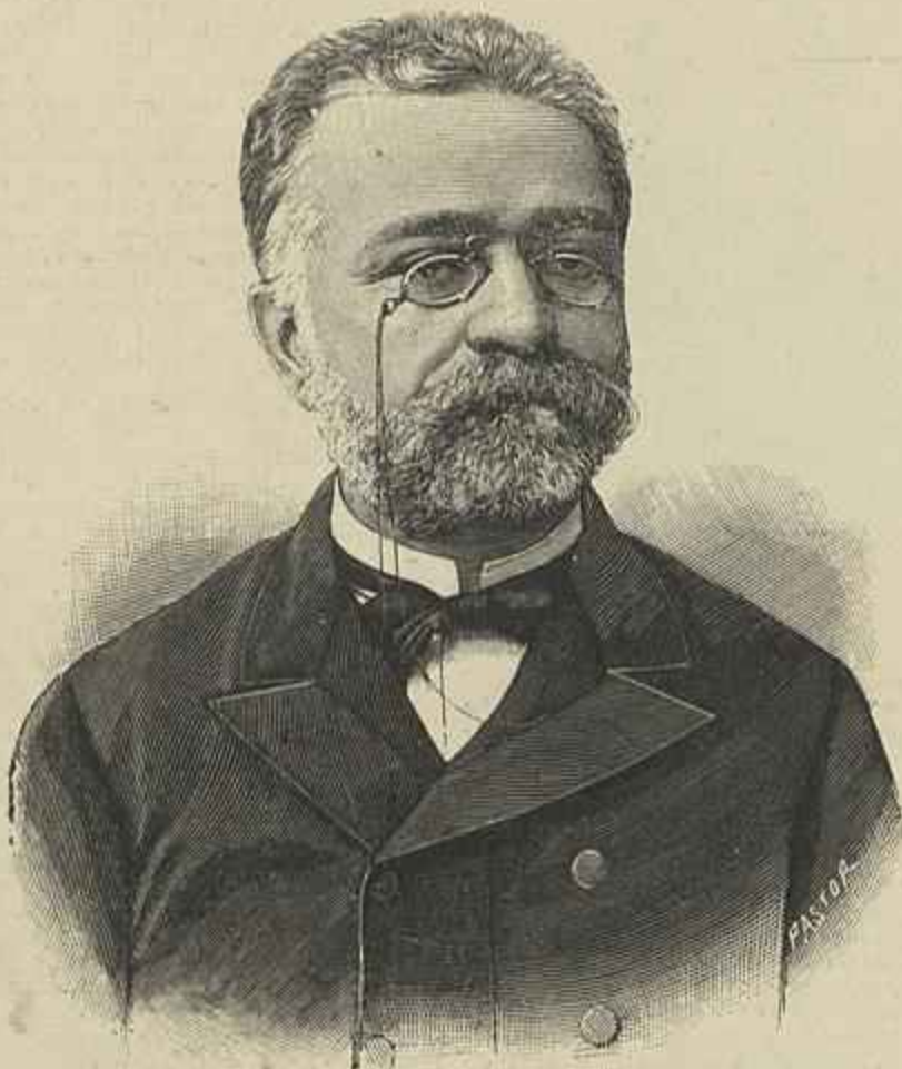
DR. AFFONSO AUGUSTO MOREIRA PENA VICE-PRESIDENTE ELEITO DA REPUBLICA DOS ESTADOS UNIDOS DO BRAZIL