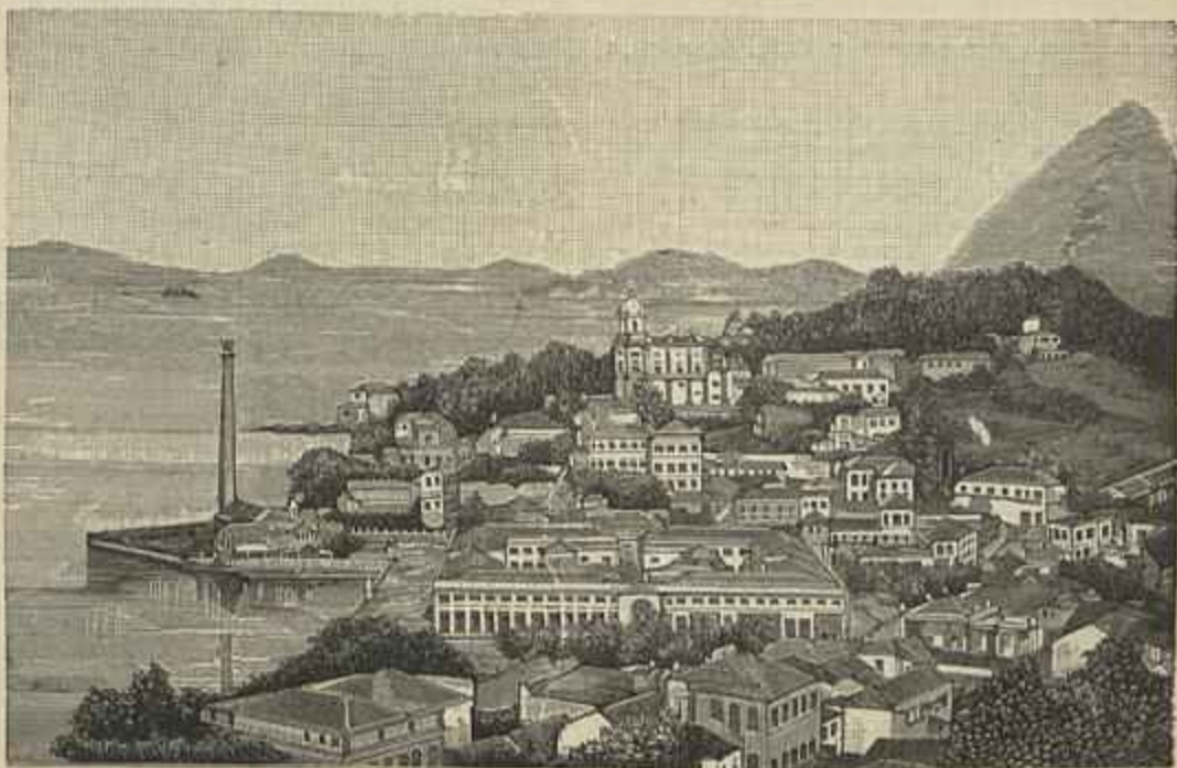
UMA VISTA DA CAPITAL FEDERAL

Imagine-se uma carga d'agua na Praça da Figueira n'uma d'essas noites de folia, de cravos com versos, de mangericões, de cornetas de barro. Seria tanto de maravilhar como uma