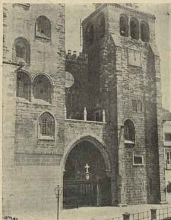
SÉ D'EVORA, VISITADA POR S. M. EL-REI D. CARLOS