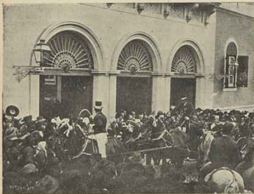
CHEGADA DE S. M. EL-REI D. CARLOS A EVORA