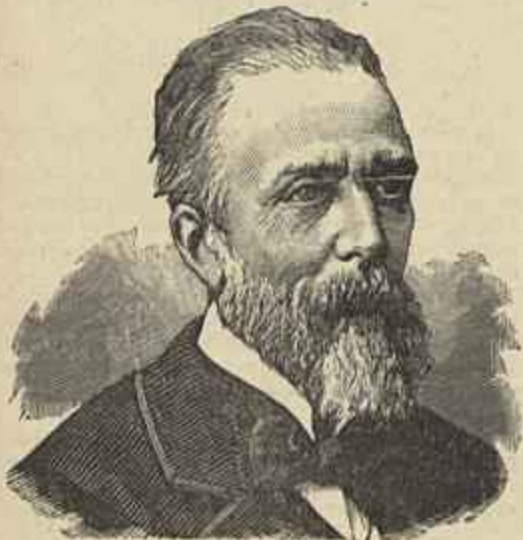
CONSELHEIRO JOSÉ VICENTE BARBOSA DU BOCAGE

Differentes foram as festas, mas pontos de contacto não podiam deixar de ter: o enthusiasmo e a commoção.