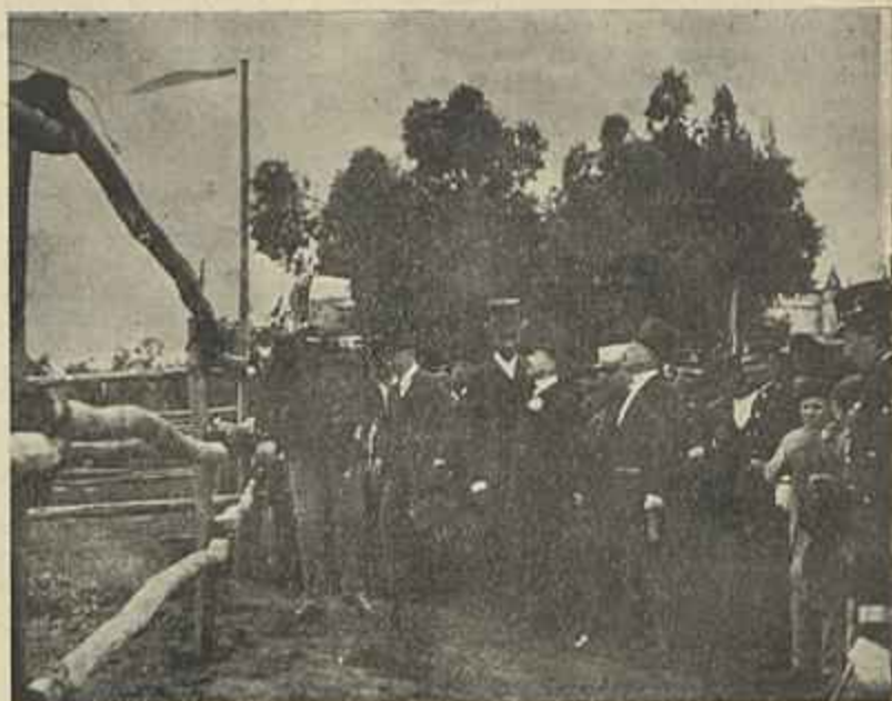
S. M. EL-REI D. CARLOS VISITANDO A EXPOSIÇÃO