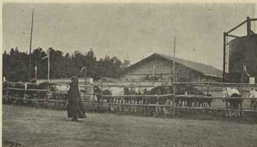
UM TRECHO DA EXPOSIÇÃO

ardia o tabaco por falta de ar. Atribuía o defeito ao tubo, pegava em uma palhinha, introduzia-lha, zangava-se, e tornava a zangar-se, vezes sem conto, e assim se ia distraindo.