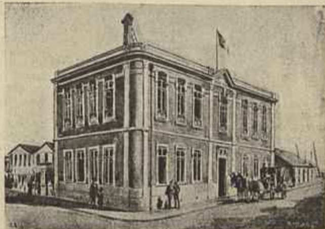
INSTITUTO MEDICO VIRGILIO MACHADO

O sr. ministro da fazenda declarou, sendo sobre o assumpto interpellado na camara dos deputados, que o alcool estrangeiro não será importado com abaxamento de direitos senão quando o ministerio das obras publicas reconhecer que não