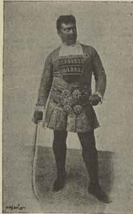
CARDINALI, NO «OTHELLO»