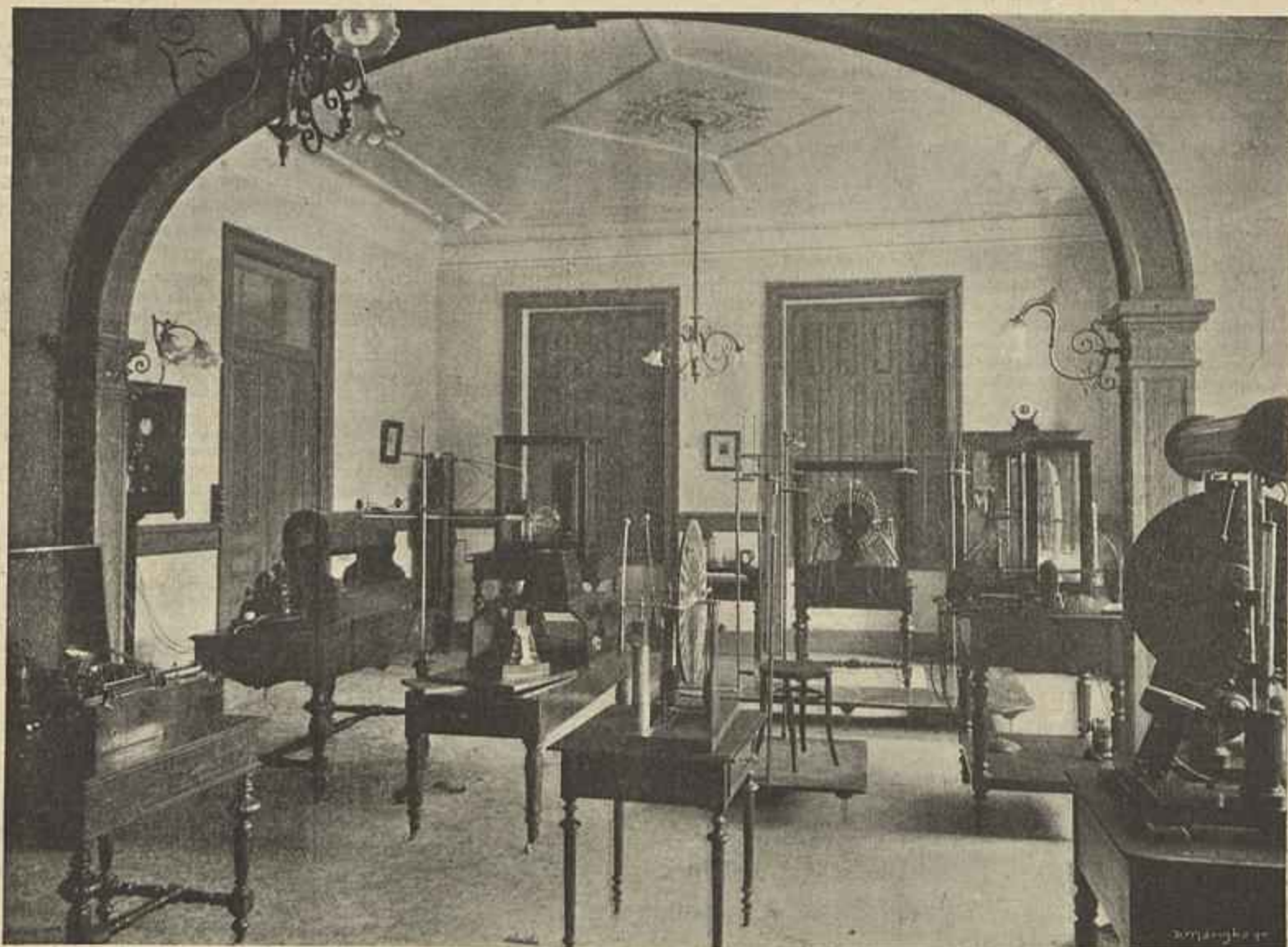
INSTITUTO MEDICO VIRGILIO MACHADO—SALA DE OPERAÇÕES PELA GALVANOLYSE E GALVANOCAUSTICA, EM CIRURGIA GERAL E NA GYNECOLOGIA