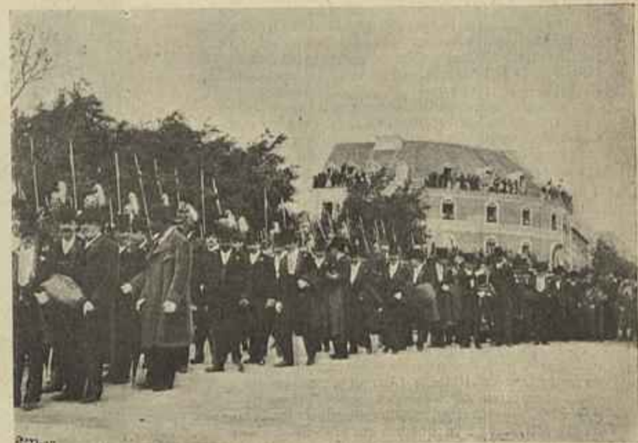
O CORTEJO DESFILANDO NA SAHIDA DO CEMITERIO OCCIDENTAL.