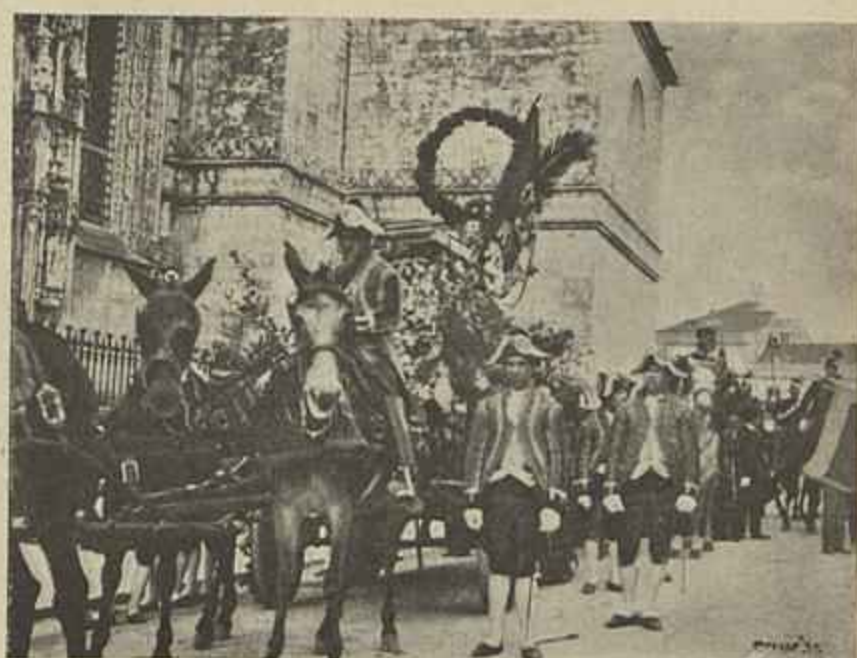
CHEGADA DO FERETRO AO PANTHEON DOS JERONYMOS

Belem, d'esta cidade de Lisboa, os representantes de El-Rei, do governo e das camaras legislativas; delegações e representantes de quasi todas as camaras municipaes do continente, ilhas e ultramar; delegações e representantes de quasi todas as escolas e estabelecimentos de instrução primaria, secundaria e superior, bem como diver-