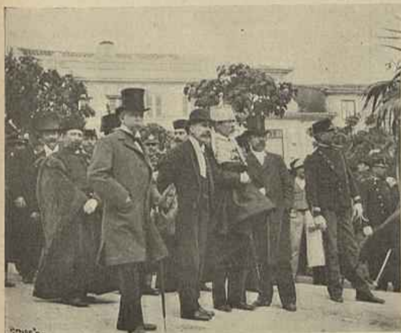
OS PARENTES DE ALMEIDA GARRETT NO CORTEJO