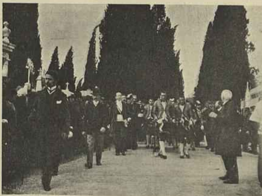
SAHIDA DO FERETRO DO CEMITERIO OCCIDENTAL