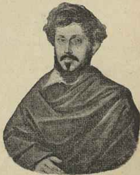
ALMEIDA GARRETT QUANDO ESTUDANTE DA UNIVERSIDADE