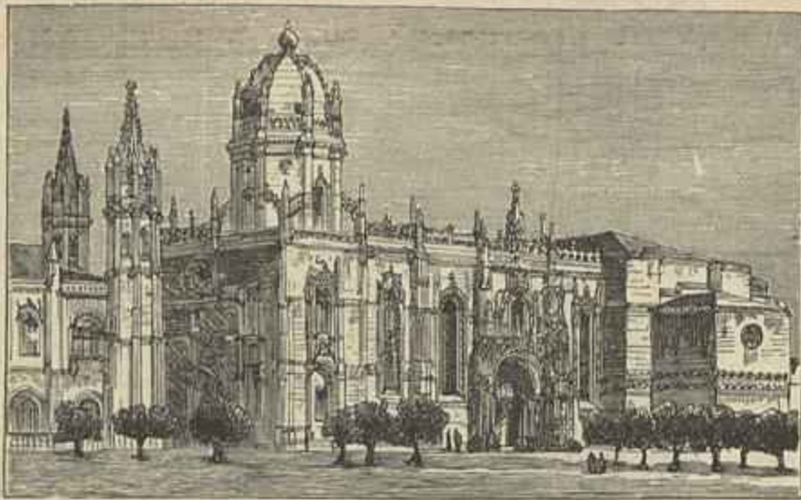
O MOSTEIRO DOS JERONYMOS