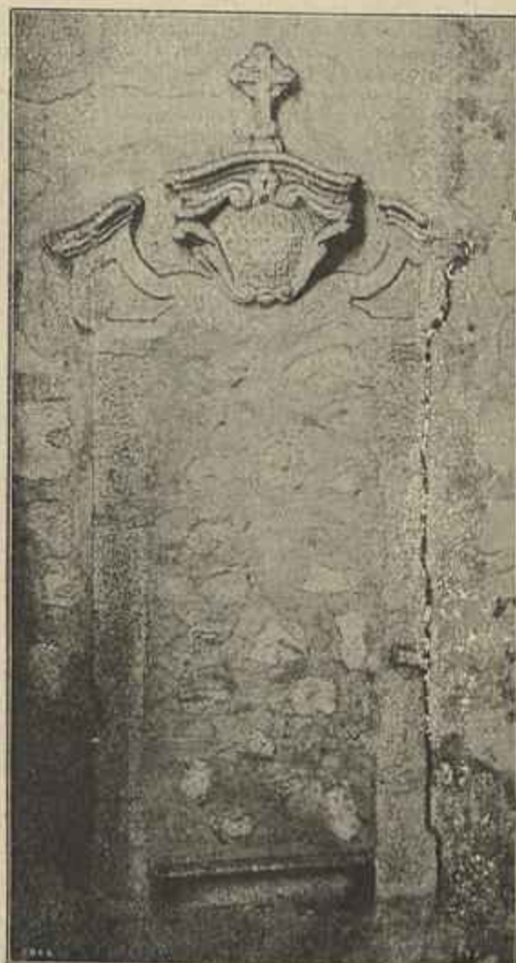
O NICHU DE SANT'ANNA, ESTADO ACTUAL (Cópia de uma photographia)