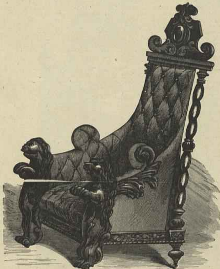
A CADEIRA DE GARRETT

Garrett, que tinha o verdadeiro culto da arte, foi dos primeiros que em nosso paiz principiou a