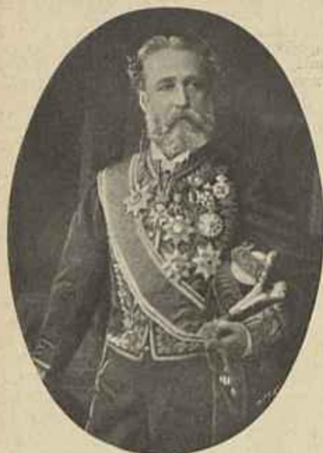
BARÃO DE SANTOS

FALLECIDO EM FONTENAY-AUX-ROSEZ EM 8 DO CORRENTE