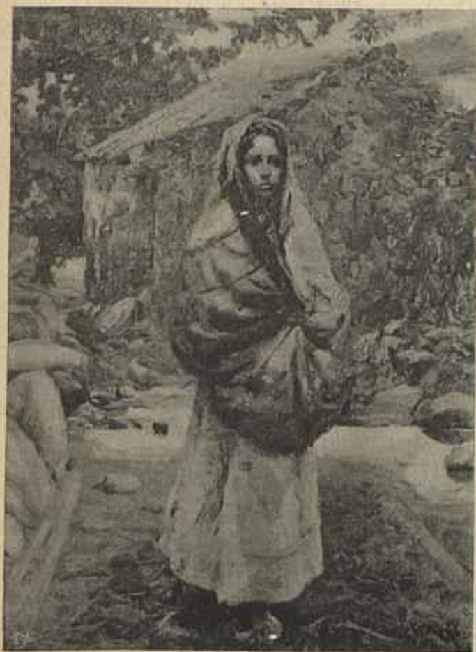
MENDIGA — ( Carlos Reis )