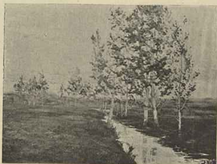
POENTE DE ABRIL — ( Carlos Reis )