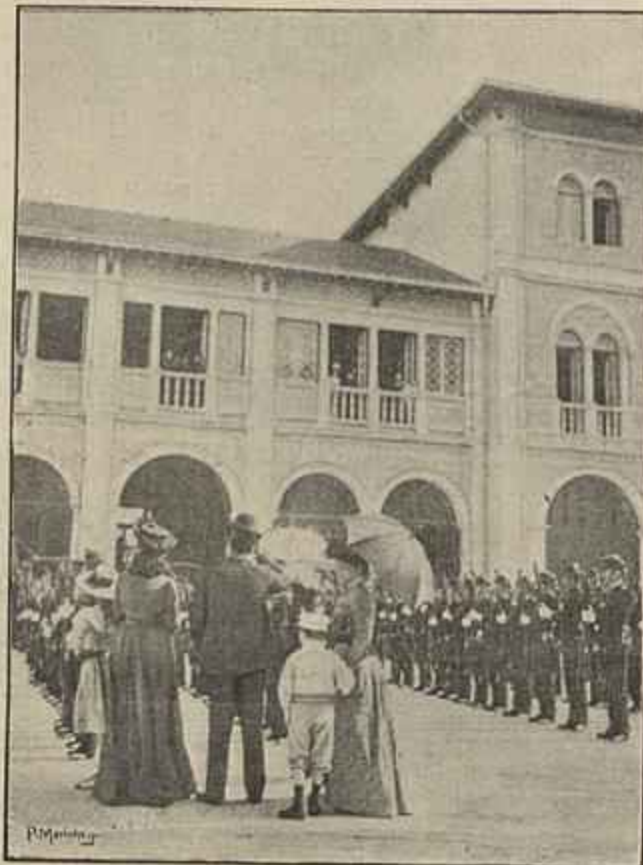
PARADA DO COLLEGIO MILITAR