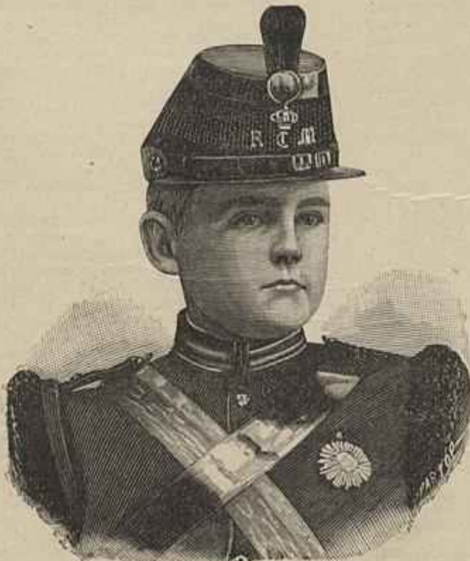
S. A. O PRINCIPE LUIZ FILIPPE