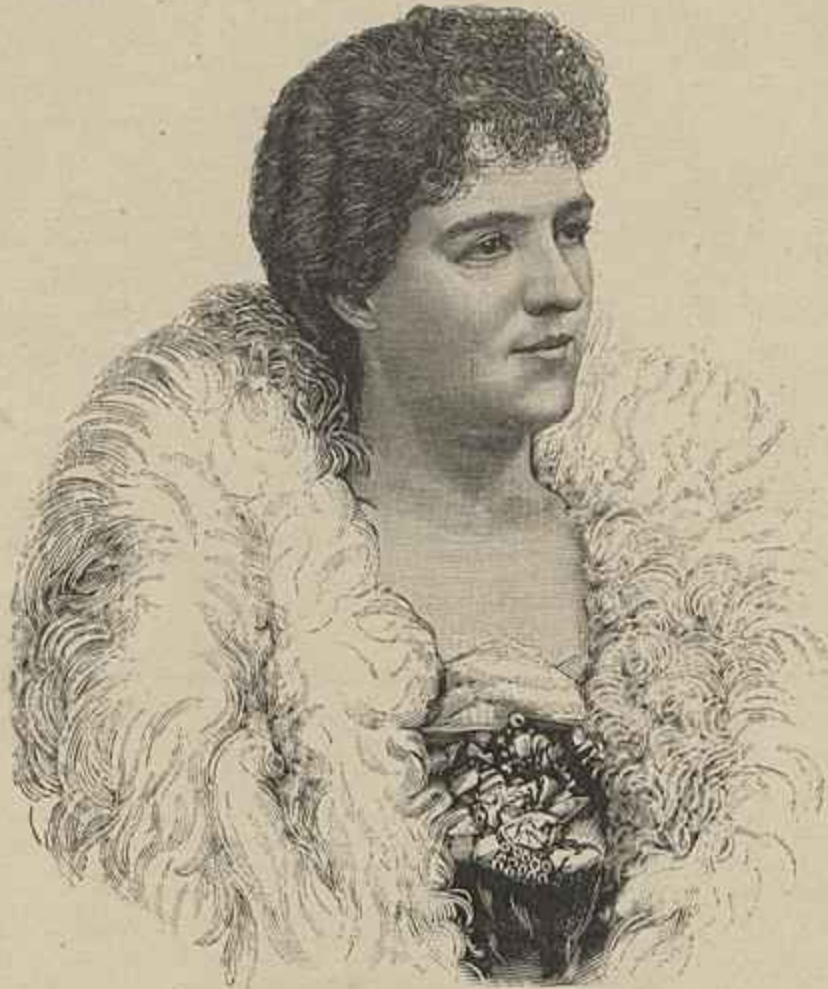
S. M. A RAINHA D. AMELIA