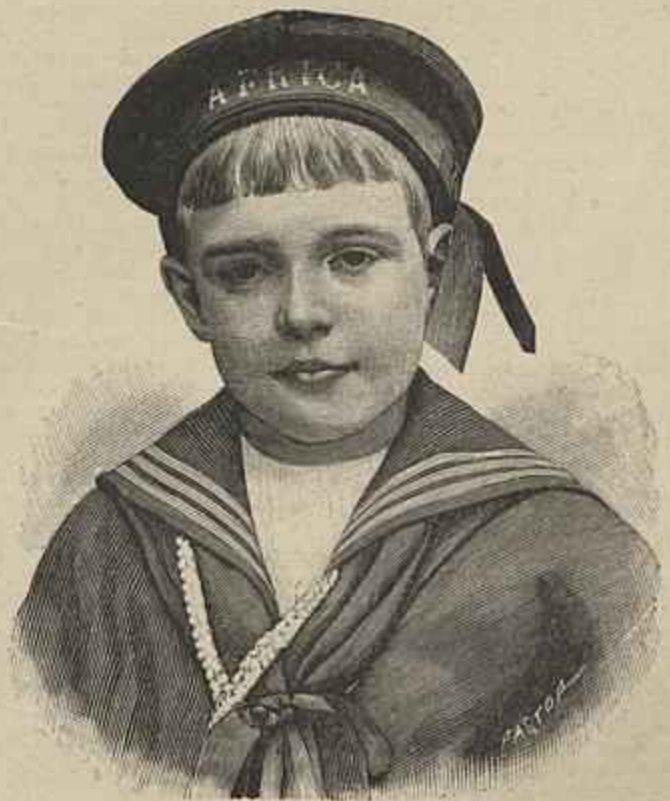
S. A. O INFANTE D. MANOEL