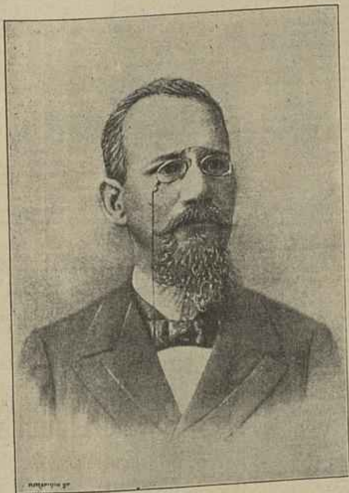
DR. FRANCISCO DE PAULA RODRIGUES ALVES PRÉSIDENTE ELEITO DA REPUBLICA DOS ESTADOS UNIDOS DO BRAZIL.