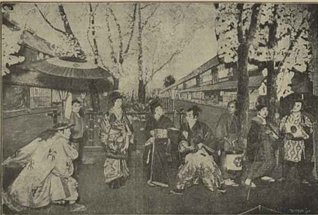
THEATRO JAPONEZ—SCENA DA «GHËSHA E O CAVALLEIRO»

E' necessario que haja complacencia por parte de depositarios do poder no tocante a exposiçào individual de opiniões politicas e a apreciações de actos officiaes — pôde traduzir-se em beneficio dos povos — impõe-se o emprego de rigor inflexivel para impedir a circulaçào de publicações ostentosas de figuras obscenas, de onde promana