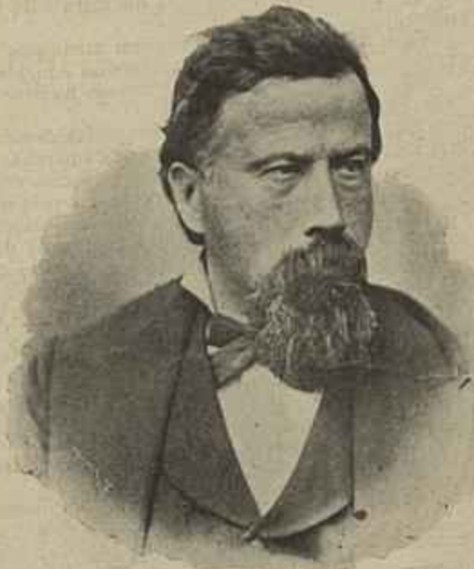
MAESTRO AMILCARE PONCHIELLI

Ao contrario, se o famoso titulo de Guttemberg existe posto ao serviço d'especulação desen-