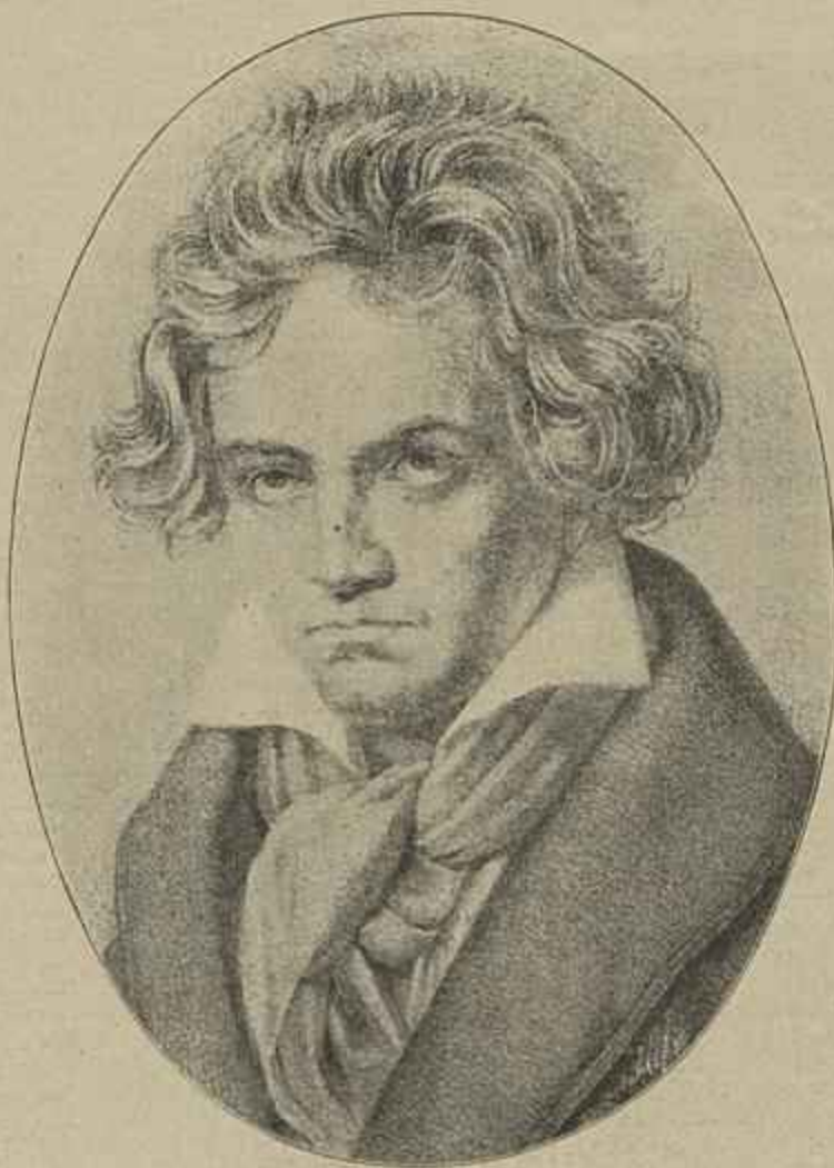
MAESTRO LUDOVIG VON BEETHOVEN

Comprehendo, e toda a gente sensata comprehende certamente, que se estigmatiza o vicio, que se procure afastar da senda do crime todo o ente