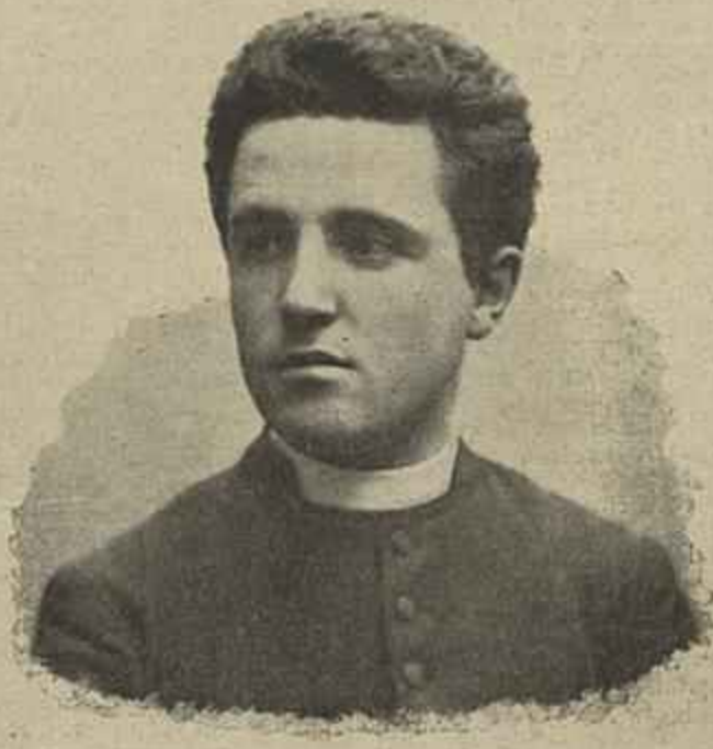
MAESTRO LORENZO PEROZI