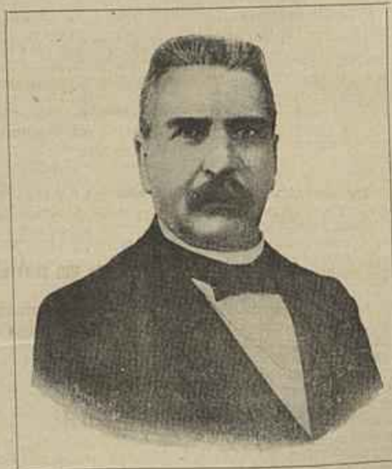
DR. FRANCISCO SILVANO DE ALMEIDA BRANDÃO VICE-PRÉSIDENTE ELEITO DA REPUBLICA DOS ESTADOS UNIDOS DO BRAZIL.

Causou o mais profundo horror a primeira noticia que chegou, embora succinta, sem aquelles pormenores, que depois ainda mais tragico revelaram o acontecimento. Os mesmos navios que estavam no porto quasi todos ficaram destruidos pela cinza e pelas lavas. Era medonha a escuridão. Lembra o caso de