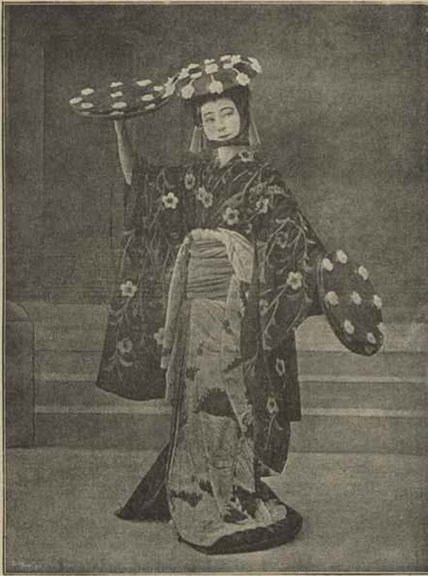
A ACTRIZ JAPONESA SADA YACCO