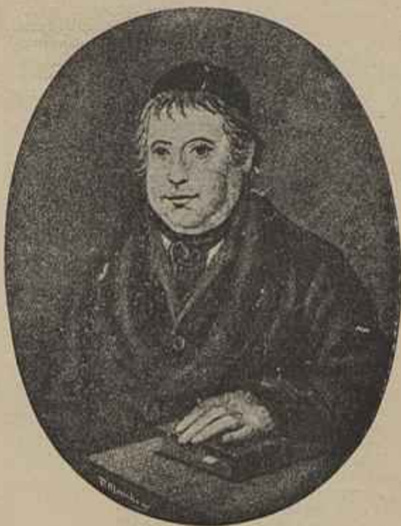
JOSÉ AGOSTINHO DE MACEDO