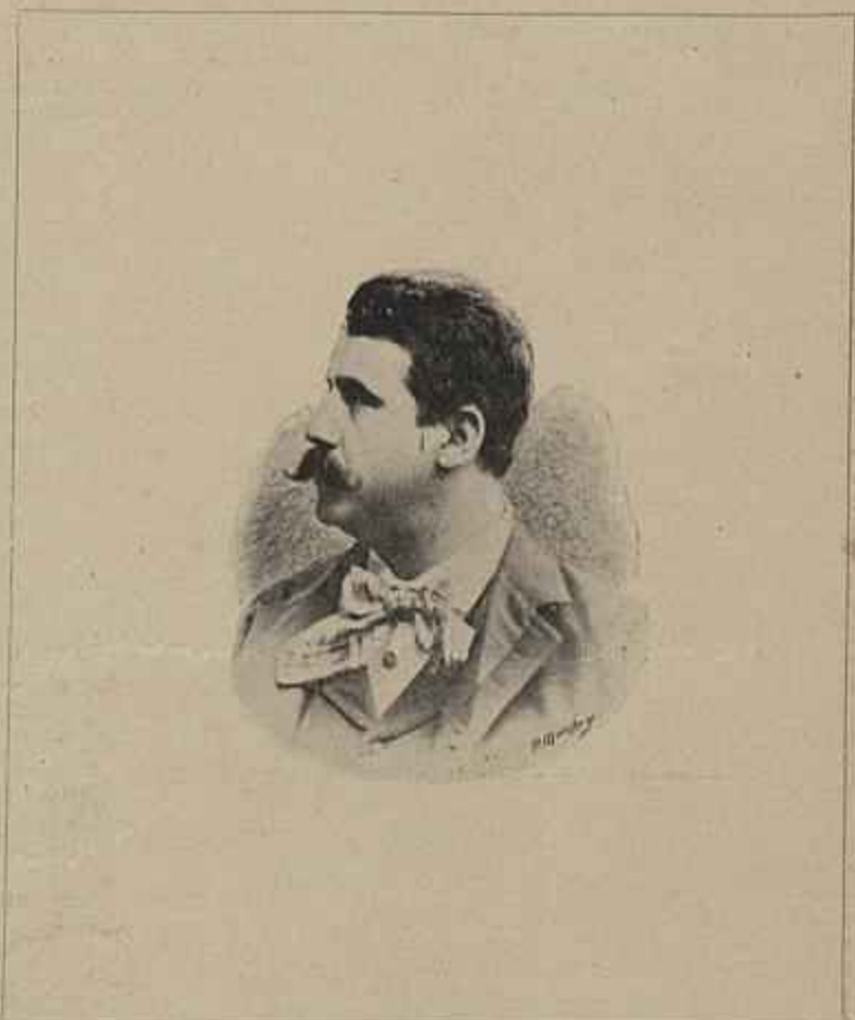
MAESTRO R. LEONCAVALLO