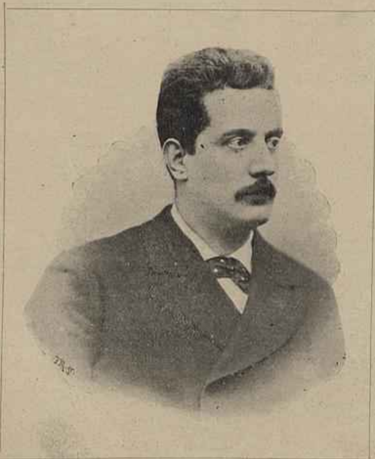
MAESTRO GIACOMO PUCCINI