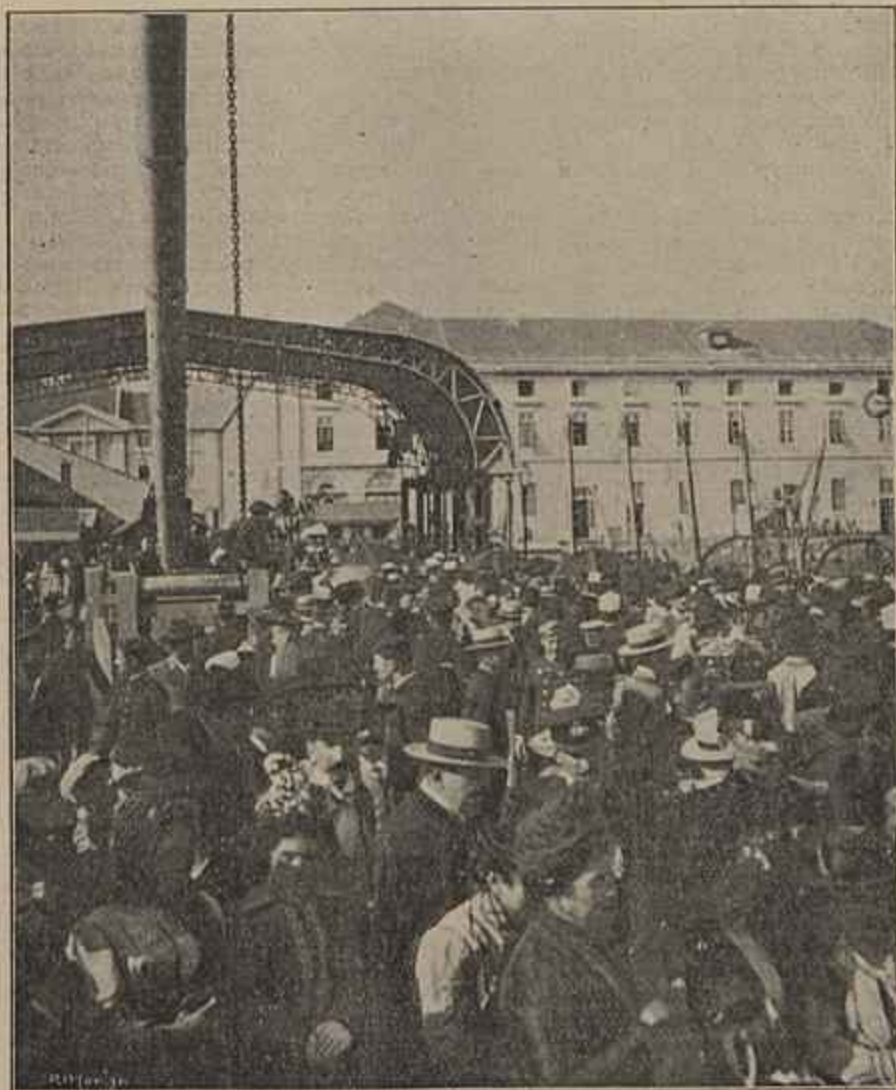
A EXPEDIÇÃO MILITAR PARA LOURENÇO MARQUES