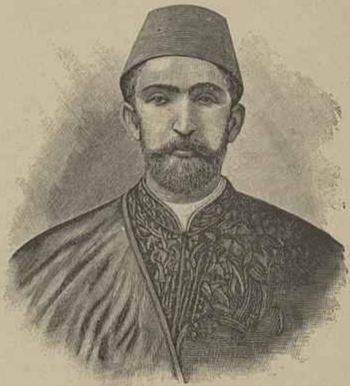
O CONFLICTO FRANCO-TURCO

VÍCTIMA DO ATTENTADO, EM BUFFALO, EM 6 DO CORRENTE