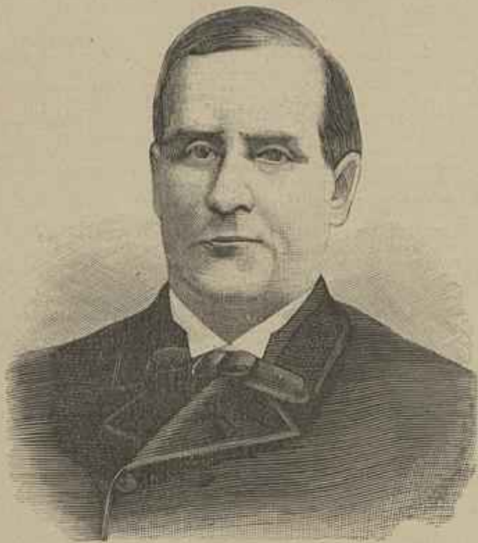
O PRESIDENTE MAC-KINLEY

VÍCTIMA DO ATTENTADO, EM BUFFALO, EM 6 DO CORRENTE