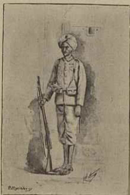
SOLDADO INDIGENA (INDIA) — Aquarella de Ribeiro Arthur