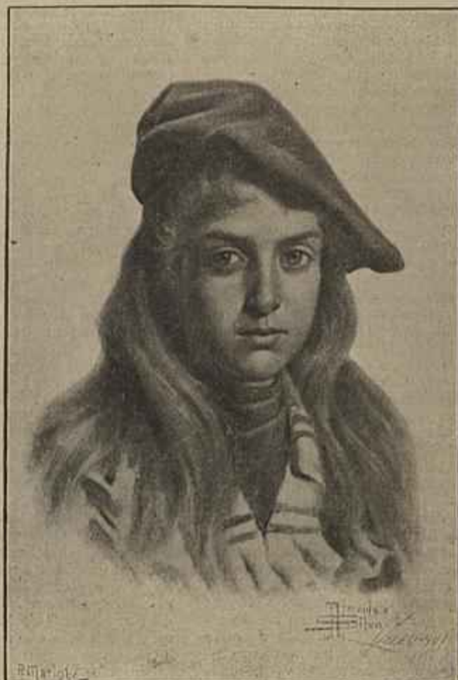
RETRATO DE UMA MENINA — De Almeida e Silva