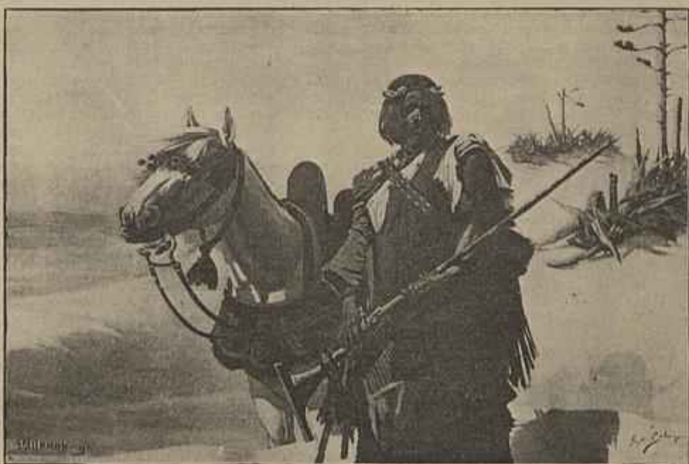
UM NOMADA — Quadro de Jorge Collaço