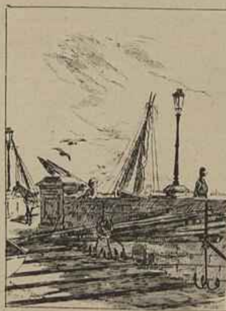
CAES DAS COLUMNAS — Aquarella de Alfredo Moraes