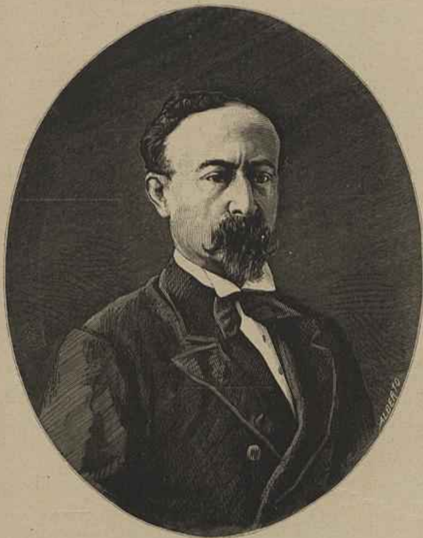
CONDE DE S. JANUARIO

Todos os pedidos de assignaturas deverão ser acompanhados do seu importe, e dirigidos à administração da Empresa do Occidente, sem o que não serão attendidos. — Editor responsável Caetano Alberto da Silva.