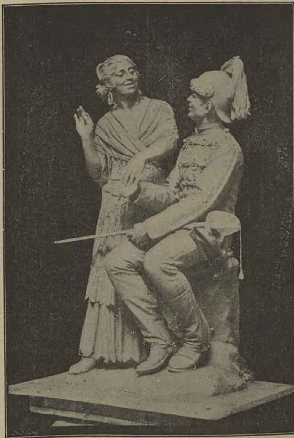
LENDO O FUTURO

Dois concertos que nos foram dados pela philarmonica de Berlim só bem nos poderiam fazer, tão desacostumados estamos a primores de musi-