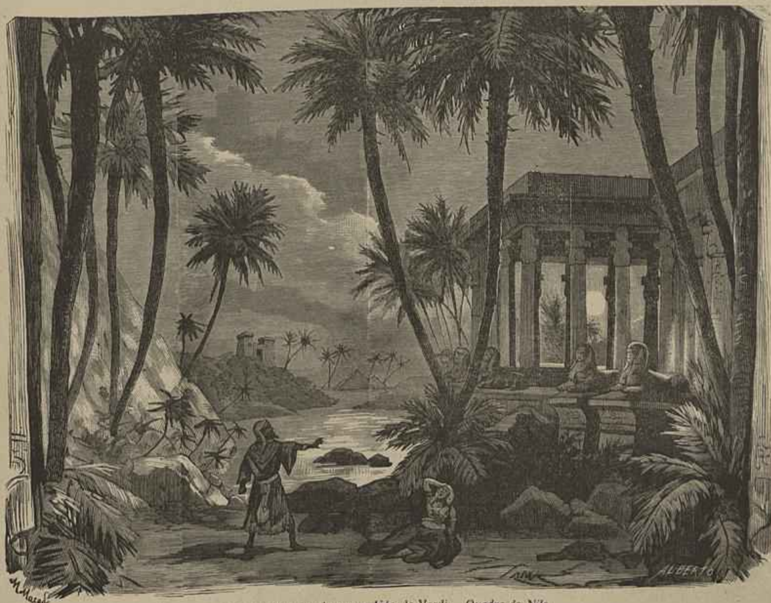
Scena do 3.º acto da opera Aida , de Verdi — Quadro do Nilo