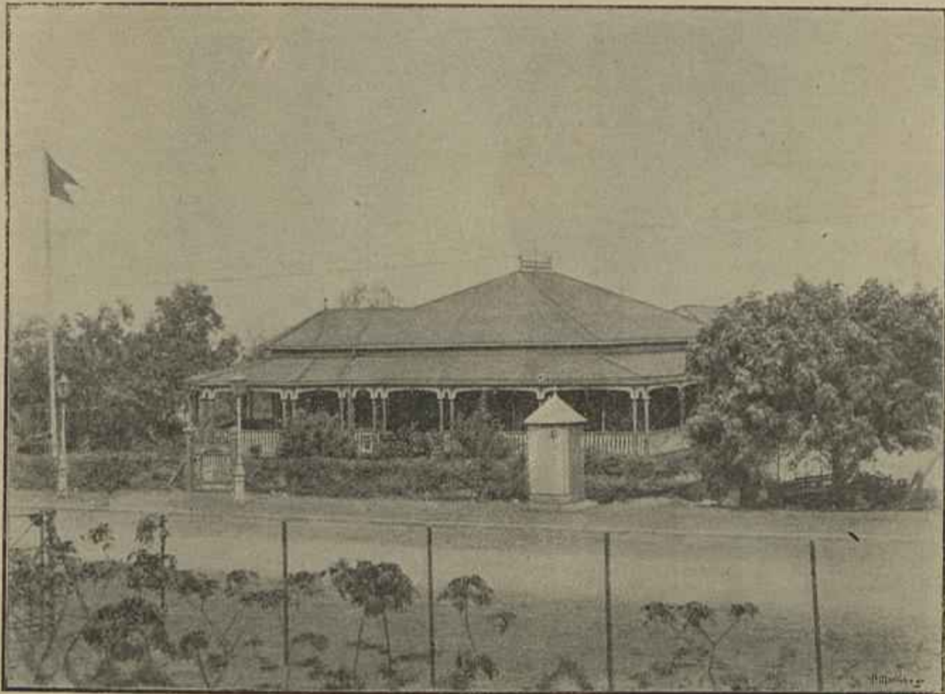
CASA DO GOVERNADOR DE LOURENÇO MARQUES, ONDE ESTEVE HOSPEDADO O PRESIDENTE KRUGER