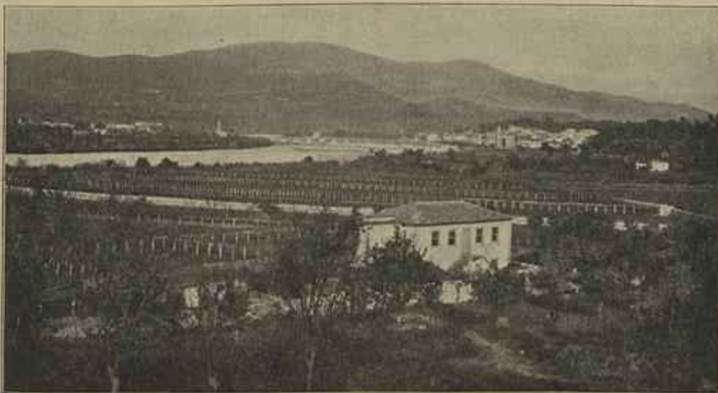
VISTA PANORAMICA DA REGOIA