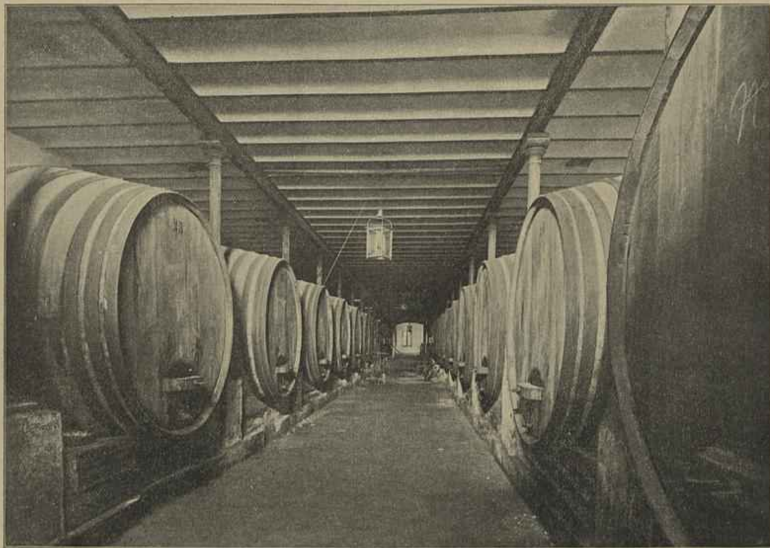
ADEGA SOCIAL DA UNIÃO VINICOLA E OLEICOLA DO SUL COM SÉDE EM VIANNA DO ALEMTEJO

do Tejo, abrangendo uma larga faixa abaixo d'este rio, vindo cortornar pelo Pinhal Novo, proximidades de Azeitão e Setubal, até fechar no termo de Lisboa junto á costa.