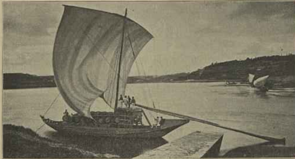
BARCO RABELLO TRANSPORTANDO VINHOS PELO RIO DOURO

A partir d'este momento, o desenvolvimento da electricidade foi tão grande que hoje constitue um ramo especial de physica, o qual tomou o nome do phenomeno. A appareção dosapparelhos, machinas e instrumentos electricos não tardou a fazer-se esperar, não só para o estudo da electricidade estatica, como tambem para o estudo da electricidade dinamica, e hoje podemos dizel-o sem receio de errarmos que os nomes de Franklin, Volta, Galvani, Ampère, Coulomb, Ohm e varios outros que se acham intimamente ligados ao estudo da electricidade, ficarão immortalizados nos annaes da sciencia.