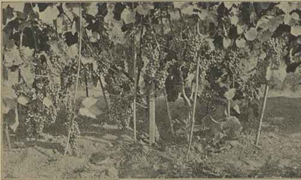
RAMADAS DE VINHA EM PONTE DO LIMA

aos ventos de Africa, o Algarve é uma região temperada, bastante quente mesmo no verão. D'ahi lhe vem a qualidade muito socebonia que caracteriza todos os fructos que ahí se produzem, excellentes e saborosissimos, e por isso tambem a tendencia para forte riqueza alcoolica dos seus vinhos. Por este motivo não poucos escriptores ruraes do nosso paiz teem aconselhado aos viticultores d'esta região a adoptarem uma orientação differente da que tem seguido na sua industria vinicola, excitando-os a que procurem na escolha das castas de videira e nos processos de fabrico empregados a encaminhar os seus vinhos no sentido de os poder levantar ao typo de vinhos generosos, approximando-os um pouco do typo Malaga, ao que a provincia se presta excellentemente.