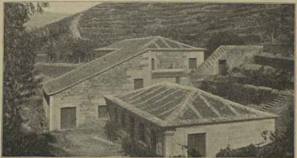
TYPO DE QUINTA NO DOURO

O novo programma, para a adjudicação do theatro de S. Carlos, havia elevado os preços das recitas ordinarias, e além d'isso permittia maior elevação, sem limite, para representações extraordinarias em que figurassem artistas de excepcional merecimento ou reputação; o que fez dizer, applicando linguagem culinaria, que aos assignantes das recitas ordinarias só se dava sopa, vaca e arroz n'estas festas lyricas, tendo que pagar à parte, como suplemento, e por melhores pre-