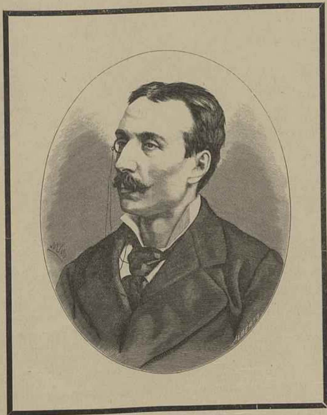
EÇA DE QUEIROZ — FALLECIDO EM PARIS NO DIA 17 DO CORRENTE