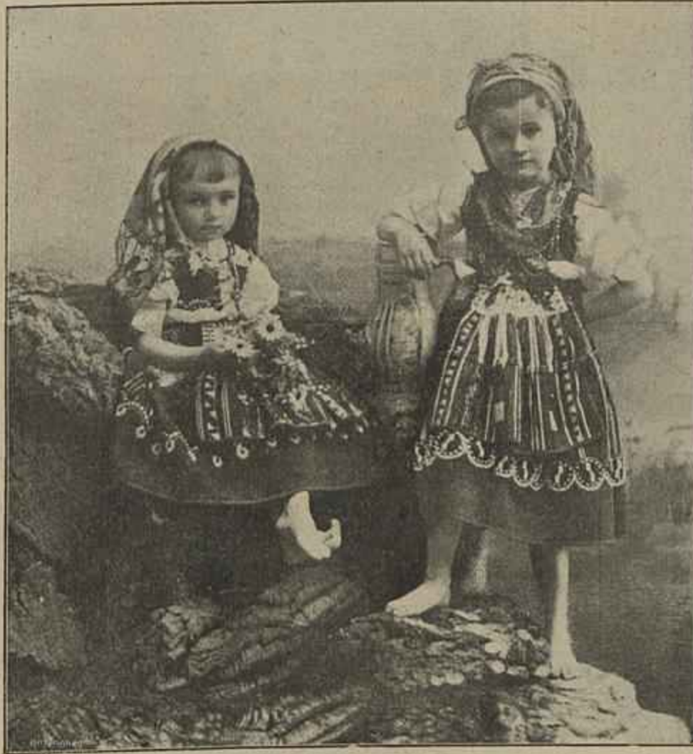
INFANTAS D. ISABEL MARIA E D. MARIA BENEDICTA DE BRAGANÇA

O que acabamos de dizer é tanto mais importante que, em certos individuos menos predispostos, desenvolve-se, em seguida a este exercicio, um estado mental particular que consiste n'uma especie d'automatismo que entorpece o pensamento com o auxilio das sensações physicas, o que explica que certas pessoas encontram