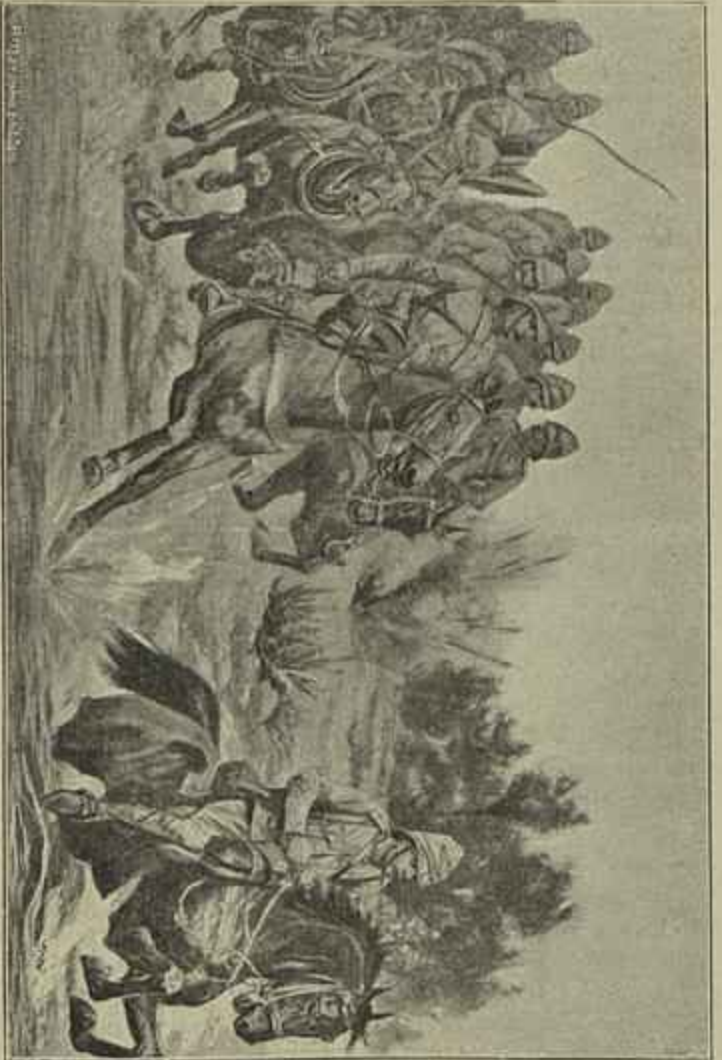
ARTILHERIA INGLEZA EM MARCHA PARA PRETORIA