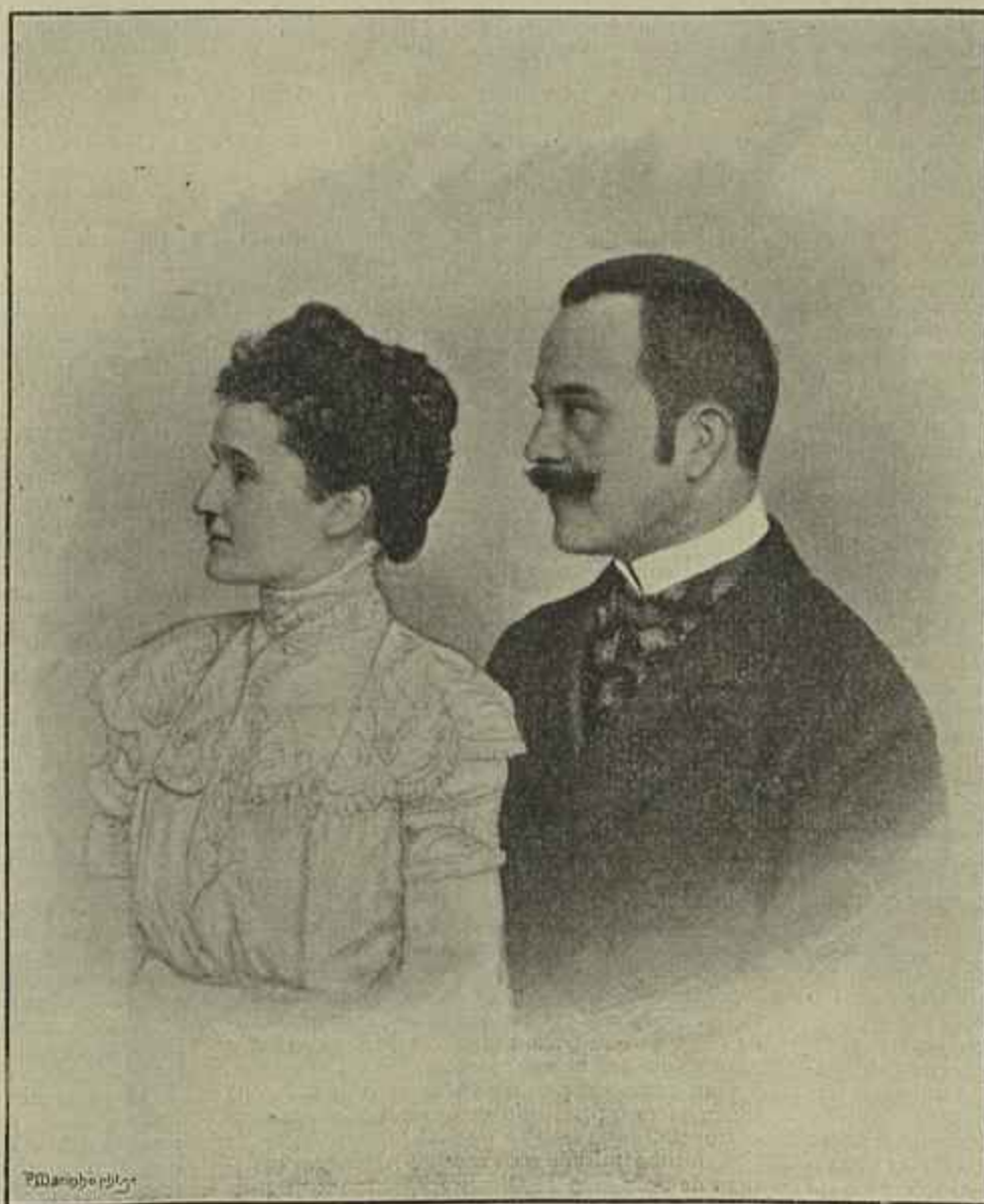
OS PRINCIPES DE THURN-ET-TAXIS, D. MARIA THEREZA DE BRAGANÇA E D. CARLOS LUIZ, CONSORCIADOS EM REGENSBURG NO DIA 22 DE MAIO DE 1900.