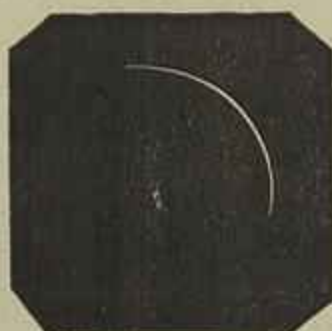
Braga, 3 horas e 25 m. maximo