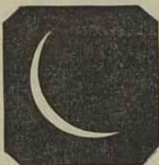
Lisboa, 3 horas e 28 m. maximo