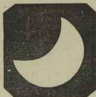
Lisboa, 4 horas