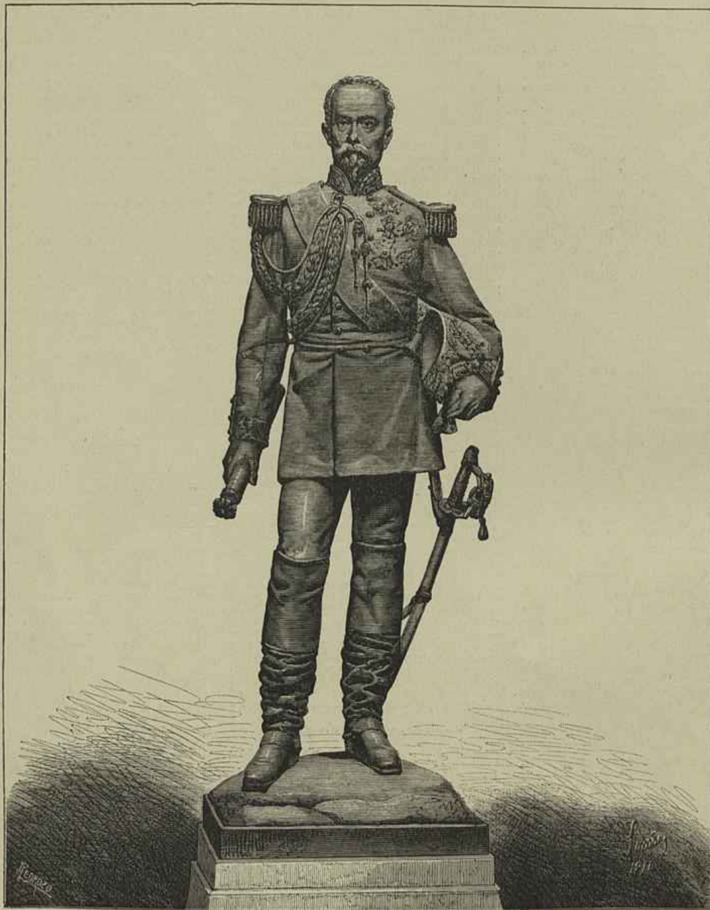
ESTATUA DO DUQUE DA TERCEIRA — ESCULTURA DO SR. SIMÕES D'ALMEIDA

meritos da industria portugueza, para o estabelecimento da fabrica de vidros da Marinha Grande, 52:000$000 réis, que pagou, permittendo-se-lhe tambem o uso gratuito das limpezas do pinhal de Leiria para seu combustivel. Esta fabrica parece que assentou sobre a que da villa de Coima para