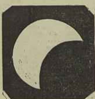
Lisboa, 3 horas