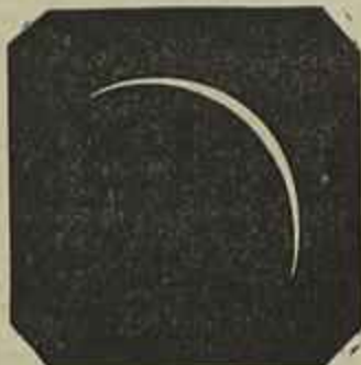
Bragança, 3 horas e 26 m. maximo