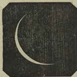
Faro, 3 horas e 31 m. maximo