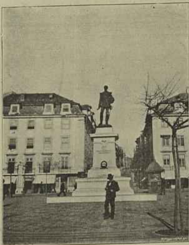
MONUMENTO DO DUQUE DA TERCEIRA, EM LISBOA