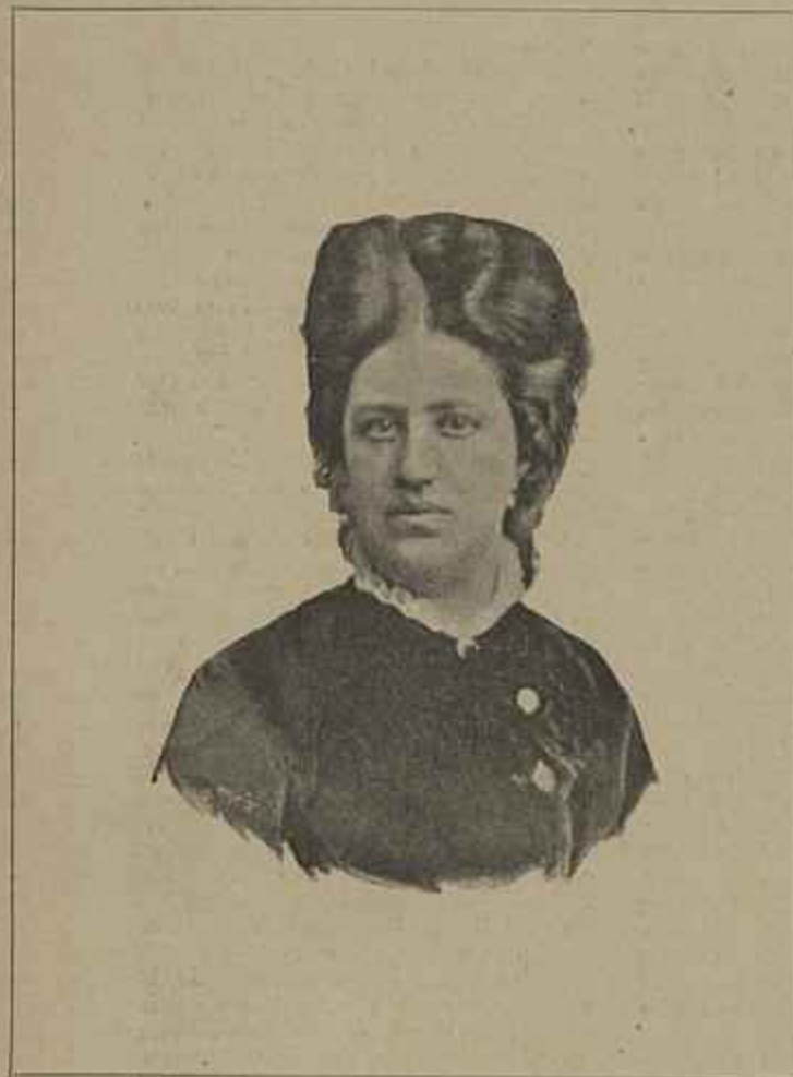
DUQUEZA DE PALMELLA

culo, foi o signal da debandada, e então tinha o seu quê de phantastico o dispersar d'aquelle formigueiro humano, agitando-se irrequieto, na meia luz da transição para a noite.