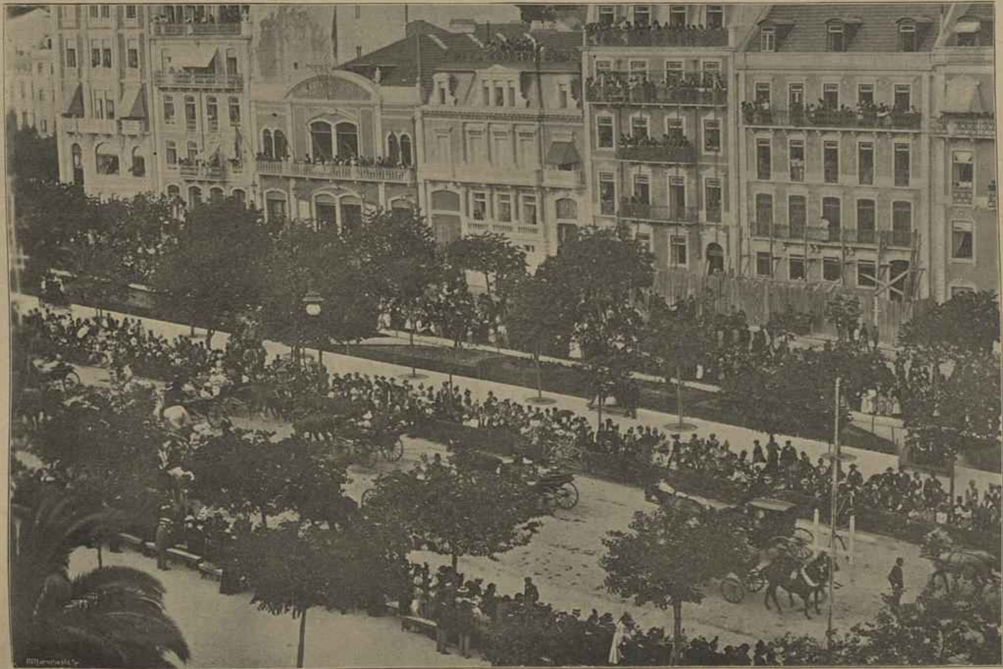
ASPECTO DA AVENIDA DA LIBERDADE DURANTE A BATALHA DE FLORES