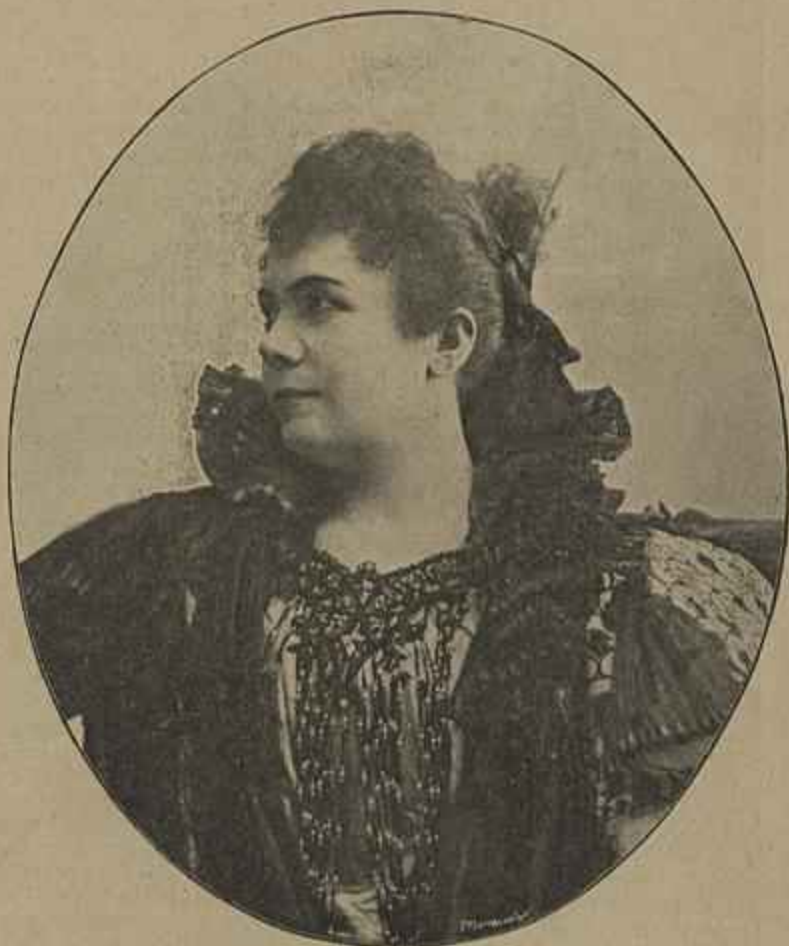
A PRIMA DONA EVA TETRAZZINI