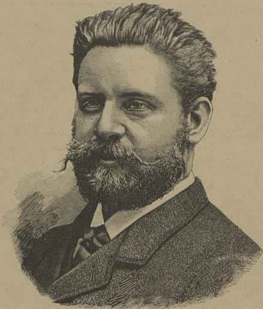
O MAESTRO ALFREDO KEIL, AUCTOR DA OPERA A Serrana