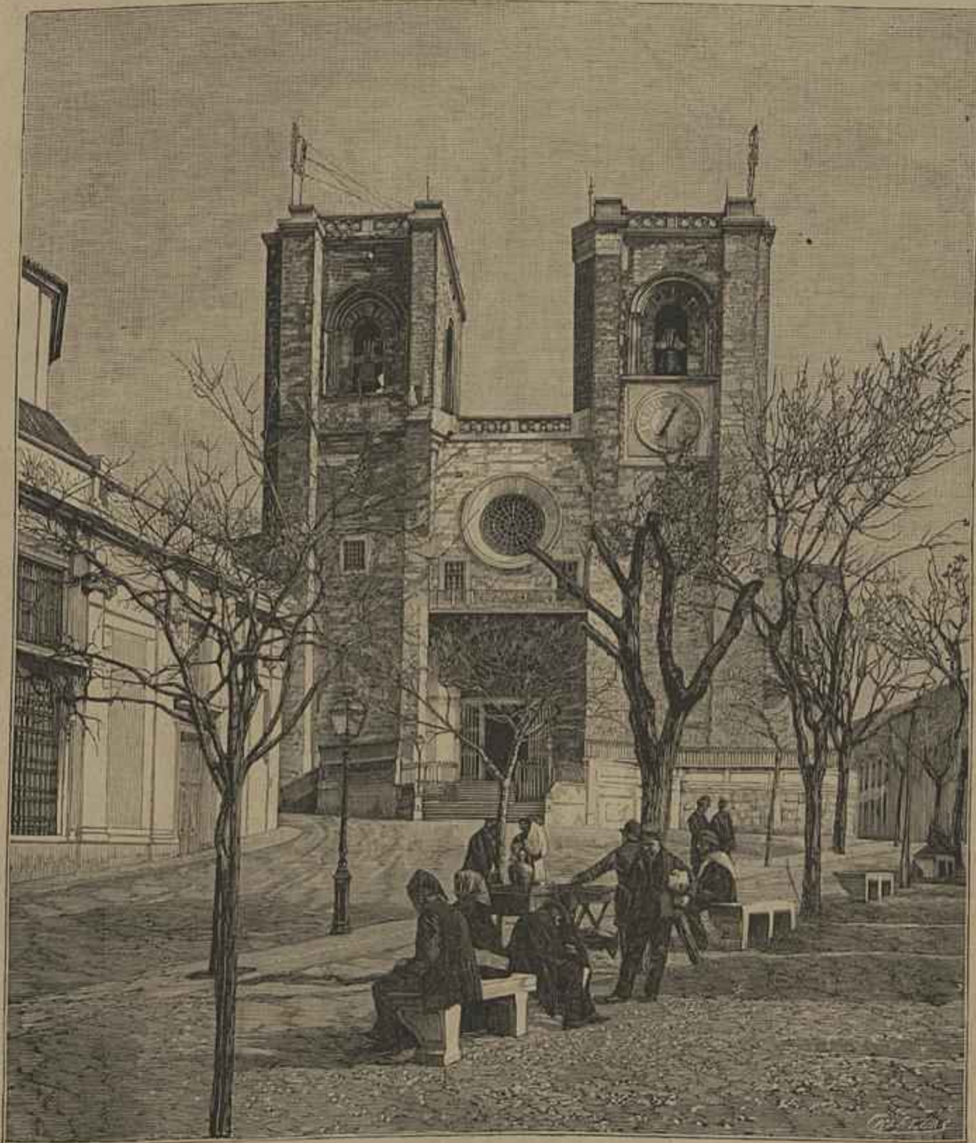
ESTADO ACTUAL DO EDIFICIO