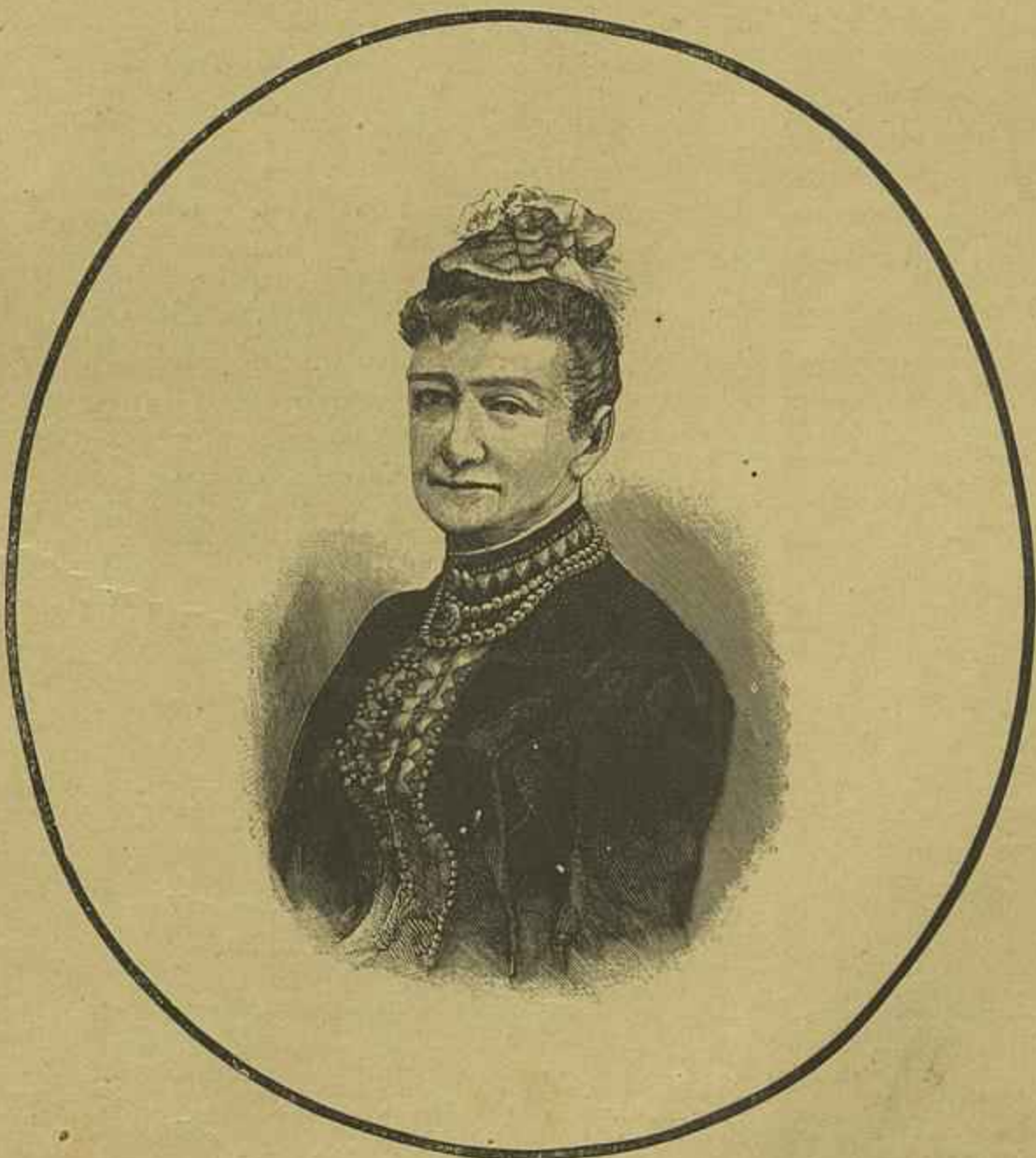
S. M. A RAINHA LUIZA DA DINAMARCA — FALLECIDA EM 29 DE SETEMBRO DE 1898

A jarra Beethoven de que muito especialmente desejaríamos falar, é obra d'uma imaginação irrequieta, desabroxada ao sol, ebria de luz e de perfumes trepadores, que sonha e logo executa, com a vivacidade, o entusiasmo, o fogo, com que um meridional sente logo, logo que percebeu, ás vezes, ainda antes de haver percebido, por uma intuição misteriosa que faz adivinhar.