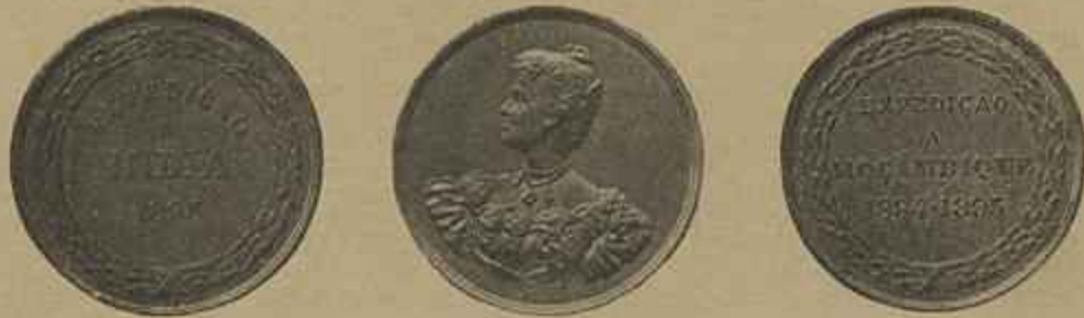
MEDALHA DAS EXPEDIÇÕES A MOÇAMBIQUE E Á INDIA