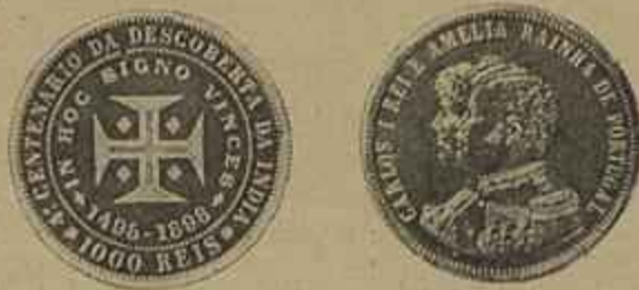
MOEDA DO CENTENARIO DA INDIA

Já alcança o numero de 5 fasciculos a collecção dos Annaes da Comissão Central Executiva do centenario do descobrimento da India.