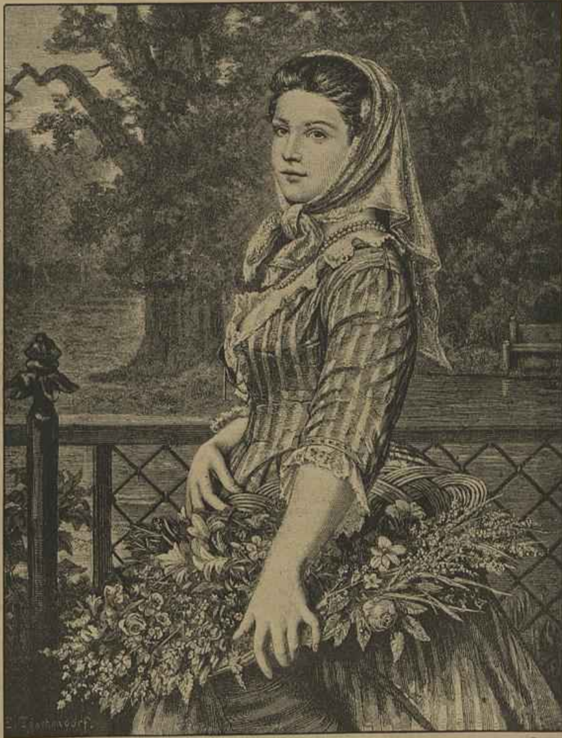
UMA FLORISTA DE BARCELONA

Magalhães entrou em commercio com o rei d'aquella ilha, não sem alguma difficuldade, pois que o regulo queria que os hespanhoes lhe pagassem egual tributo ao que era