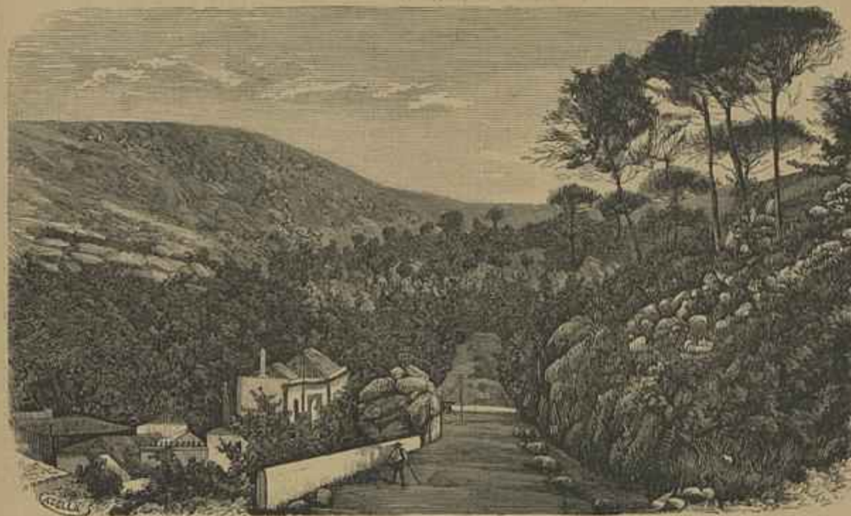
MONCHIQUE — As CALDAS