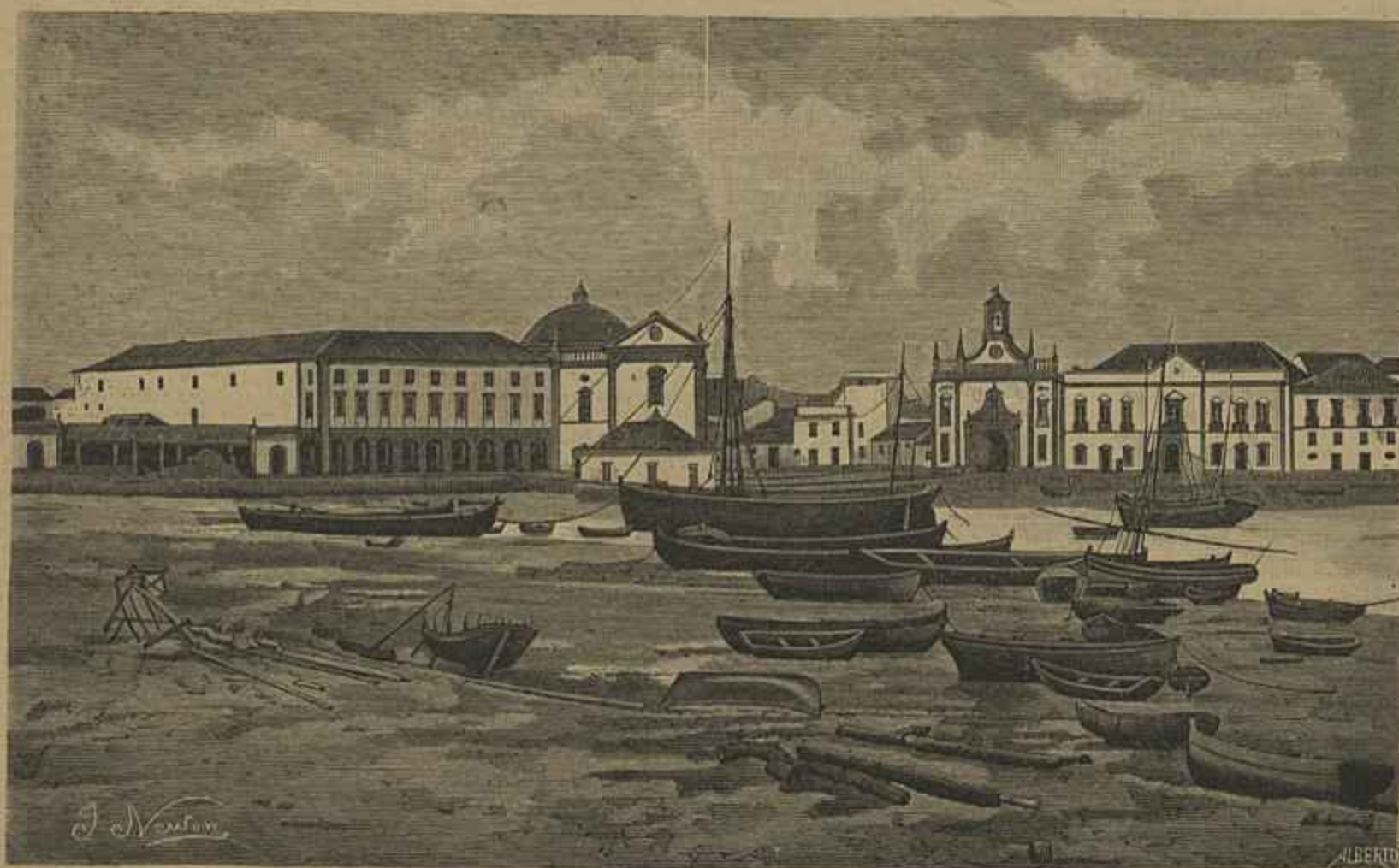
FARO — A PRAÇA DA RAINHA — Vid. Chronica Occidental (Copia de photographia)