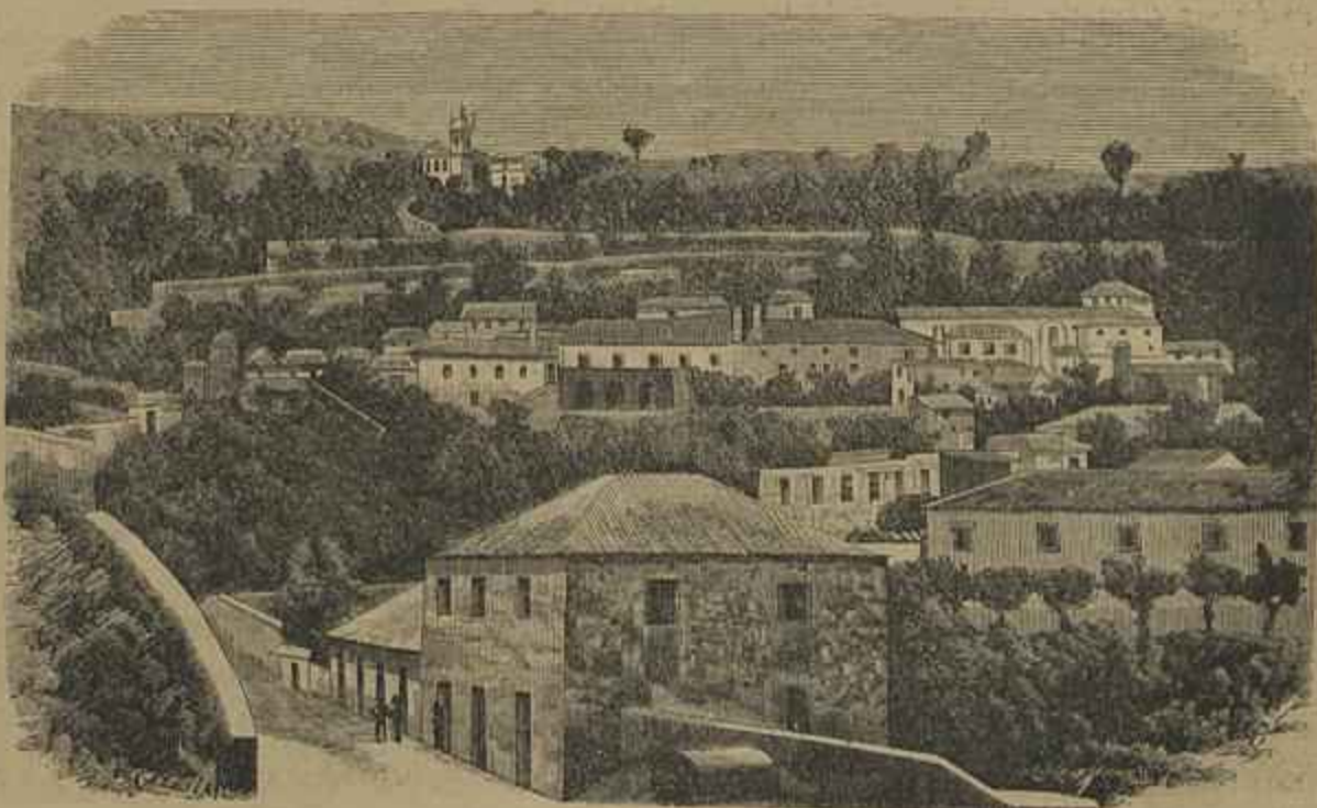
MONCHIQUE — VISTA DA VILLA — Vid. Chronica Occidental

D'esses tempos e d'essa abastada casa, o autor d'estas linhas possui apenas o grosseiro e pesado punho da espada, que devia servir a fraude do pedreiro, e está marcado com o nome, em letras invertidas, de Boutet , ao que parece, afamado fabricante da época.