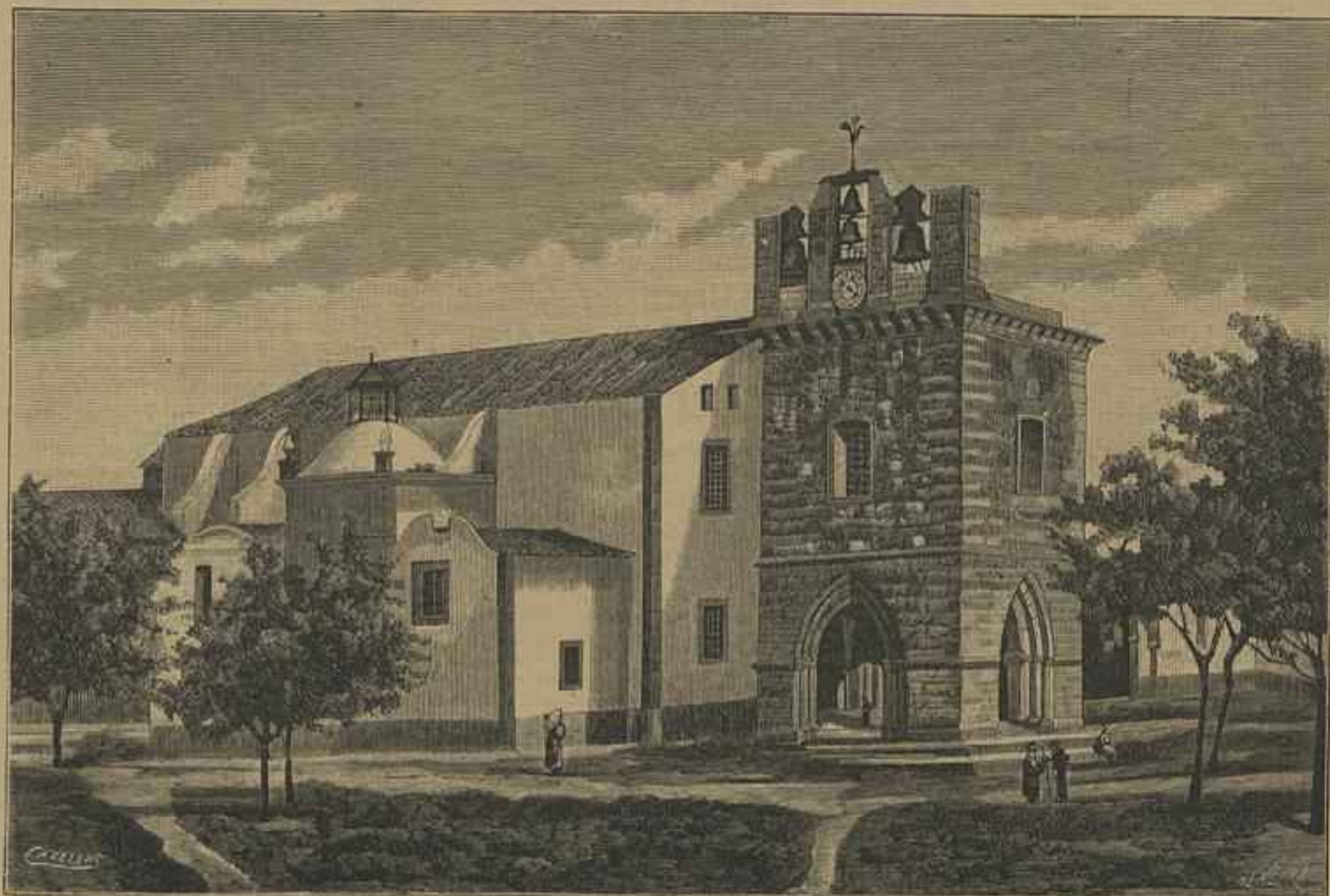
FARO — A EGREJA DA SÉ — Vid. Chronica Occidental (Copia de photographia)