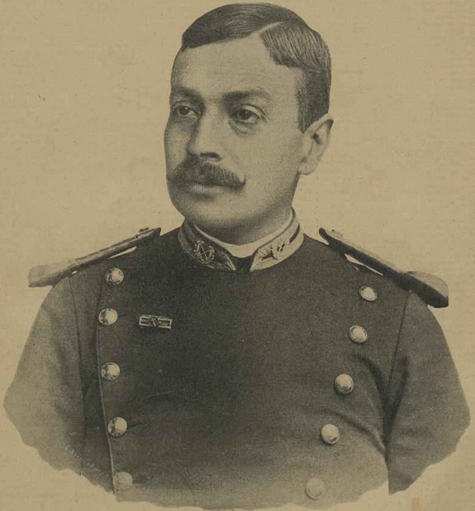
MAJOR MOUSINHO D'ALBUQUERQUE — COMISSARIO REGIO DA PROVINCIA DE MOÇAMBIQUE