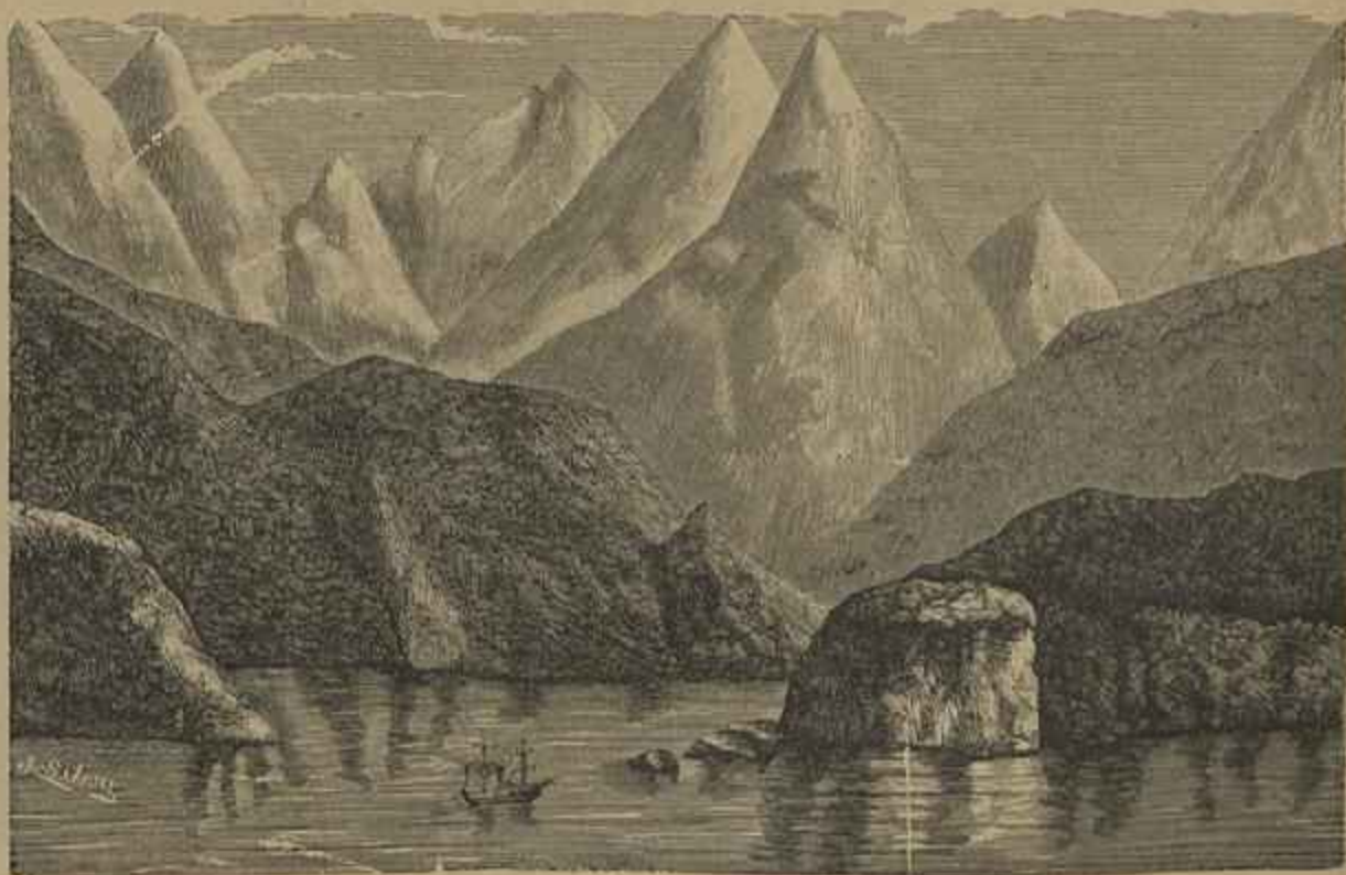
ESTREITO DE MAGALHÃES — Vid. artigo Fernão de Magalhães

É excellente a impressào que produz o encarnado d'um guarda sol na physionomia da menina que o sustem. A paisagem está bem tratada, mas