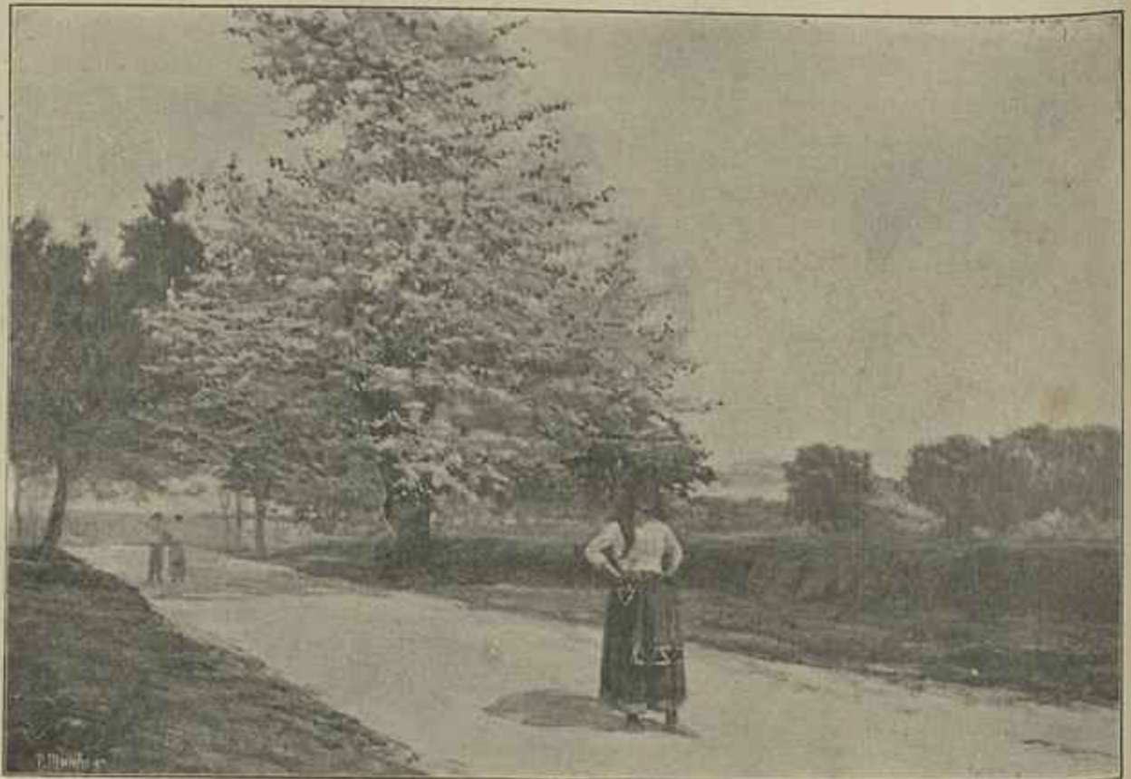
OLAIA EM FLOR — Quadro do sr. Carlos Reis