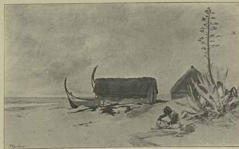
NA COSTA DE CAPARICA—Aquarella do sr. Roque Gameiro