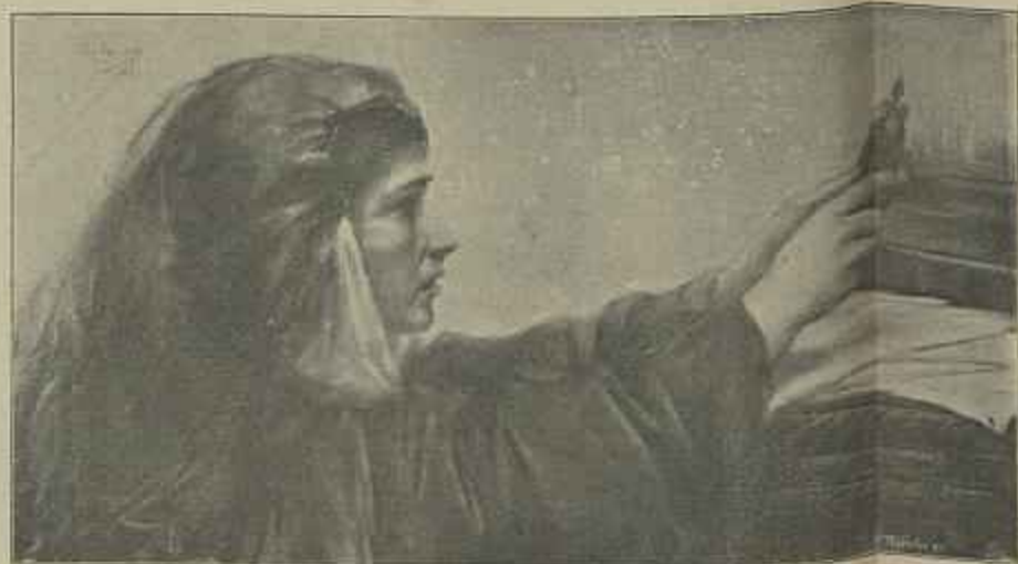
SOROR MARIANNA—Pastel de Sr. Condessa do Alto Mourim