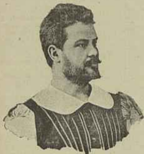
O TENOR MORALES

A navalha nas mãos d'esse selvagem fez as suas proezas na praça de D. Pedro, onde se reunem, n'aquella noite, os bandos populares em alegres descantes e danças. Veio perturbar a alegria da festa, manchou a de sangue, fez uma morte, achou-se no seu elemento. A victima foi um rapaz carroceiro, bem comportado; o assassino um outro rapaz de 19 annos, um fadista, que se entregava mais à vida airada do que ao seu officio de caldeireiro, e que já tem um longo cadastro na policia e na Boa Hora.