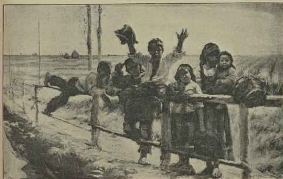
A PASSAGEM DO COMBOIO—Quadro do sr. José Malhoa