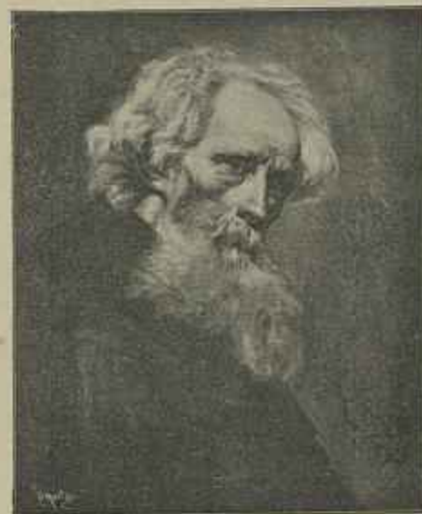
UMA CABECA DE ESTUDO—Quadro do sr. Galhardo