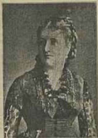
Baroneza de Carayon La Tour