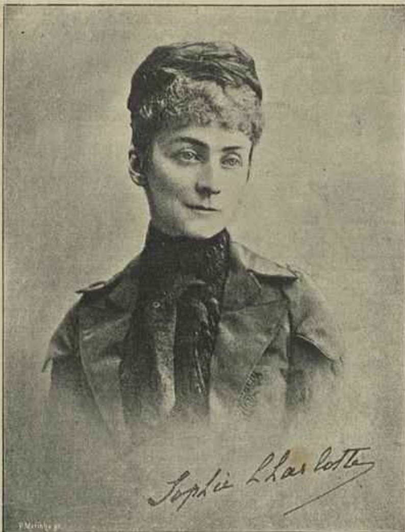
DUQUEZA DE ALENÇON