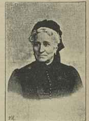
Baroneza de Saint-Didier