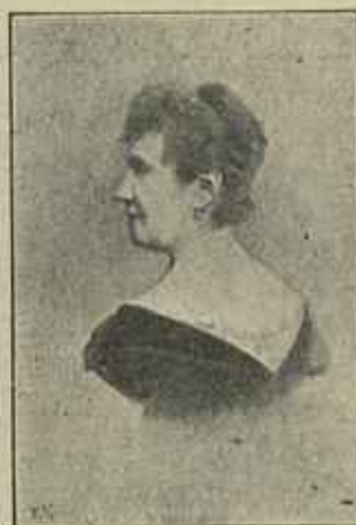
Condessa de Saint-Ange