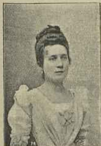
Viscondessa de Beauchamp