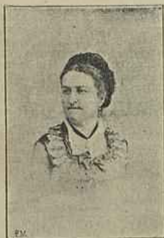
Condessa de Hunolstein