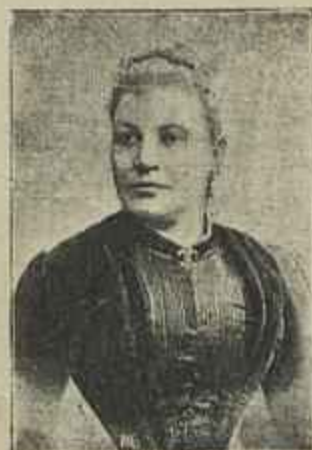
Marqueza de Isle