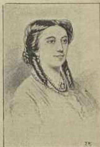
Condessa de Horn