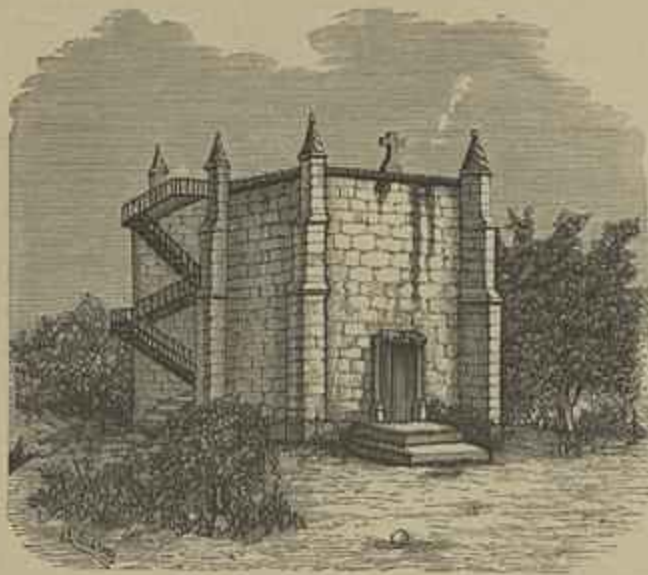
CAPELLA DE S. JERONYMO (Croquis do sr. J. Netto)