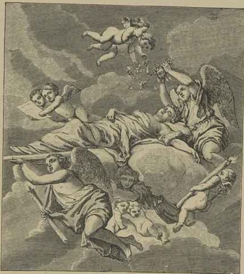
SANTA CATHARINA LEVADA PELOS ANJOS

Typ. de A. E. Barata Rua Nova do Loureiro, 25 a 2ª