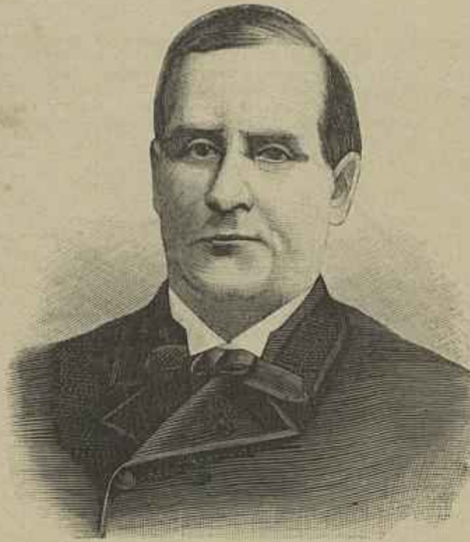
GUILHERME MAC-KINLEY — NOVO PRESIDENTE ELEITO DA REPUBLICA NORTE AMERICANA