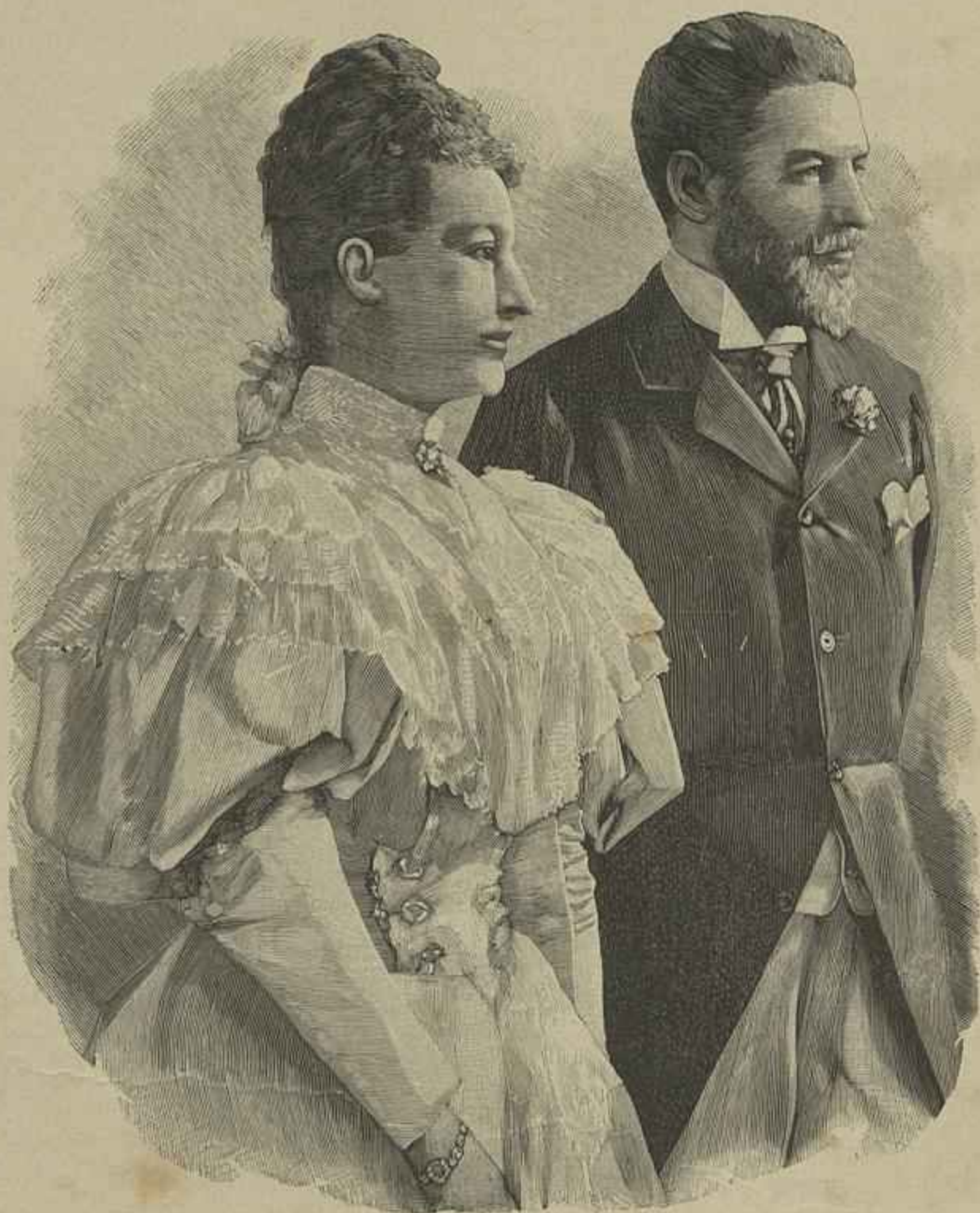
O DUQUE DE ORLEANS E A ARCH-DUQUEZA MARIA DOROTHEA