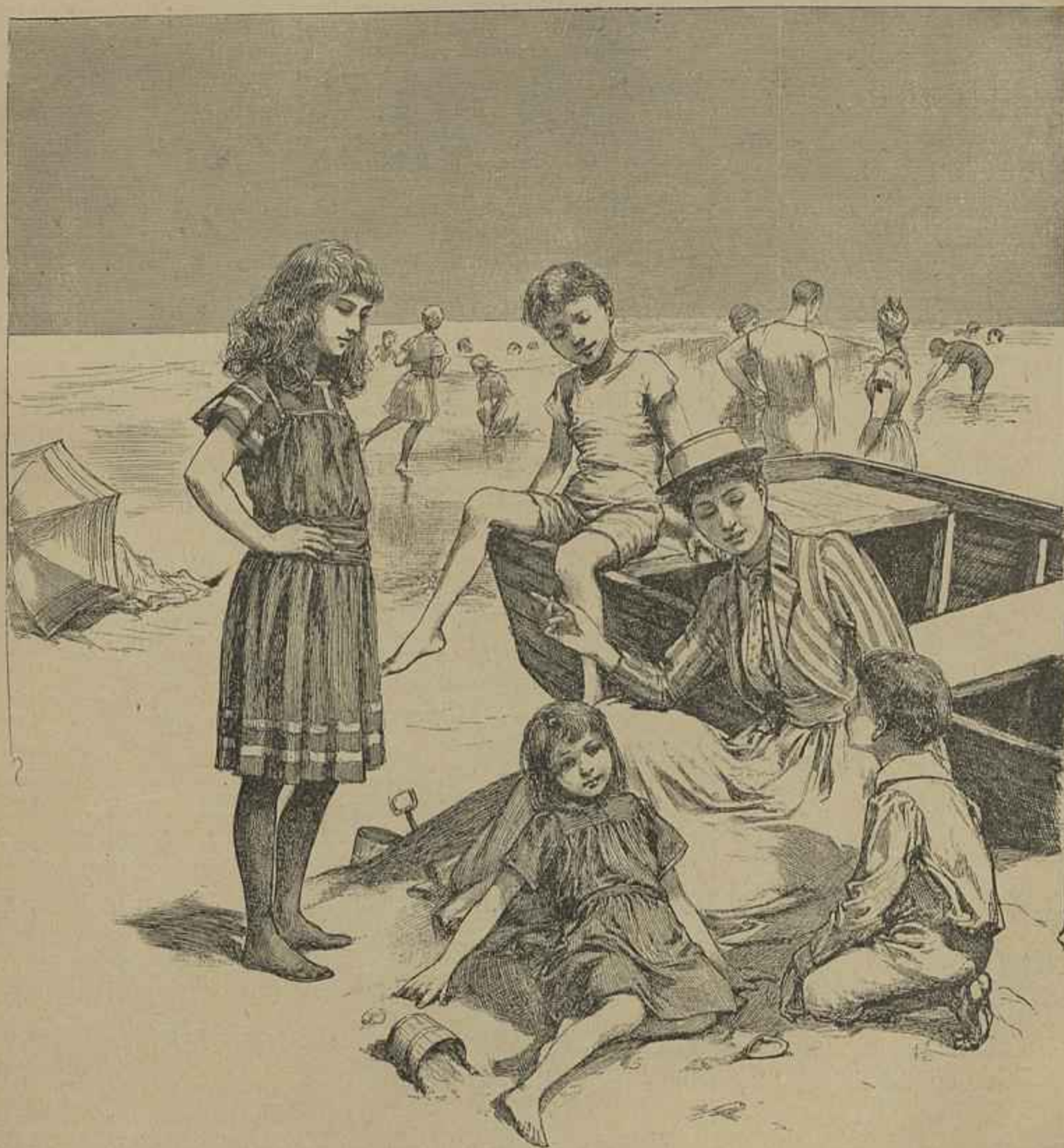
NAS PRAIAS — Vid. Chronica Occidental