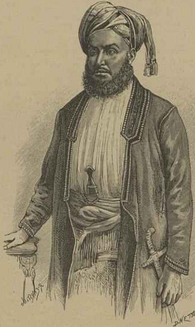
O SULTÃO DE ZANZIBAR — FALLECIDO EM 25 DE AGOSTO DE 1896

Ninguem contesta quanto é glorioso para Portugal lembrar esse grande serviço que prestou ao mundo e á civilização e quantos beneficios dimanaram d'elle para a humanidade. Não deve