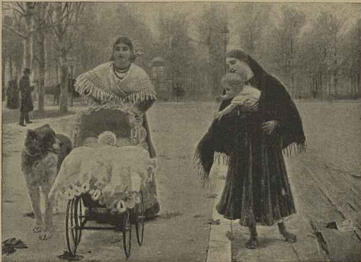
CONTRASTES — QUADRO DE VILLEGAS

Quanto mais incerto e vago surge o problema da nossa politica colonial, e se declara franca e iniludivel a crise moral hostile n'um paiz que é só nosso, e só poderá deixar de sel-o quando mor-