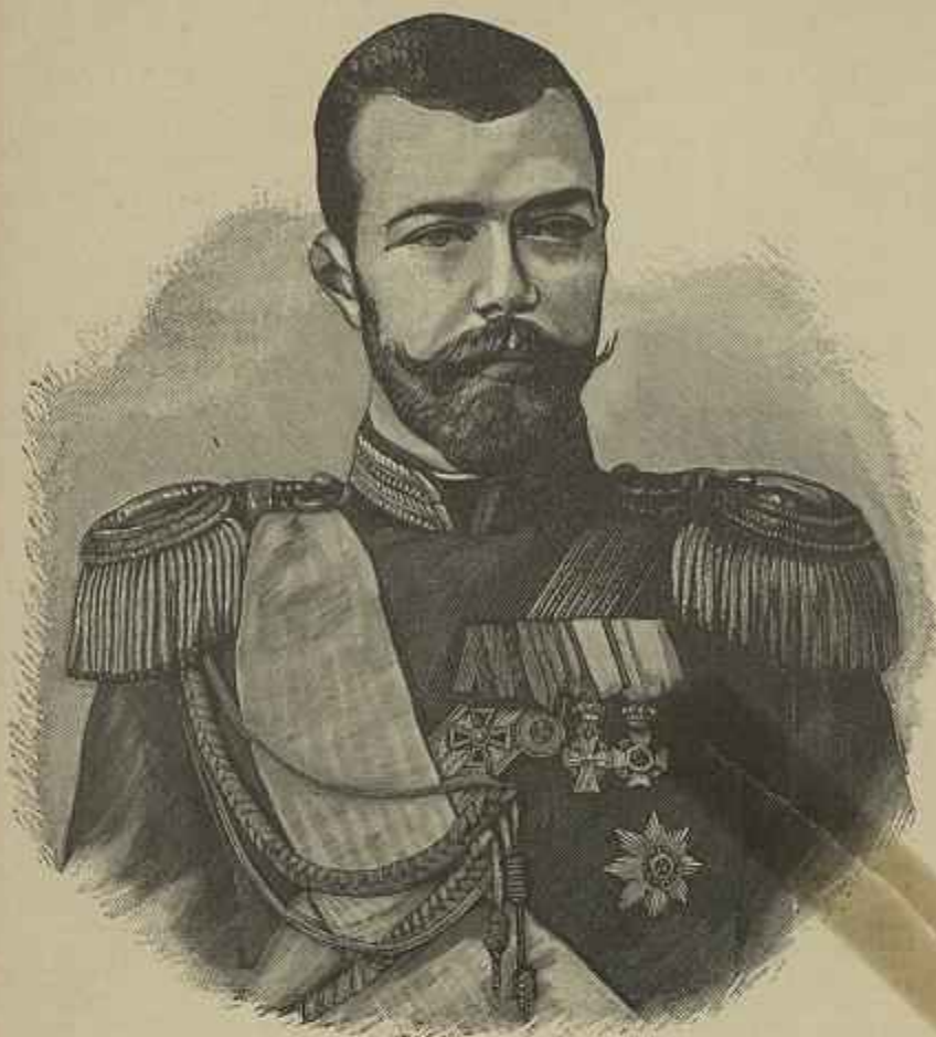
O TZAR NICOLAU II