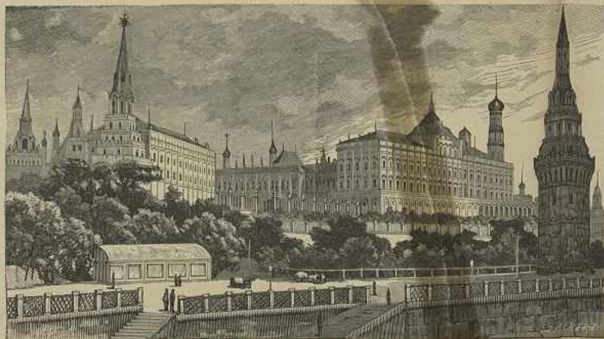
O PALACIO IMPERIAL NO KREMLIN