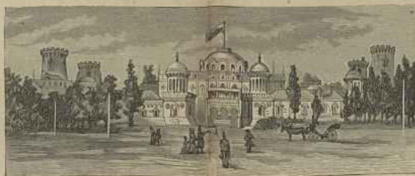
O PALACIO E USPENSKI