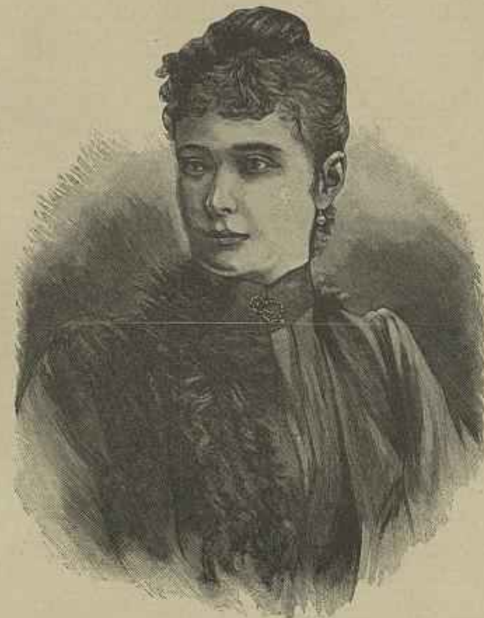
A TZARINA ALEIXA