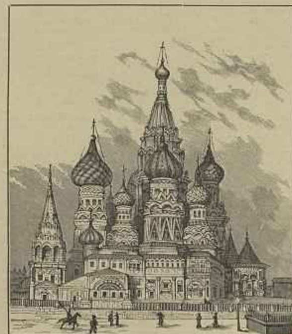
A EGREJA DA ANNUNCIACÃO EM MOSCOW