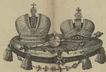
AS COROAS IMPERIAES