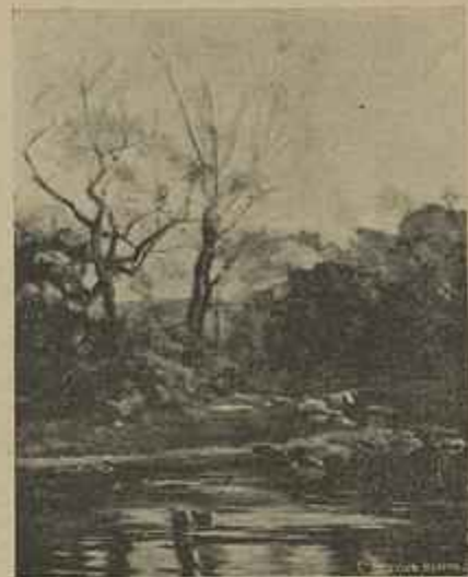
MANHÃ — QUADRO DO SR. MARQUES D'OLIVEIRA ✓