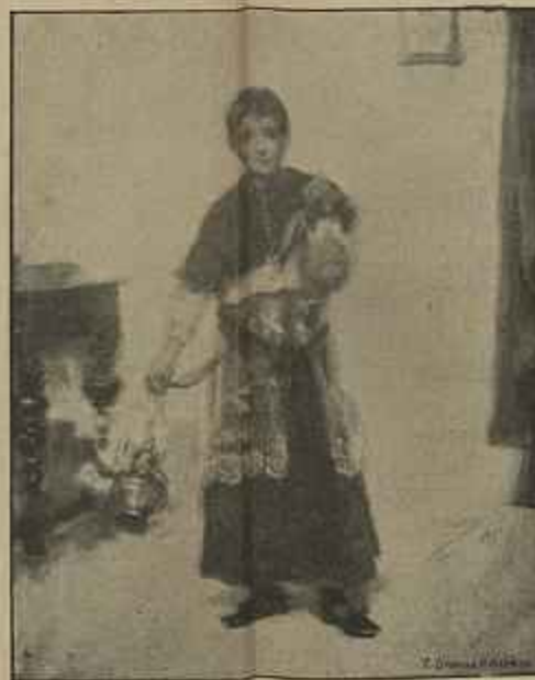
NA SACRISTIA — PASTEL DA SR. a CONDESSA DO ALTO-MEARES ✓