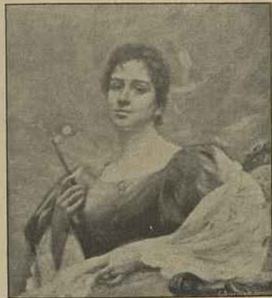
UM RETRATO — QUADRO DO SR. SALGADO ✓