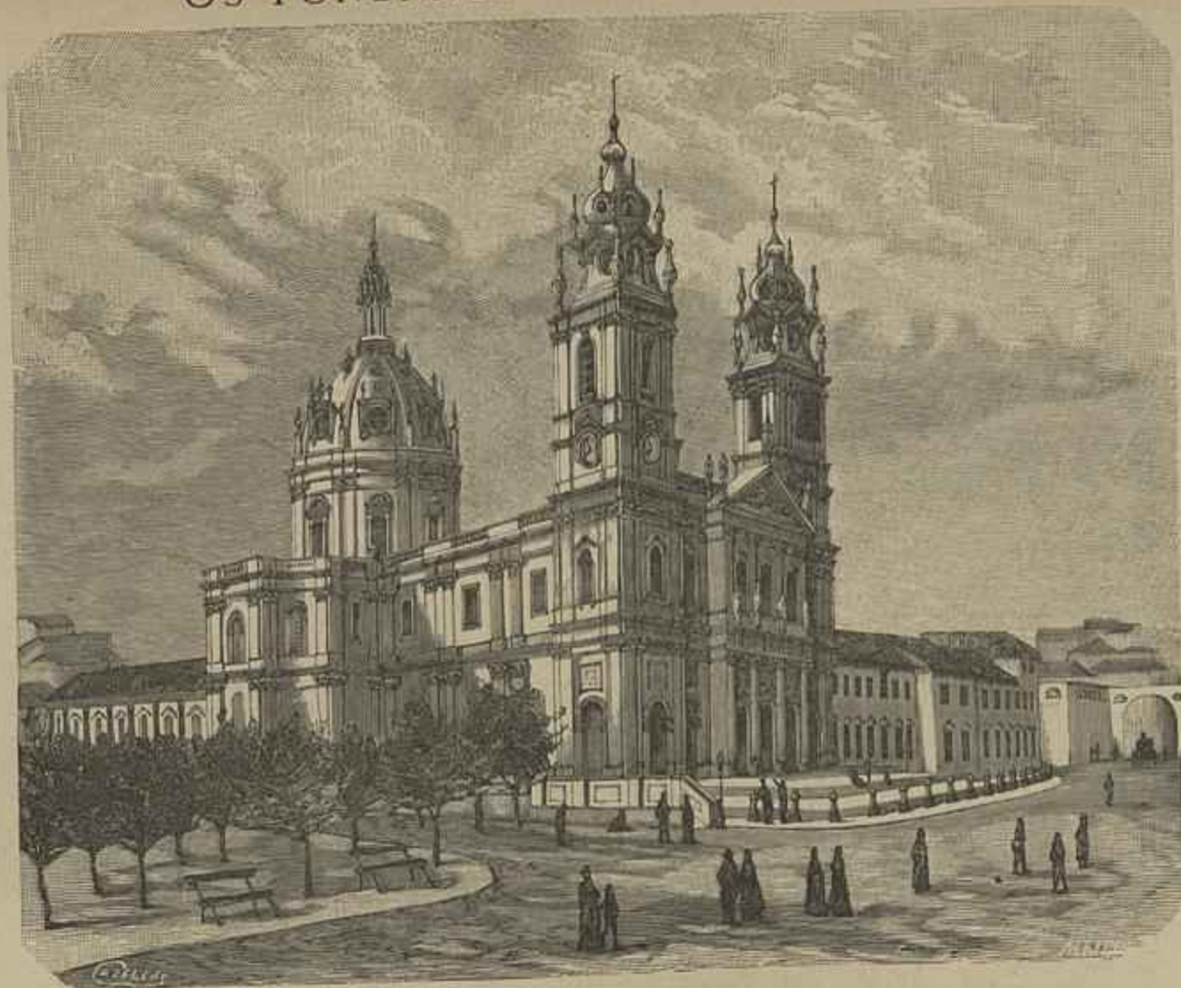
EGREJA DA ESTRELLA — ONDE ESTEVE DEPOSITADO O CORPO DE JOÃO DE DEUS