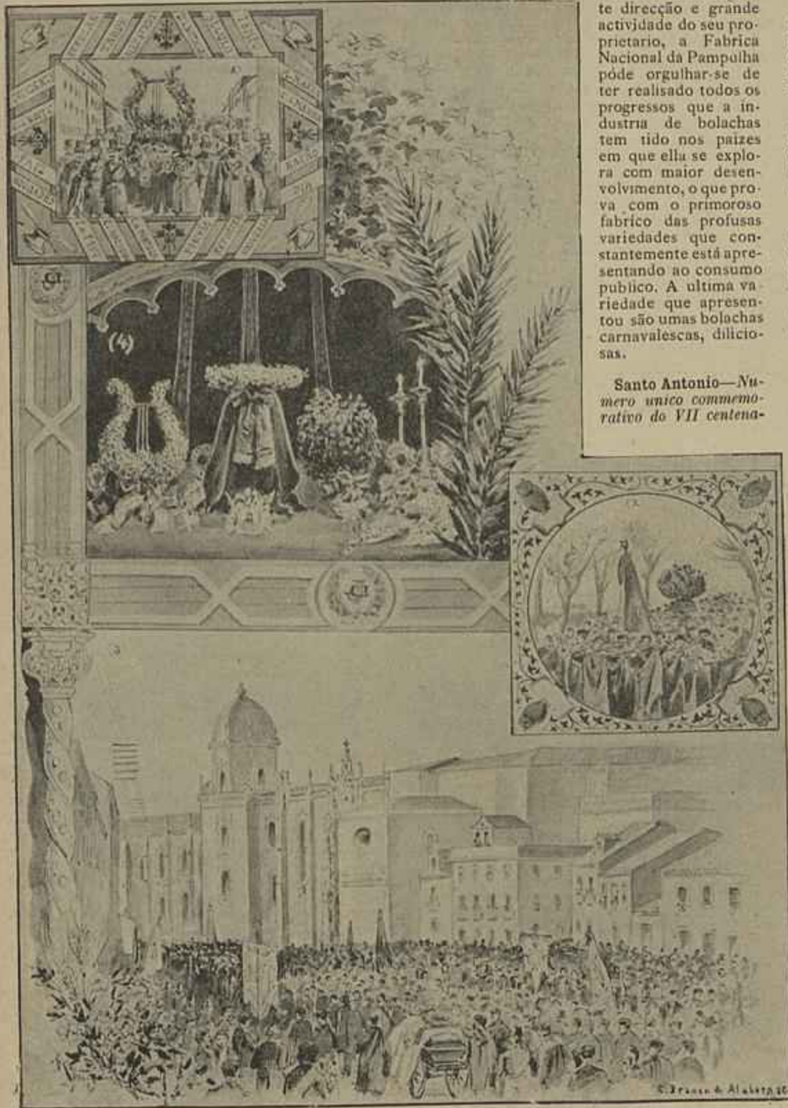
1 A IMPRENSA — 2 OS ESTUDANTES — 3 CHEGADA DO CORTEJO AOS JERONYMOS — 4 O CATAFALCO NOS JERONYMOS