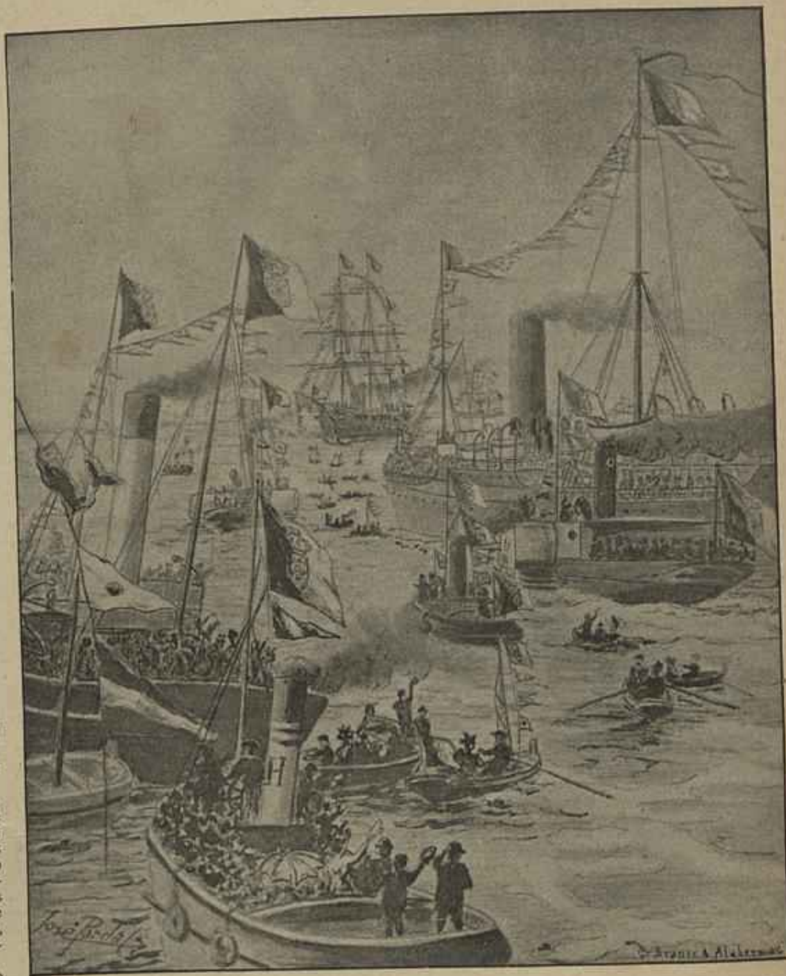
REGRESSO DAS FORÇAS EXPEDICIONARIAS A LISBOA — CHEGADA AO TEJO DO VAPOR «ZAIHE»