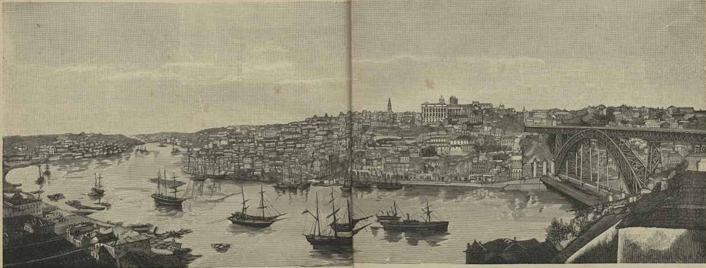
PANORAMA DO PORTO

E' certo que a descripção biographica de qualquer jornal não interessa a muitos leitores e torna-se por vezes massadora, mas para alguns não deixa ella de ser summamente curiosa e até util. A