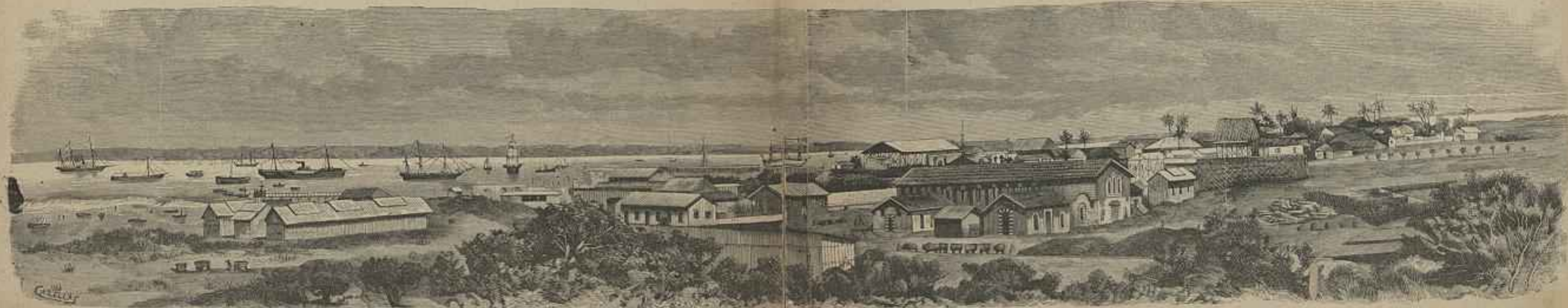
LOURENÇO MARQUES A GUERRA NA ÁFRICA ORIENTAL