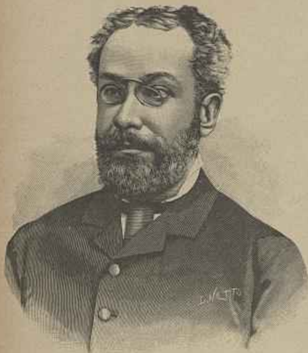
CONSELHEIRO ANTONIO ENNES — COMISSARIO REGIO NA PROVINCIA DE MOÇAMBIQUE