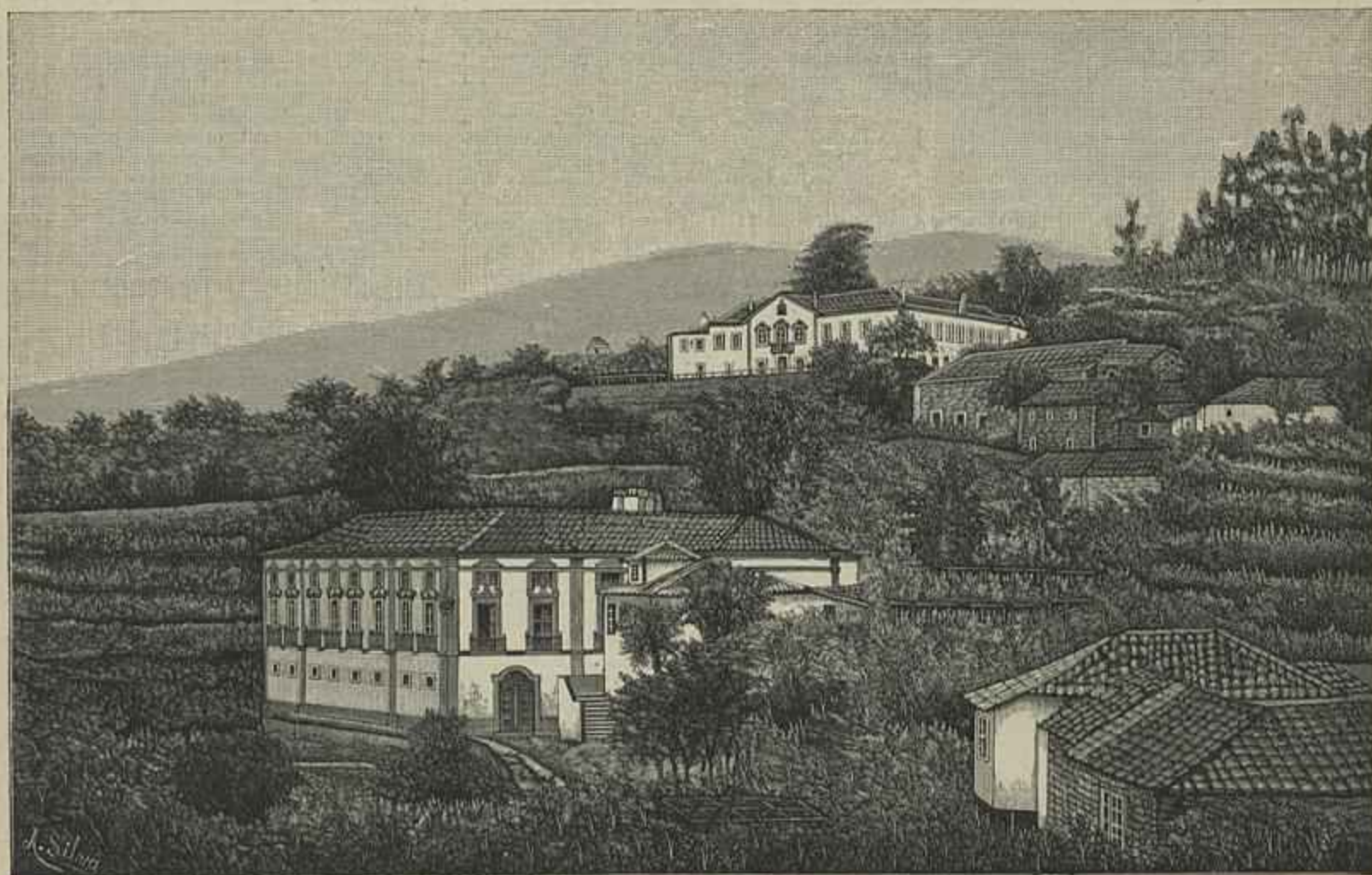
CIDADELHE — 2.ª VISTA

Diz-se que é da mais prodigiosa magnificenciae