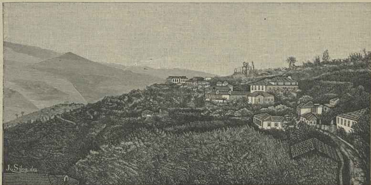
CIDADELHE — 1.ª VISTA