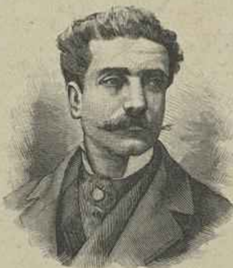
CONDE DE ALMEDINA FALLECIDO EM 26 DE SETEMBRO DE 1895

A um caracter justo não podiam deixar de aliar-se os mais nobres sentimentos de caridade e philantropia: assim, dotou a misericordia de Gavião com oito contos de réis; á sua porta nunca a indigencia bateu em vão; a sua casa era quasi transformada em asylo de invalidos; e em testamento deixou um donativo perpetuo annual para ser dado á alumna pobre que mais se distinguiu na escola publica da sua freguezia.