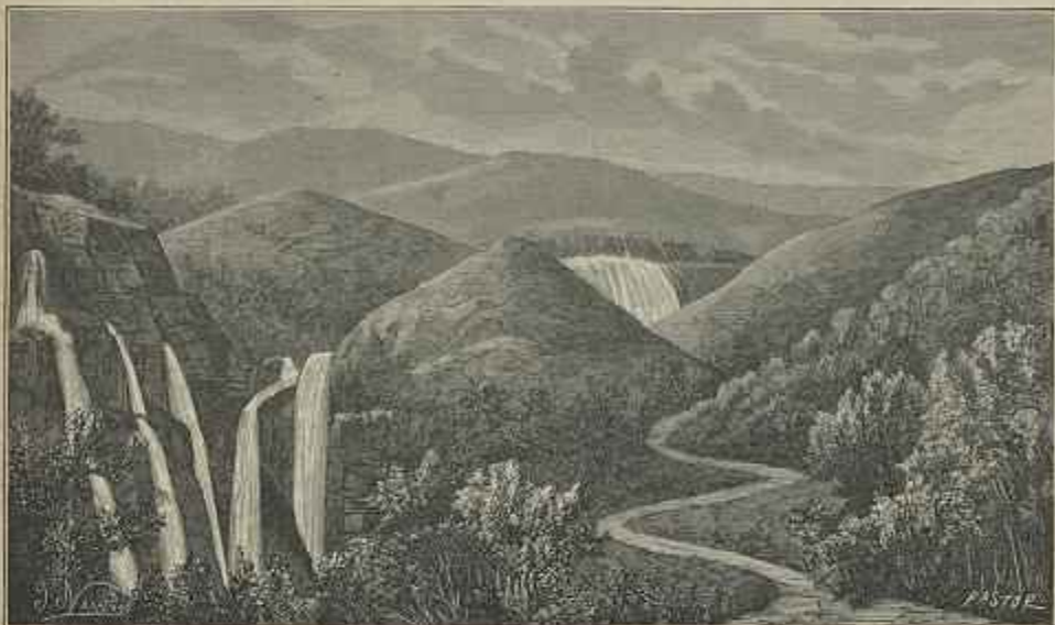
CORDILHEIRA DOS GATTES—QUELANDEN

—Por ordem de Sua Magestade o imperador da Alemanha e rei da Prussia Guilherme II, em janeiro de 1894 esta stella foi aqui posta em substituição do que o revolver dos tempos estragara, — tal é a modesta e ao mesmo tempo eloquente inscripção acrescentada no fusto do padrão novo, as legendas meio obliteradas que authenticavam a descoberta e posse portugueza do seculo XV.