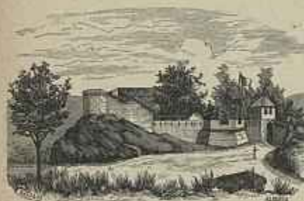
FORTE DE NANUZ — OCCUPADO PELOS MARATHAS INSUBRECTOS

«E por tirar a limpo as chronicas dos reis de Hespanha desno o tempo de Noé, até ao seu, despendeu (D. Fernando) muito com homens doutos a que dava ordenados e tenças e fazia outras