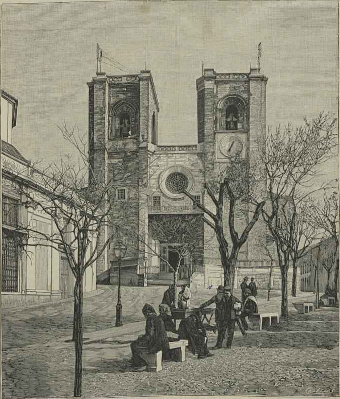
SÉ DE LISBOA, ONDE FOI BAPTISADO SANTO ANTONIO