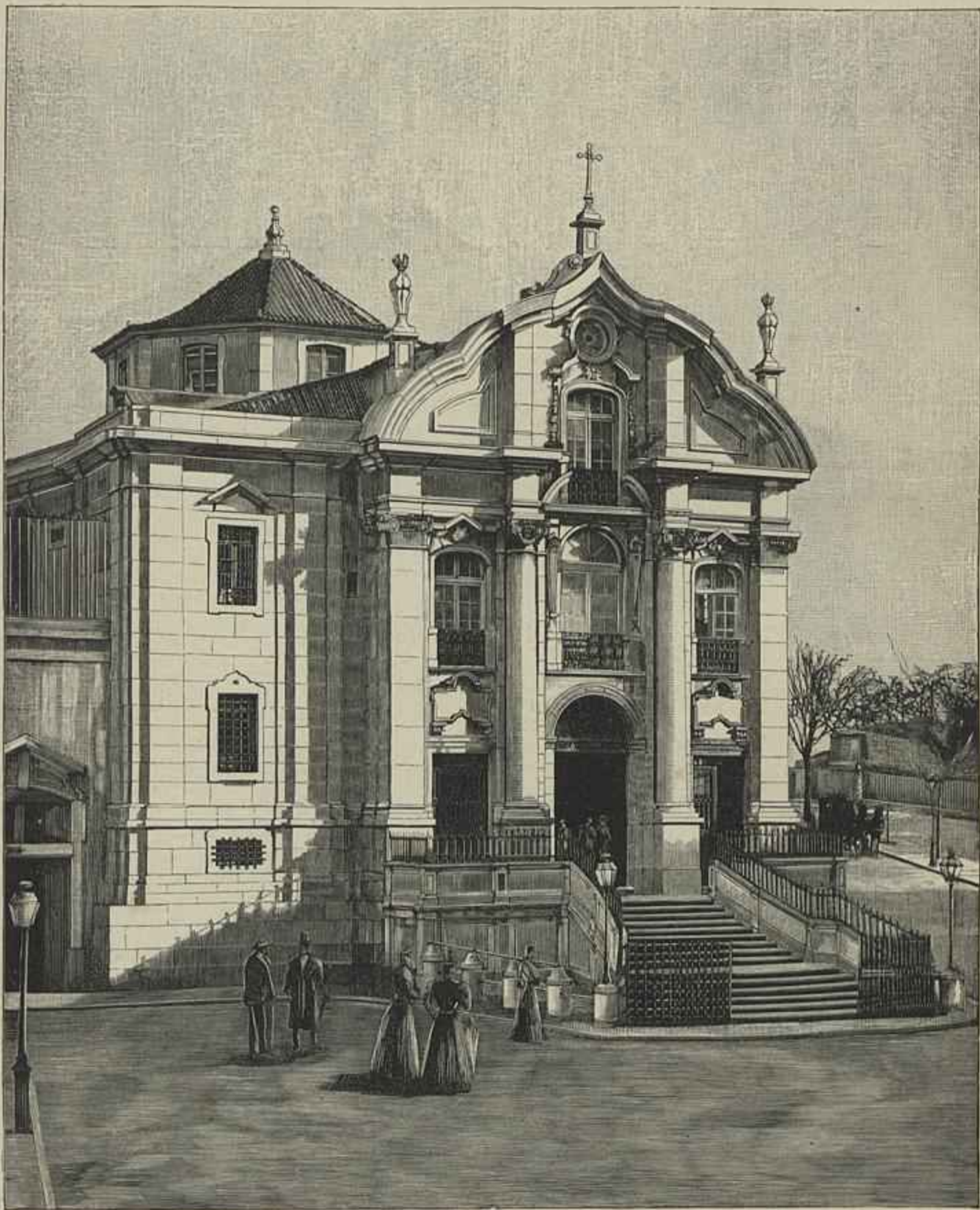
REAL EGREJA DE SANTO ANTONIO, EM LISBOA

EDIFICADA NO LOGAR ONDE NASCEU SANTO ANTONIO