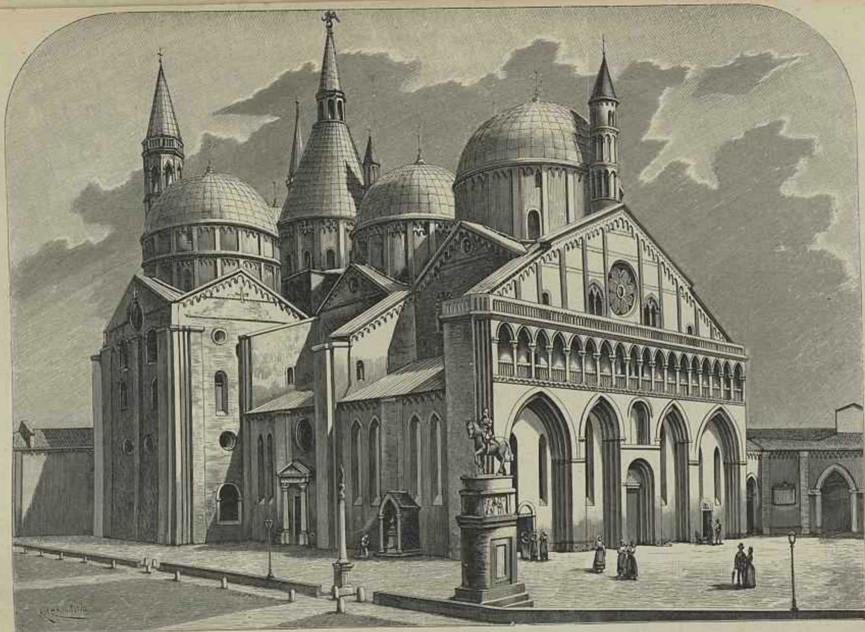
VISTA EXTERIOR DA BASILICA DE SANTO ANTONIO, EM PADUA, ONDE SE CONSERVAM OS RESTOS DO SANTO