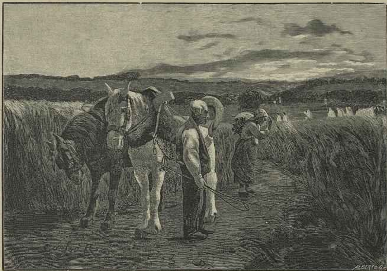
UM ENTERRO NA ALDEIA — QUADRO DO SR. CARLOS REIS