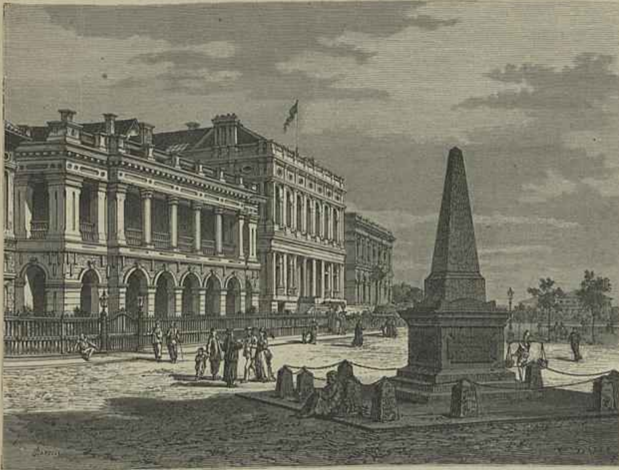
CHINA — PRAÇA DE CHANGAY

tendo, além d'isso, a honra de ser presidente da comissão executiva, que promove a feitura de um monumento para exaltar a memoria do cidadão, cujas virtudes tanto o recommendaram ao agradecimento publico, eu — não podia deixar de comparecer a uma festa, onde, mais outra vez, é exaltada a sua memoria.