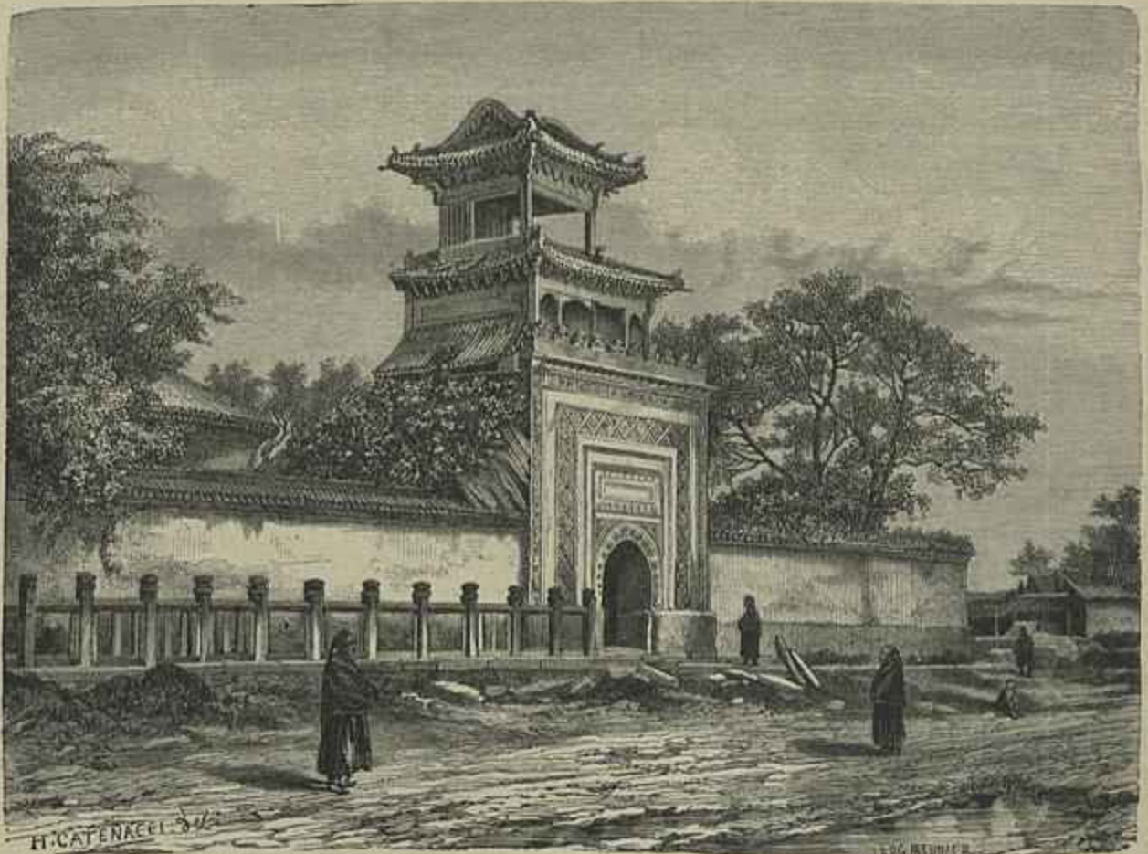
CHINA — MESQUITA MAHOMETANA EM PEKIM

no sagrado, da tolha volante. E' em prosa, em verso: lê-se nos paços; nos acampamentos, canta-se antes das batalhas, depois das victorias, e é consolo nas derrotas. Acompanha os soldados em armas; ouve-se nas igrejas, e consubstancia-se n'um homem, que se chama Marnix de Saint-Aldegon.