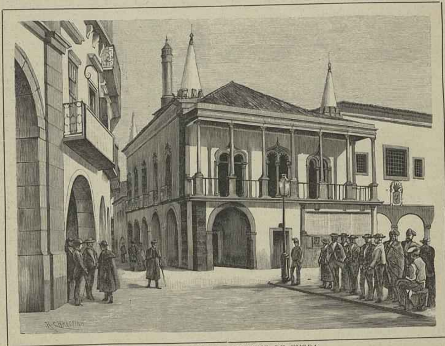
ANTIGOS PAÇOS DO CONCELHO DE EVORA

Muitos dos nossos veteranos da campanha peninsular, que acertaram a percorrer o mesmo itinerario, recordar se-hão, sem duvida, com gratidão e saudade, da franqueza com que foram acolhidos por seus hospitaleiros padrões . Outro tanto se não pôde dizer da gente de Cidade Rodrigo; quer-me parecer que não haverá, á face da terra, raça mais perfida e desleal. Muitos d'elles, vendidos á causa franceza, e subornados pelos espiões, praticaram toda a casta de picardias e traições contra quantos inglezes tiveram a desfortuna de traspôr os humbraes de suas portas. Nem por isso guardavam mais lealdade aos seus, e vou contar um caso em que o delicto foi aliás castigado do modo mais cruel e barbaro. Um hespanhol, homem fidalgo, sobre quem recahiram suspeitas de traição — talvez por que acertasse a menoscabar